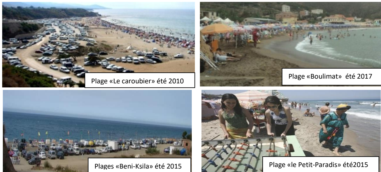
Figure 2. Le flux des estivants nationaux sur les plages de la région.

Les images, prises par l'auteur, montrent le rush d'estivants qui viennent fréquenter les plages de la région. Sur la plage «le Petit-Paradis» située dans la côte-est d'Azeffoun limitrophe avec la région littorale de Beni-Ksila, l'image nous renseigne sur la pratique touristique des nationaux où nous voyons les formes d'imitation des modèles occidentaux se combinent avec les formes inventées inhérentes aux cultures locales.