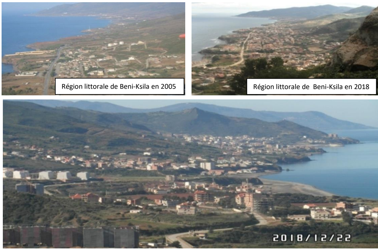
Figure 3. Rythme d'urbanisation tout au long de la région littorale de Beni-Ksila dans la côte ouest Bejaia.

destinées exclusivement à la location touristique, ou encore dans la réalisation de structures d'accueil touristique (hôtels, résidences touristiques et tous les équipements