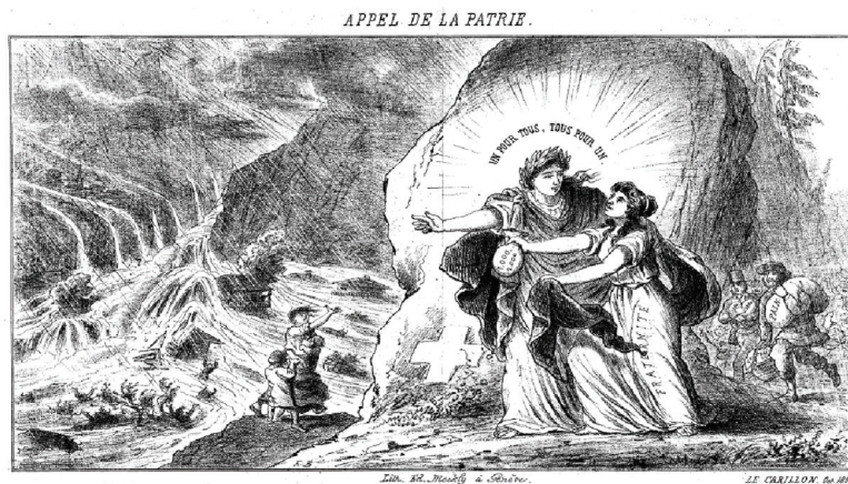
Abb. 2: Appel de la patrie au profit des inondés de la Suisse orientale. Genf o.D. (BAR E 21 21715).

Der Bundesrat übernahm die Führung dieser Solidaritätswelle, indem er am 14. Oktober einen Spendenaufruf an Schweizer im In- und Ausland erließ (BBl III/1868, S. 519f), der durch die Presse weit verbreitet wurde. In diesem Aufruf erklärte er die Ereignisse offiziell zum Landesunglück und gab der Hoffnung und Zuversicht der Betroffenen Ausdruck, daß die Miteidgenossen in alt bewährter Liebe und ewiger Treue [ ... ] eingedenk [ihres] bedeutenden Namens und hinschauend auf das Vorbild [ihrer] Väter auch dieses Mal zu Hilfe eilen würden. Mit dem Wahlspruch Einer für Alle und Alle für Einen! , der die gesamte Spendensammlung dominierte, beschwor der Bundesrat die Einheit der Eidgenossen herauf.