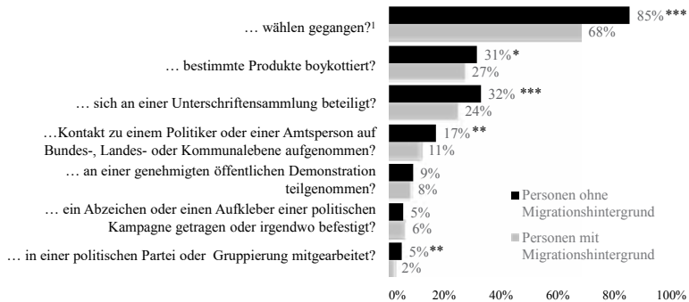
Abbildung 1: Politische Partizipation von Personen mit und ohne Migrationshintergrund

Anmerkung: Eigene Berechnungen; European Social Survey 2010; * p \leq .05 , ** p \leq .01 , *** p \leq .001 ; Frage: „Haben sie im Verlauf der letzten 12 Monate irgendetwas davon unternommen?"; N_{\text{ohne MH}} = 2391-2404 ; N_{\text{mit MH}} = 627-628