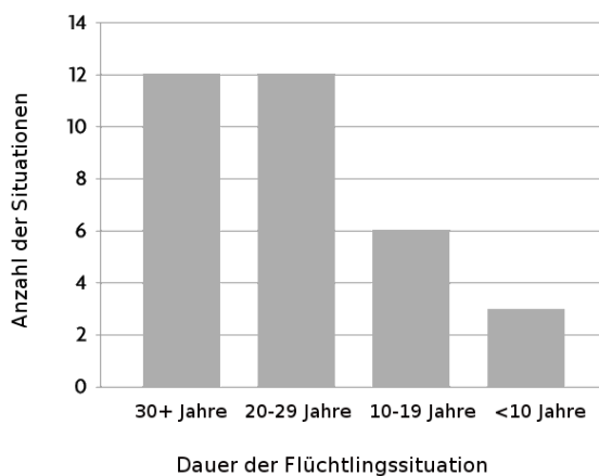
Abbildung 1 Anzahl und Dauer der Situationen von Langzeitvertriebung