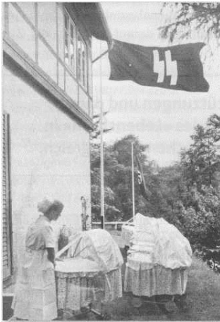
Abbildung 2: Schwester in einem Lebensborn-Heim.