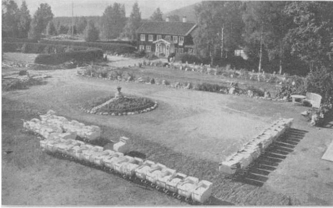
Abbildung 1: Lebensbornheim in Hural Verk, Norwegen.

dem war den Nationalsozialisten ein ernstes Anliegen. Schon bald zeigte sich jedoch, dass die Kapazitäten in den Lebensbornheimen bei Weitem nicht ausreichten, so dass nicht alle »wertvollen« Mütter und Kinder in einem Lebensbornheim unterkommen konnten (Olsen, 2004).