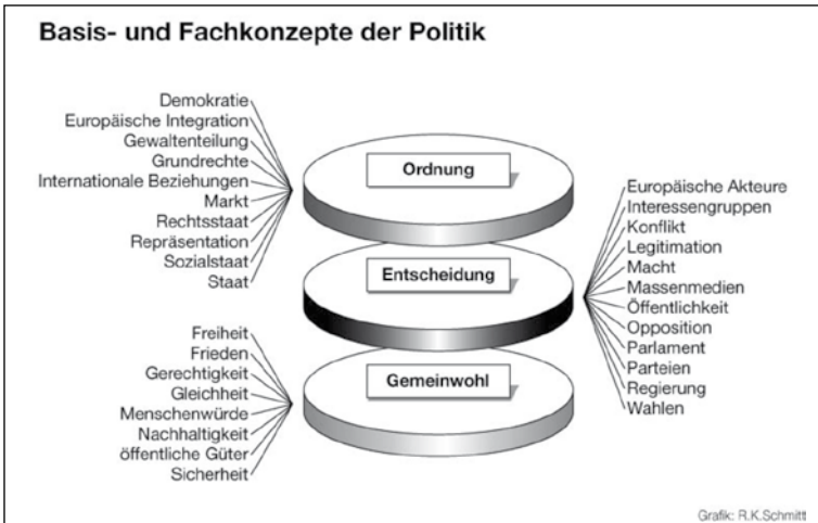
Schaubild 1: Weißeno, Detjen, Juchler, Massing/Richter, 2010, S. 15.

Die Autor/-innen des Modells des Fachwissens haben 30 Fachkonzepte und weitere dazu gehörende konstituierende Begriffe politikdidaktisch motiviert ausgewählt. Sie beziehen sich auf die zentralen Elemente der Domäne Politik und definieren das schulische Grundlagenwissen für die Primar- und Sekundarstufen. Insgesamt entsteht mit diesen 30 Fachkonzepten ein Geflecht, eine strukturierte Vernetzung, die sich dazu eignet, auch unbekannte politische Phänomene, Ereignisse und Prozesse fachsprachlich zu beschreiben, zu analysieren und zu reflektieren. Jedes Fachkonzept ist mit konstituierenden Begriffen weiter konkretisiert. Dadurch ist insgesamt ein Korpus von 30 Fachkonzepten zu vernetzenden Begriffen entstanden, der als Fachsprache den Schüler/-innen von der Primarstufe bis zum Abitur zu vermitteln ist. Dieser Wortschatz entspricht den lernpsychologisch begründbaren Anforderungen für den Erwerb einer Fachsprache. Sie ist für fokussierende Bildungsstandards angemessen.