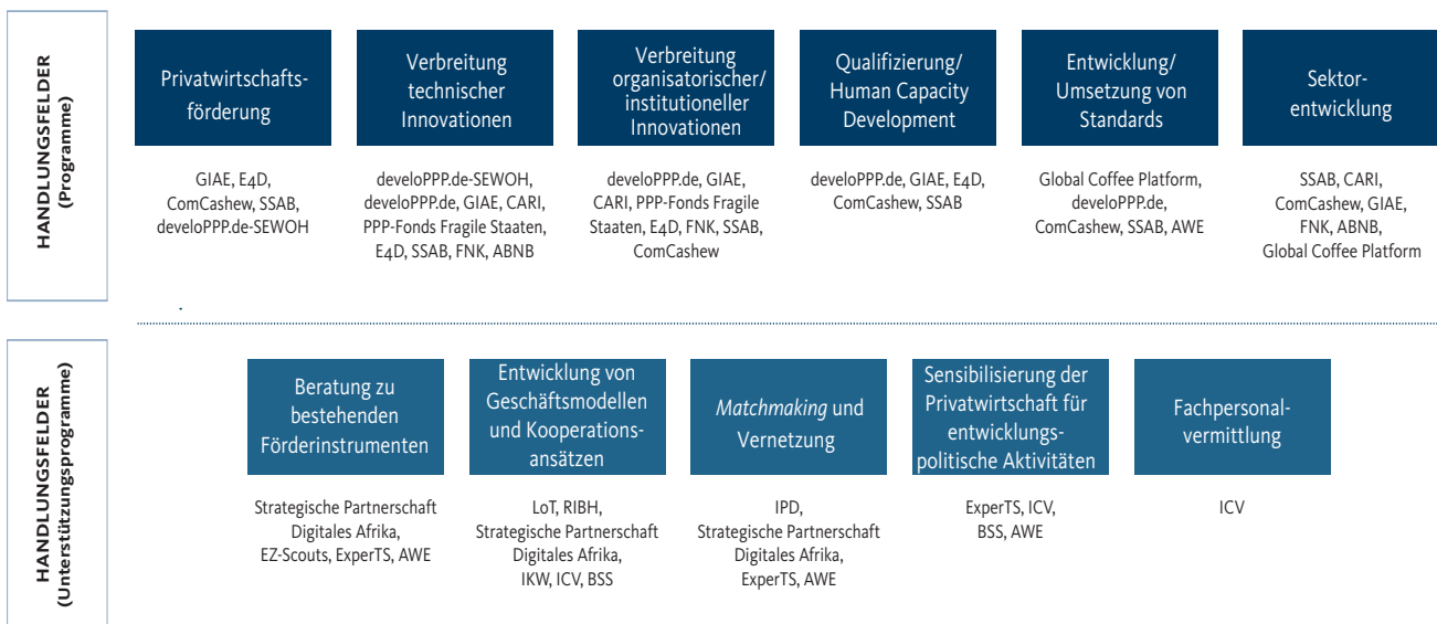
Abbildung 2: Handlungsfelder von Programmen und Unterstützungsprogrammen mit Bezug zur ZmWA