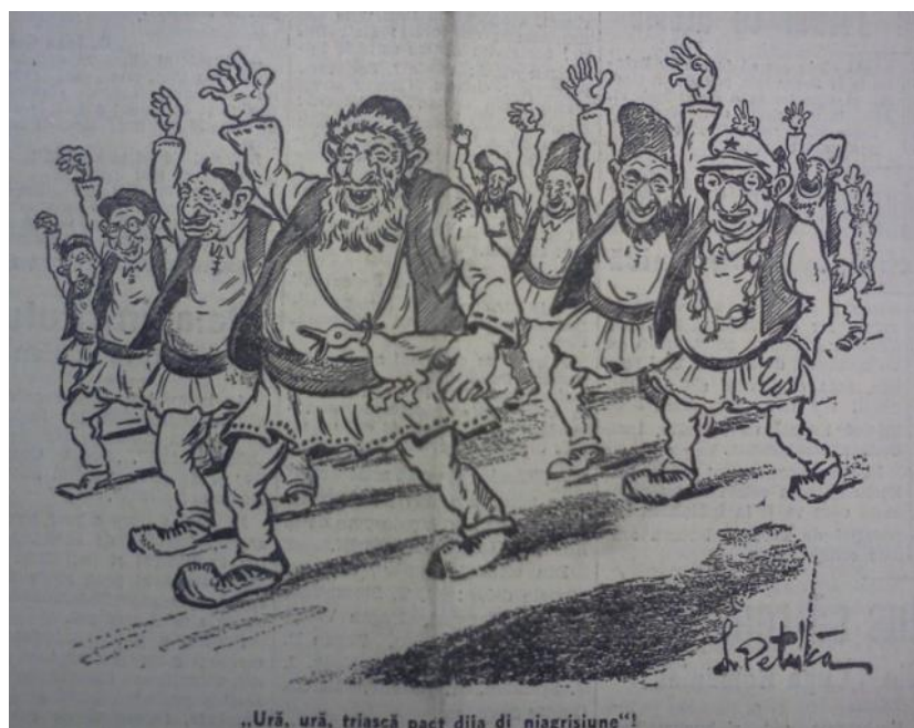
Figura 11 „Porunca Vremii”, anul VI, nr. 938 din 2 decembrie 1937