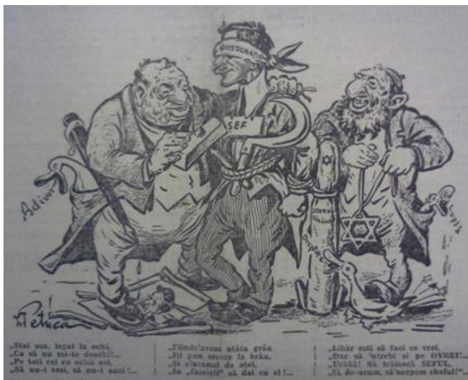
Figura 10 „Porunca Vremii”, anul VI, nr. 932 din 27 noiembrie 1937