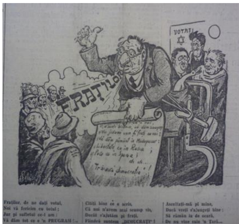
Figura 15 „Porunca Vremii”, anul VI, nr. 940 din 4 decembrie 1937