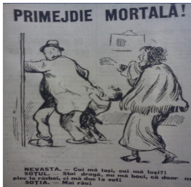
Figura 6 „Lupta”, anul 16, nr. 4854 din 14 decembrie 1937