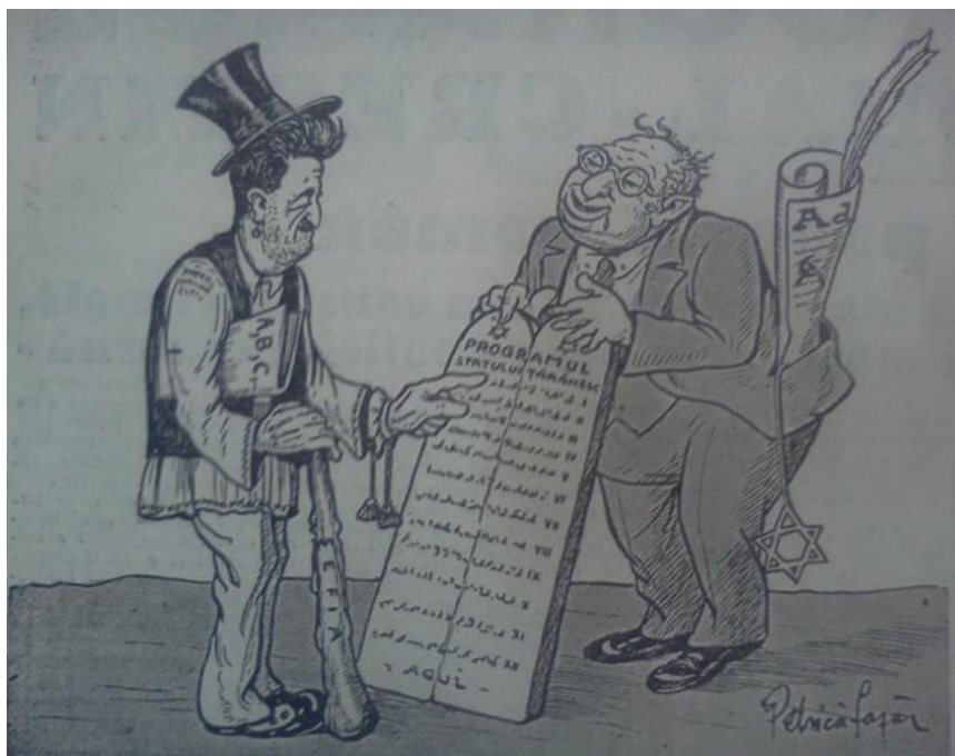
Figura 14 „Apărarea Națională”, anul XIV, nr. 46 din 19 noiembrie 1937