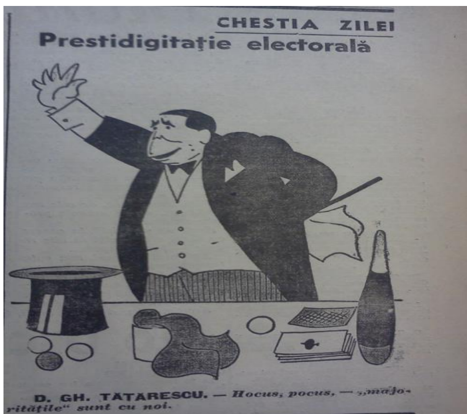
Figura 7 „Adevărul”, anul 51, nr. 16533 din 20 decembrie 1937