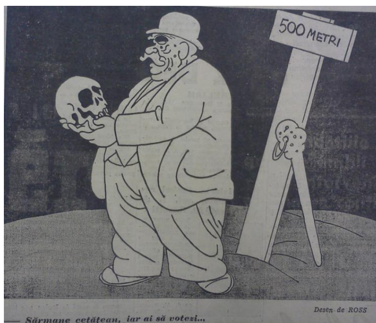
Figura 4 „Adevărul”, anul 51, nr. 16526 din 12 decembrie 1937