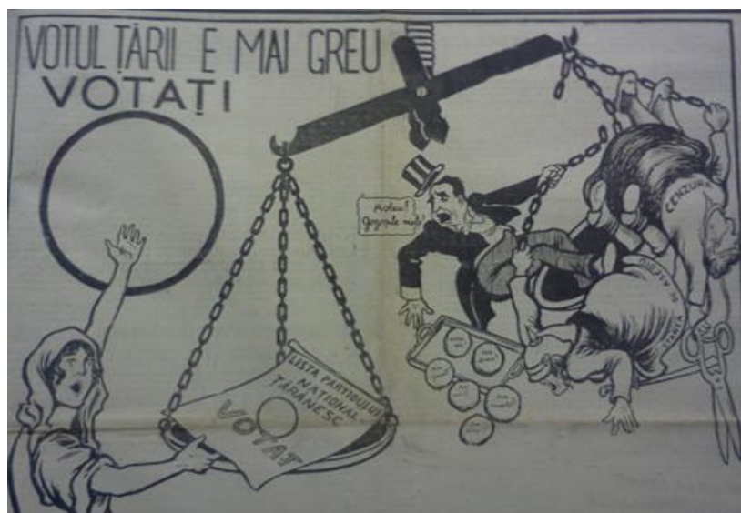
Figura 2 „Dreptatea”, anul IX, nr. 3028 din 19 decembrie 1937