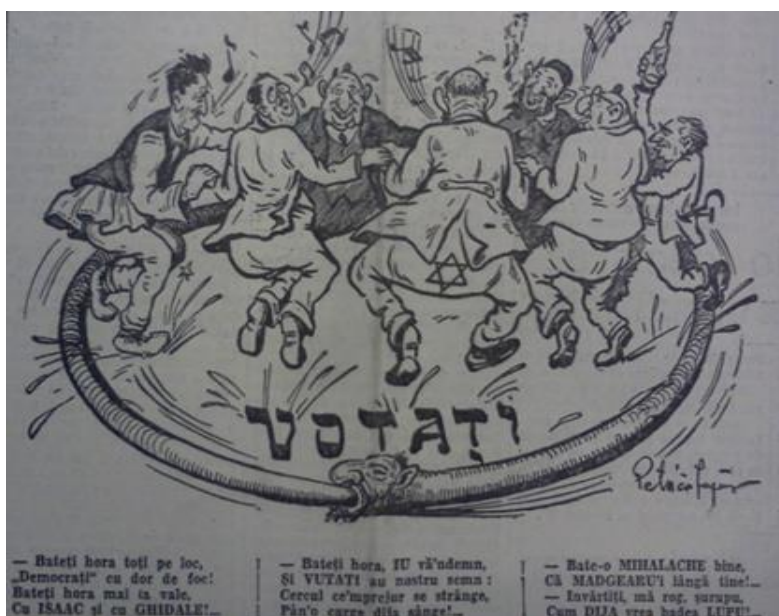
Figura 16 „Porunca Vremii” din 14 decembrie 1937, anul VI, nr. 949