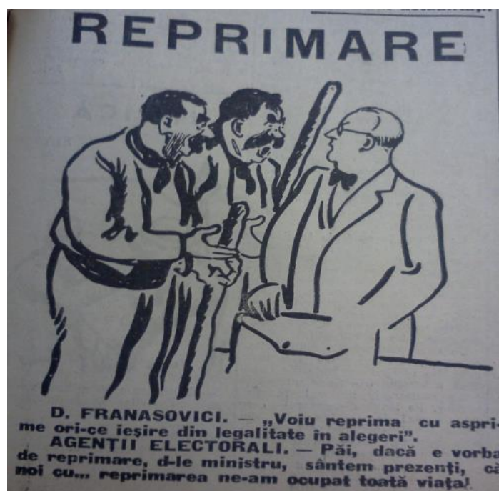
Figura 5 „Lupta”, anul 16, nr. 4829 din 20 noiembrie 1937