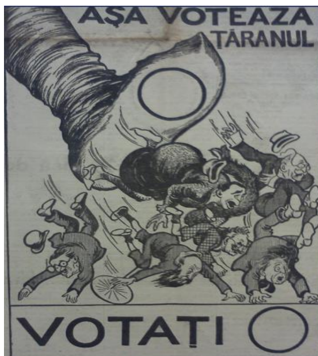
Figura 1 „Dreptatea”, anul XI, nr. 3019 din 9 decembrie 1937