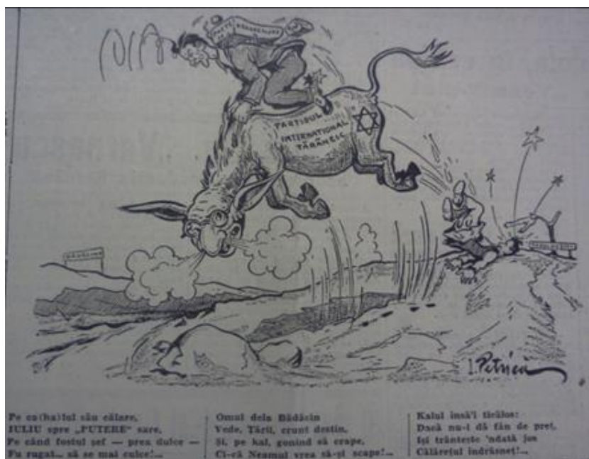
Figura 13 „Porunca Vremii”, anul VI, nr. 936 din 1 decembrie 1937