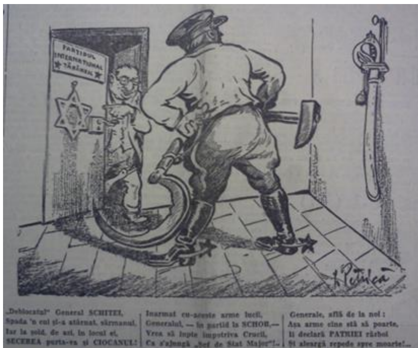
Figura 12 „Porunca Vremii”, anul VI, nr. 935 din 30 noiembrie 1937