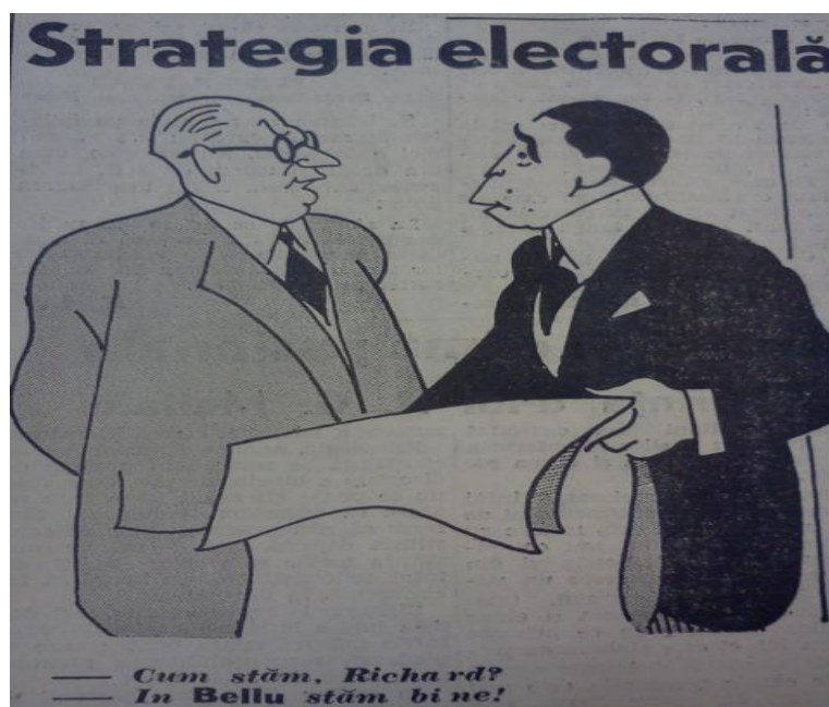
Figura 3 „Adevărul”, anul 51, nr. 16512 din 26 noiembrie 1937