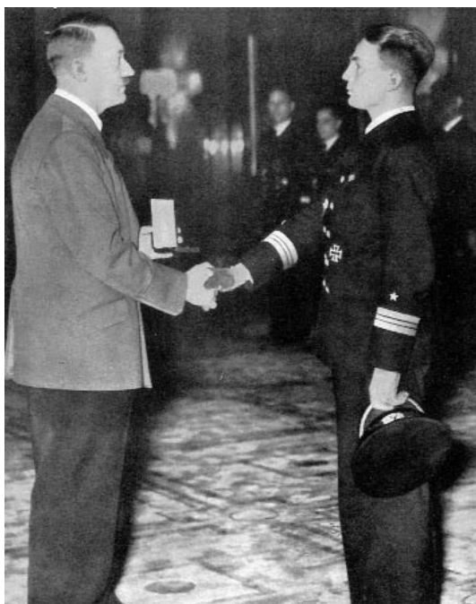
Abb. 8 Adolf Hitler verleiht am 18. Oktober 1939 in der Berliner Reichskanzlei an Kapitänleutnant Günther Prien, Kommandant von U 47, das erste Ritterkreuz des Eisernen Kreuzes.