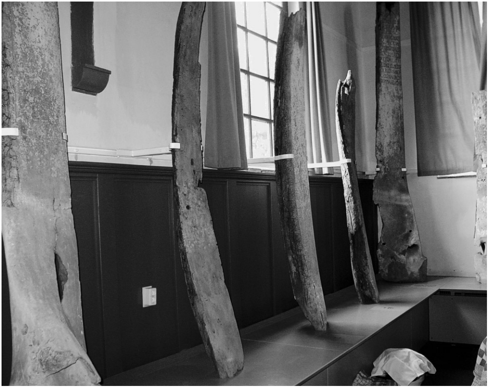
Abb. 5 Die neue Präsentation in der Kirche auf Vlieland.

Abschilferungen mit Araldit fixieren und Risse mit Porion füllen, zögerte jedoch noch, weil er neue Entwicklungen in Hinsicht auf mögliche Mittel und Techniken noch nicht kannte. Während dieser ersten Überlegungen ereignete sich – glücklicherweise – ein Malheur: Einer der kleineren Kiefer fiel zu Boden und zerbrach in zwei Stücke. Der Kiefer wurde den »Museumstechnischen Werken« in Groningen angeboten mit dem Auftrag, die Bruchstücke zu leimen, zunächst jedoch einige Versuche an den Bruchflächen durchzuführen. Hierdurch ließen sich einige Sachverhalte überprüfen, da die Flächen bei einer sofortigen Verklebung dem Blick wieder entzogen worden wären. Auch erlaubte der Bruch einen Blick ins Innere des Knochens. Der Zustand des Knochens bestimmte natürlich stark die Richtung der Fragestellung und Proben. Wie hoch ist die Absorption (im Hinblick auf eine Veranschlagung der Materialkosten)? Welche Abweichung ergibt die Verfärbung des einen Mittels, wie störend ist der Glanz des anderen Mittels? Zu unserer Beruhigung stellte sich heraus, daß der Zustand des Knochens nicht halb so schlimm war wie erwartet: er war stark und sehr hart. Das größte Problem war das Abschilfern des »Rückens«, der erhabenen Seite der Knochens.