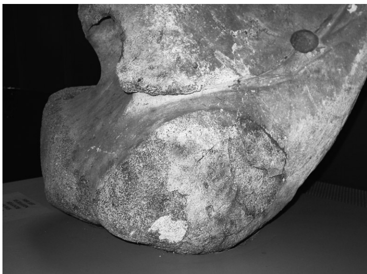
Abb. 4 Eine der vergleichsweise gut erhaltenen Hohlseiten nach der Konservierung.

beschrifteten Vorderseiten der Kiefer lagen mehr oder weniger im Windschatten. Weil die Rückseiten das meiste Regenwasser aufnahmen, zeigten diese Seiten auch die größten Schäden durch die Ausdehnung gefrorenen Regenwassers in Form von Rissen und Abschlüpfungen. Weiterhin hatte das Regenwasser an den Stellen, an denen die Kiefer in der Erde verschwanden, die Denkmäler ringsum angefault. Der Schutz durch die Kirchenmauern war eine klare Verbesserung, aber vollkommen sicher – oder gar »museumssicher« – war ihre neue Lage nicht.