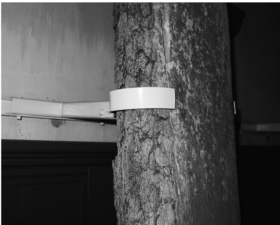
Abb. 6 Detail der neuen Haltevorrichtung.

Kreuzkirche mit Haupteingang im Süden). Die vorgesehene Stelle in der Kirche mußte allerdings unerwartet geändert werden wegen des während der Restaurierung der Kirche festgestellten hohen Alters der Kirchenbänke in diesem Bereich. Ursprünglich sollten die Bänke entfernt werden, mußten nun aber erhalten bleiben. Deshalb wurde das Podium auf die östliche Seite des Südschiffes verlegt. Die Maße blieben dieselben, hoch genug, um über die Heizkörper hinauszuragen, und flach genug, um die Kiefer von der aufsteigenden Heizungsluft freizuhalten. Die Länge war berechnet für sechs Kieferhälften mit genügend Zwischenraum zwischen den einzelnen Denkmälern, um diese zur Geltung kommen zu lassen und noch Raum für einen siebten Kiefer zu schaffen: entweder den Kieferstumpf aus dem örtlichen »Besucherzentrum«, der angeblich vom Friedhof stammt (van Deinse zeichnete diesen 1918, ließ ihn aber stehen und mußte 1926 feststellen, daß er verschwunden war; seine Zeichnung läßt vermuten, daß es sich um denselben Kieferstumpf handelt), oder eine Replik des Exemplars, das 1920 nach Leiden gebracht worden war.