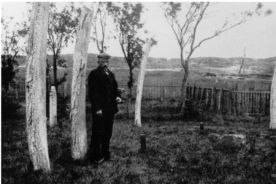
Abb. 3 Der Walfänger Klaas Tot auf dem Vlieländer Friedhof bei den Grabdenkmälern.

und stellte einen Eimer darunter. Unterstützt durch das Rollen und Schaukeln des Schiffes lief dann das besonders feine Knochenöl durch das Loch in den Eimer. 4 Bei der Rückkehr galten die entölten Knochen als beinahe wertlos. In den Viehzuchtgebieten von Holland und Friesland wurden als Scheuerpfosten für die Rinder auf die Weiden gestellt. Auch wurden Unterkieferhälften als Baumaterial für Zäune, Schulterblätter für Türstufen genutzt.