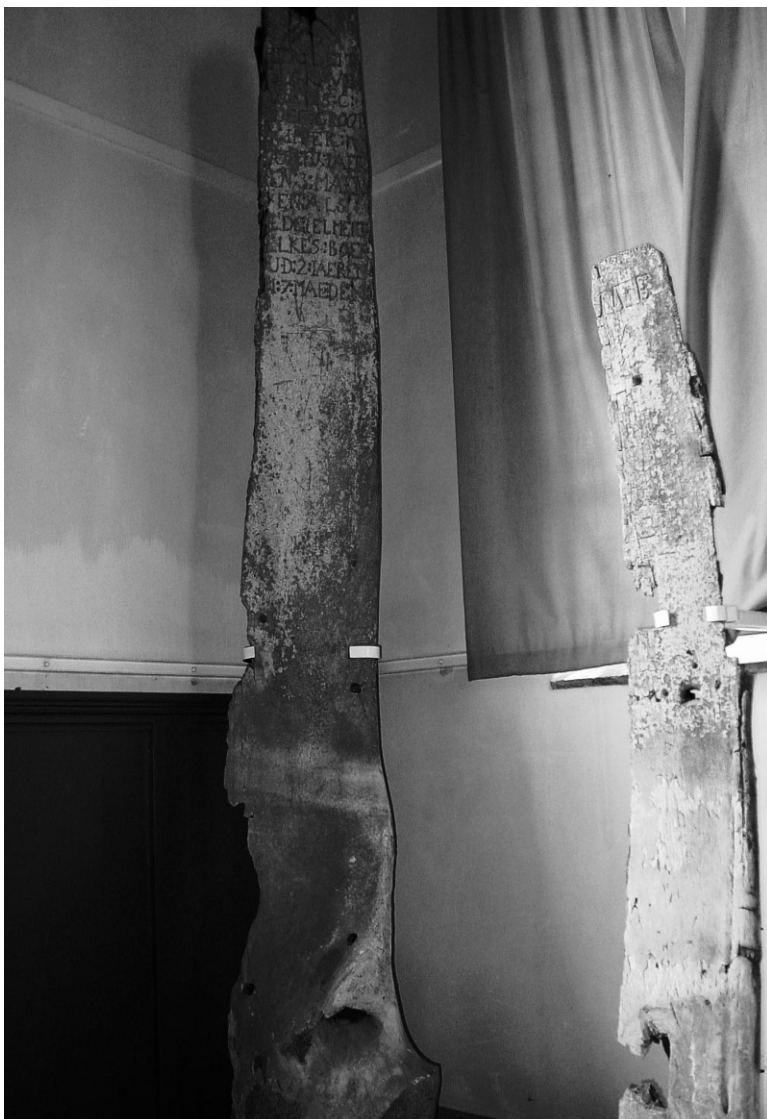
Abb. 7 Vorderansicht eines der größeren Kieferknochen mit Inschrift in neuer Präsentation.