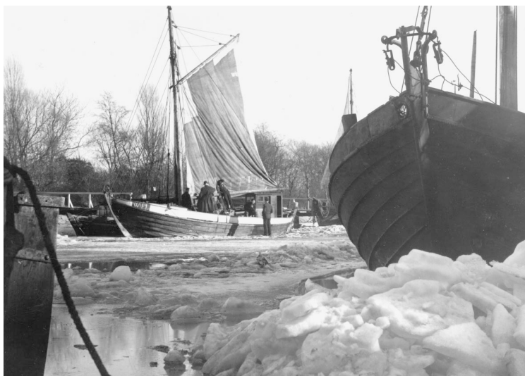
Abb. 12-13 Um den Druck auf den Rumpf zu verhindern, wurden Fischkutter und Passagierdampfer rundherum »aufgeeist«.