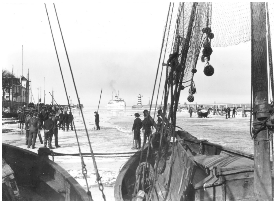
Abb. 15 Bei auslaufendem Strom wurden die Schollen mit Stangen und Booten zur See hin geschoben.

anerkannte, lehnte die Landesregierung unter dem Protest des Stadtparlaments eine Beteiligung erst einmal wieder ab.