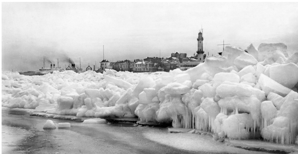
Abb. 10 Viele Dampfer hatten 1929 Warnemünde als Nothafen aufgesucht. Besonders am Warnemünder Westmolenkopf türmte sich in diesem Winter das Packeis meterhoch auf. (Heimatmuseum Warnemünde)

unter Risiko und zuletzt fast gar nicht mehr durchgeführt werden, weil die Trajektschiffe in den Eisfeldern festsaßen und mit ihnen vertrieben wurden, bis schließlich russische Eisbrecher zu Hilfe kamen.