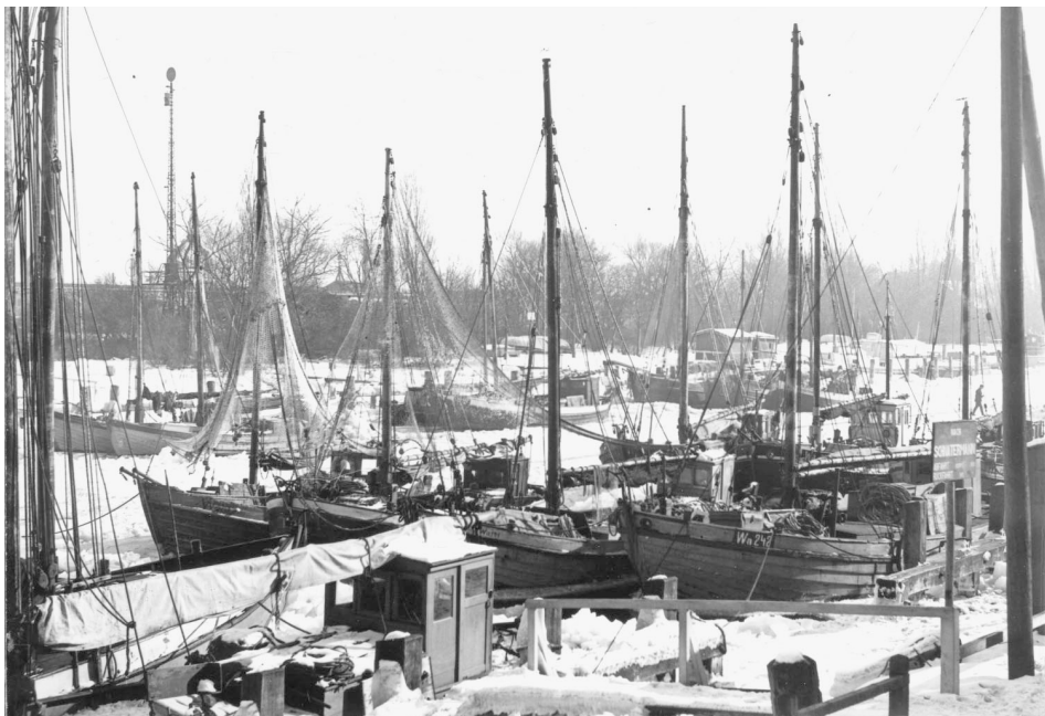
Abb. 11 Die im Warnemünder Strom 1929 eingefrorene Fischereiflotte.

Die Warnemünder antworteten daraufhin nur wenige Tage später dem Deutschen Seefischer-Verein sinngemäß, dass dem Bericht des Vertrauensmannes und Lotsen Stüwe doch unübersehbar zu entnehmen sei, dass der weitaus größte Teil der selbständigen Fischer Wohlfahrtsunterstützung bekomme, welches nun doch gewiss der letzte Schritt sei, und diese Tatsache allein eigentlich schon als Beleg für eine schnelle Hilfe in absehbarer Zeit genügen müsste. Nur vier Tage später, am 7. März, kam die Antwort: Das Reich sähe sich nicht in der Verantwortung für die Bereitstellung von Mitteln zur Behebung der Not. Für diese Fürsorge sei es nicht zuständig und wolle deshalb den Ländern die geeigneten Schritte überlassen. Wegen der schlechten Finanzlage sei man lediglich bei der Darlehensrückzahlung und der Zinstilgung zur begrenzten Stundung bereit. Da auch Preußen inzwischen eingegriffen hatte, sollten auch die Warnemünder dringend auf die mecklenburgische Regierung einwirken. Das war in der Vergangenheit allerdings schon mehrfach ohne Erfolg geschehen.