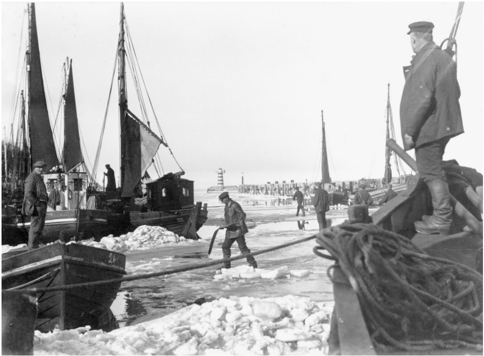
Abb. 14 Im März schnitten die Fischer mit Eisäxten und -sägen im Alten Strom große Schollen heraus.

mit einer Zuschusszahlung seitens des Landes nicht rechnete. 20 Die Stadtverordnetenversammlung aber hatte immerhin schon »vorschüssig« eine Summe von 5000-6000 Mark genehmigt, wofür man auch die Zustimmung des Rates voraussetzte. Damit sollten nach entsprechenden Anträgen erst nur die dringendsten Fälle eine Vorauszahlung in Form eines Darlehens erhalten, vor allem, wenn die Ausfahrt durch Reparaturen verhindert sei. Die sozialdemokratische Fraktion beantragte später laut »Rostocker Anzeiger« vom 27. März 1929, auch die Stellnetzfisher mit einem entsprechenden Darlehen zu versehen. Beide Anträge dieser Hilfsaktion, je über 5400 bzw. 5000 Mark, wurden zusammen behandelt und beschlossen und der Betrag der Warnemünder Verwaltung als Vorschusszahlung überwiesen. Es musste der Fischerei einfach geholfen werden, denn inzwischen waren 40 Fischerfamilien der Armenfürsorge zur Last gefallen, die allerdings ihre Unterstützung später wieder zurückzahlen hatten, weshalb sie ihre Arbeit unbedingt bald wieder aufnehmen sollten. Anerkennenswert ist die Tatsache, dass sich der Warnemünder Fischereiverein an den Stadtrat Dr. Lewerentz mit der Bitte wandte, bei der Verteilung möglichst auch eine Beihilfe für verheiratete Maaten möglich zu machen, die sich sehr stark verschuldet hatten.