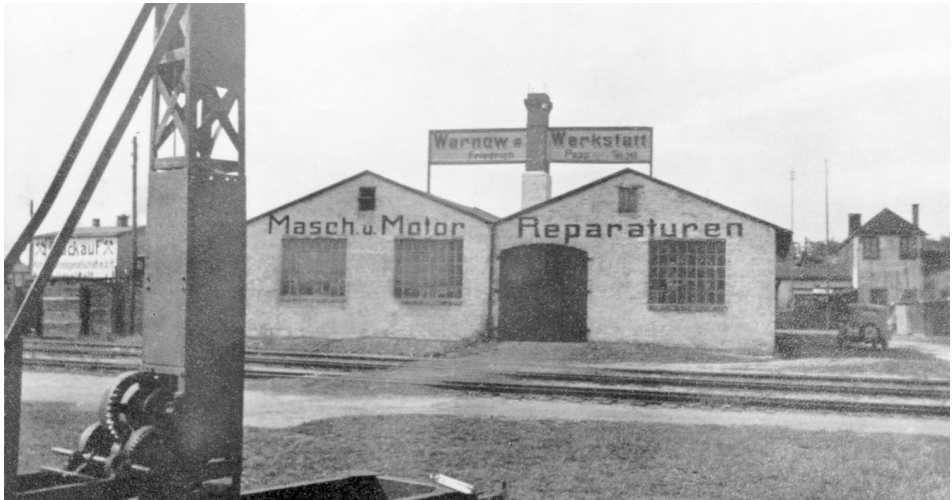
Abb. 6 Die »Warnow-Werkstatt« des Baurates Heinrich Weber.