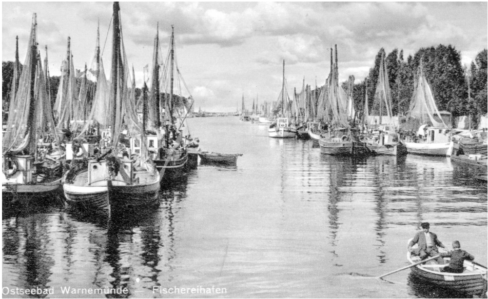
Abb. 2 Der Fischereihafen im Alten Strom von Warnemünde, nach 1930.

auf Seefische als nicht durchsetzbar abgewiesen. Während es in einigen Zweigen der deutschen Wirtschaft ab 1927 Anzeichen für eine positive Entwicklung gab, war bei der Fischerei durch die hohen Lasten infolge verteuerter Betriebsmittel und bedingt durch Absatzstockungen keine wirkliche Besserung zu sehen. Diese litt auch in den kommenden Jahren selbst bei reichlichen Fängen unter dem Missverhältnis zwischen gesteigerten Unkosten und den unzureichenden Preisen sowie unter großen Schwierigkeiten beim Absatz.