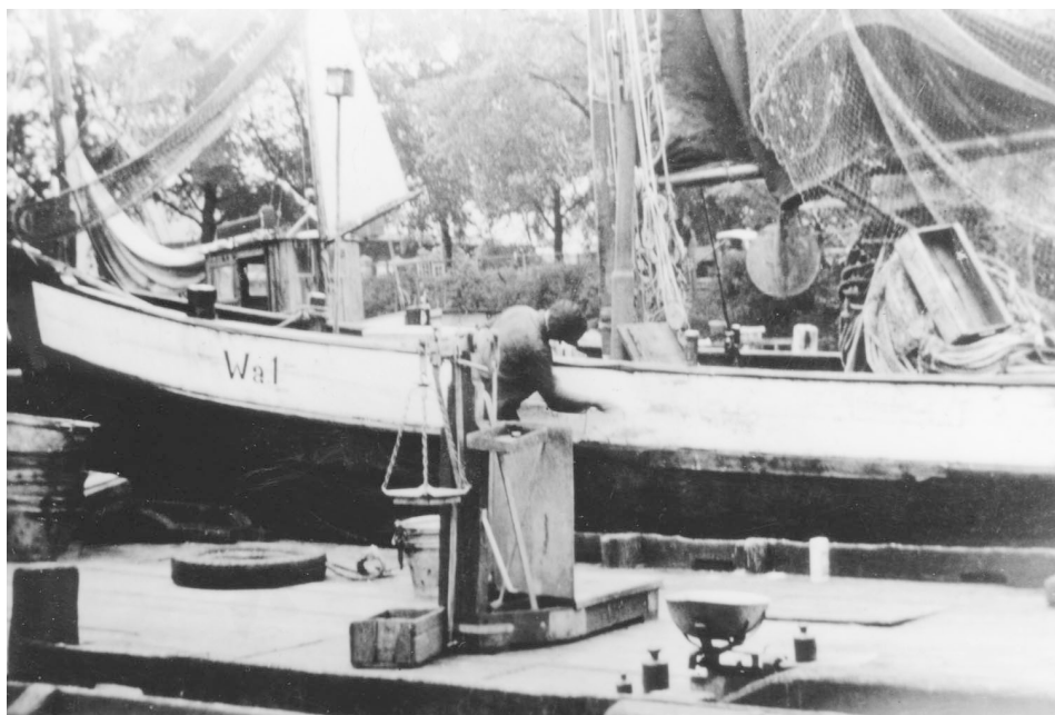
Abb. 4 Die beiden Waagen auf dem Fischbehälter wurden für den sofortigen Handel benutzt.

anderen deutschen Nachbarländern, wie z.B. in Preußen, von den Fischern keine Gewerbesteuern erhoben würden, bitte man darum, auch in Mecklenburg die Fischerei als Erwerb und nicht als Gewerbe zu betrachten. Der Antrag wurde trotz Unterstützung durch den Reichsverband und Hinweis auf die ungünstige wirtschaftliche Lage stets abgelehnt, weshalb man letztlich im Februar 1929 das Rostocker Finanzamt aus Mangel an jeder Verdienstmöglichkeit darum bat, die rückständigen und noch fälligen Steuern zu stunden. 9