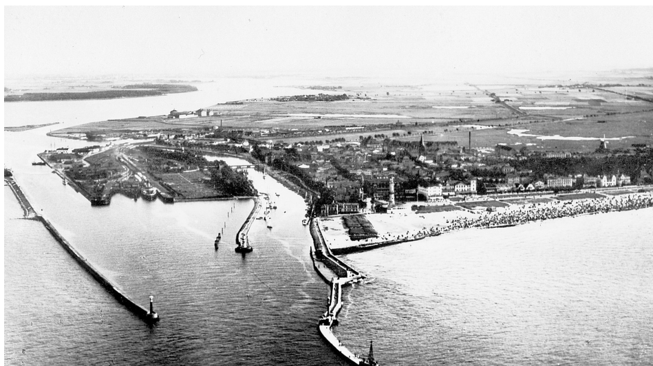
Abb. 1 Luftaufnahme von Warnemünde, um 1925. Rechts der Alte Strom mit Fischereihafen.

1925 stellte das Deutsche Reich erneut Darlehen in einer Gesamthöhe von 2 Millionen Mark zur Verfügung, die wieder nicht reichten, um wenigstens die dringendsten Anträge zu befriedigen. Dafür hätte es 5 Millionen Mark bedurft. Die ausländische Fischerei fügte der deutschen Kleinfischerei weiterhin schweren Schaden zu, und trotzdem wurde die Einführung eines Zolls