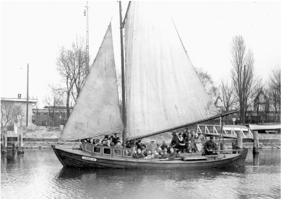
Abb. 25 Fischer Erwin Wendt fuhr als Matrose auf der Motorjolle für Passagierfahrten LUISE III.