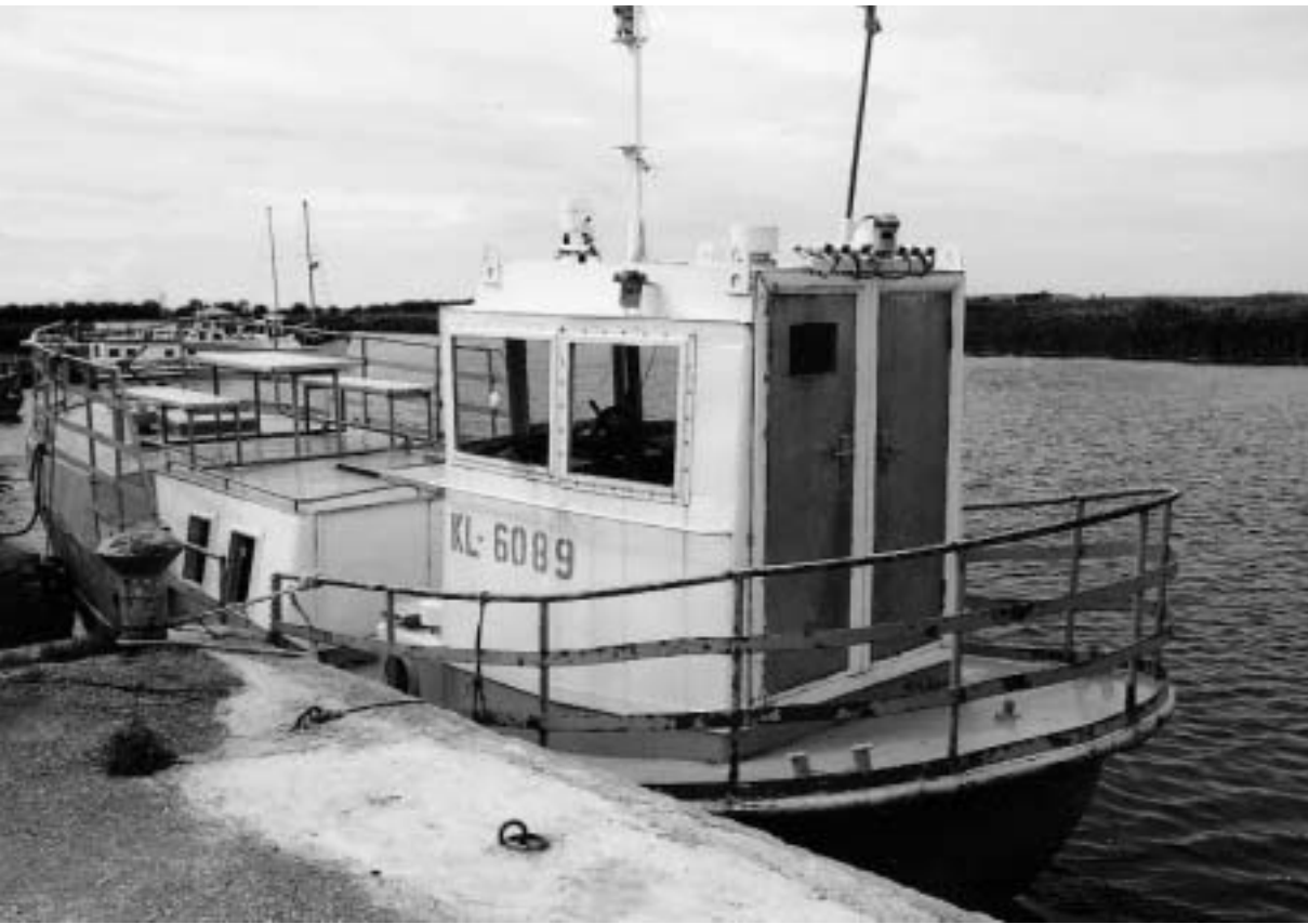
Abb. 18 Für Badegast-Touren umgebauter Haffkutter in Dreverna.

ren, an denen die Ruderboote der »Sozialfischer« festmachen dürfen. Die Boote, mit denen man bei »offenem Wasser« täglich mit der Rute auf Fang geht, gehören zur »Arbeitslosen-Flotte« von Klaipeda. Im Winter setzt man die Köder in Eis-Bohrlöcher, und es wird erzählt, dass man von der Brücke der einlaufenden Frachter oder Fähren aus vor lauter »schwarzen Punkten« kaum die Eisdecke entdecken könne.