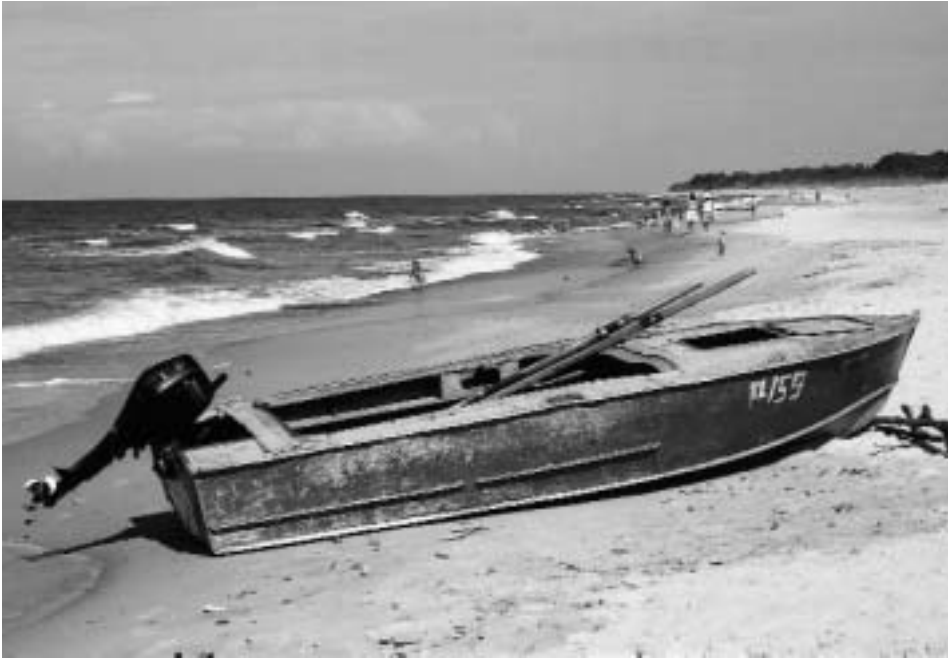
Abb. 15 Strandboote in Klaipeda-Melnrags.