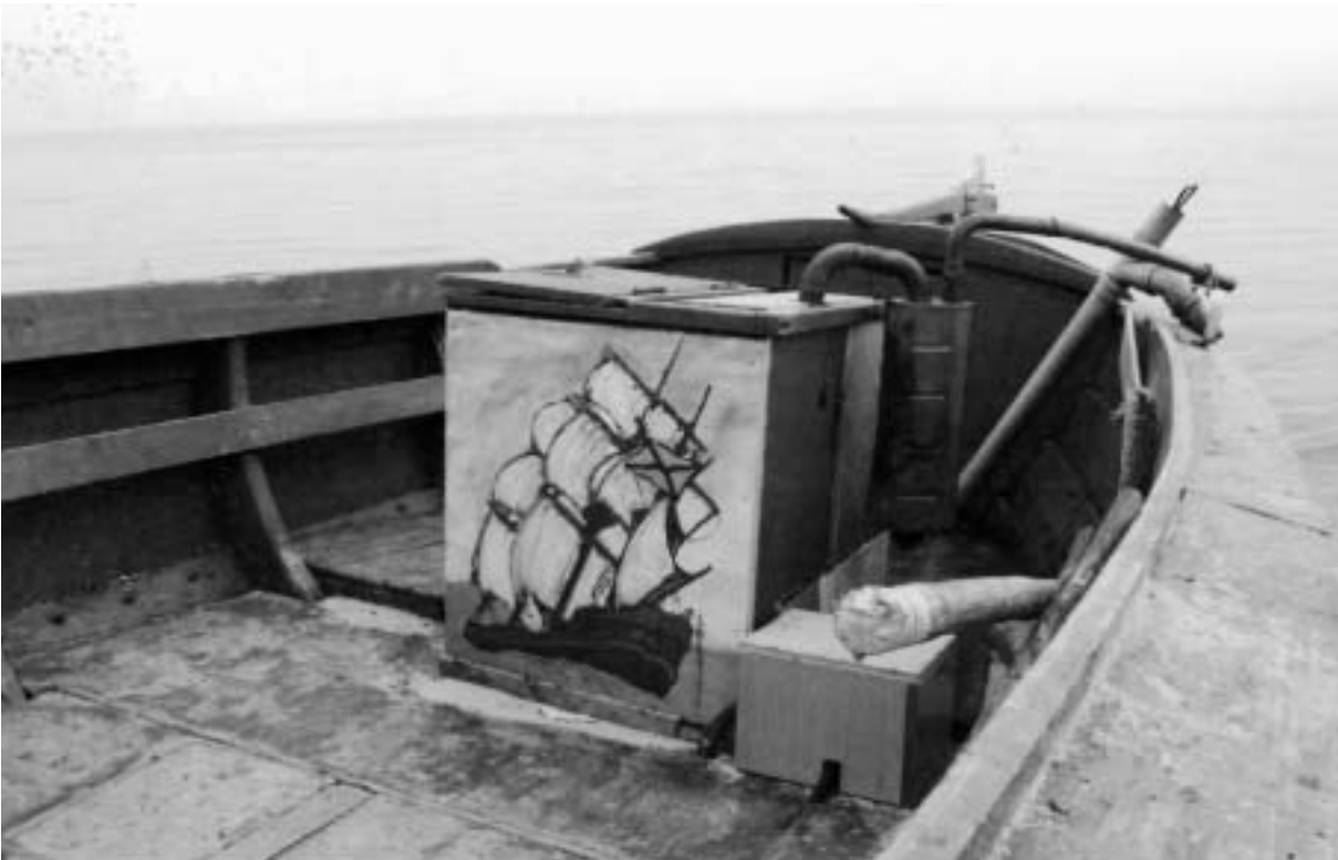
Abb. 2 Strandboot aus Mechelinki, mit Bildschmuck an der Motorhaube.

genen deutschen Häfen Hinterpommerns (Kolberg, Rügenwalde, Stolpmünde und Leba) sowie Ostpreußens (Pillau, Neukuhren und Memel) veranlassten einige kaschubische Fischer, sich zu Beginn der 1930er Jahre in Gdynia gedeckte Kutter von 13 m Länge bauen zu lassen und mit ihnen »echte« Seefischerei zu betreiben. 2