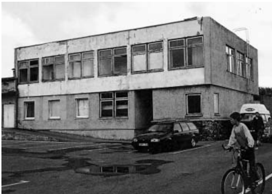
Abb. 14 Hauptgebäude der ehemaligen Fischereikolchosa Nida.

men. Das galt sowohl für die Kurische Nehrung wie auch für die nördlicher gelegenen Strände. Um 1950 begann dann allmählich wieder eine Änderung dieser Situation. In der Mehrzahl waren es wohl Funktionäre aus dem kommunistischen zentralen »Parteiapparat« und »verdiente« Behördenmitarbeiter, die damals in den inzwischen restaurierten, vereinzelt aber auch neu erbauten Hotels und Ferienheimen Erholung suchten. Daneben gab es freilich auch eine Minderheit von Badegästen aus den Kreisen der litauischen Künstler und Wissenschaftler, zum Beispiel Landschaftsfotografen und Maler, aber auch Zoologen und Botaniker. Den Malern waren die berühmten Werke der alten Niddener Künstlerkolonie noch immer ein Ansporn für das eigene Schaffen, und die Ornithologen strebten danach, die Tradition der weltbekannten Nahrungs-Vogelwarte von Rossitten fortzusetzen. Ausländischen Badegästen blieben diese Strände jedoch verschlossen. Den vereinzelt dort noch ansässigen »Alt-Einwohnern« wurden Angehörigenbesuche nur in seltenen Einzelfällen gestattet – selbst als es bereits, ab 1986, eine direkte Fährverbindung zwischen Klaipeda und Sassnitz auf Rügen gab. Diese hatten die Machthaber in Moskau und Berlin allerdings auch nicht aus humanitären Gründen geschaffen, sondern um im Falle eines »Ungehorsams« der polnischen Regierung den strategisch wichtigen Waren- und Militaria-Transfer sicherstellen zu können.