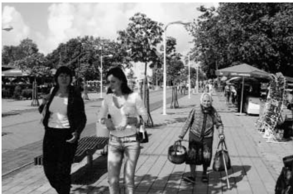
Abb. 11 Der Strand-Boulevard von Palanga.