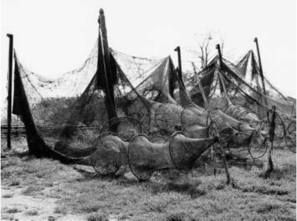
Abb. 13 Bügelreusen am Fischer-Arbeitsplatz Juodkrante-Karwaiten.