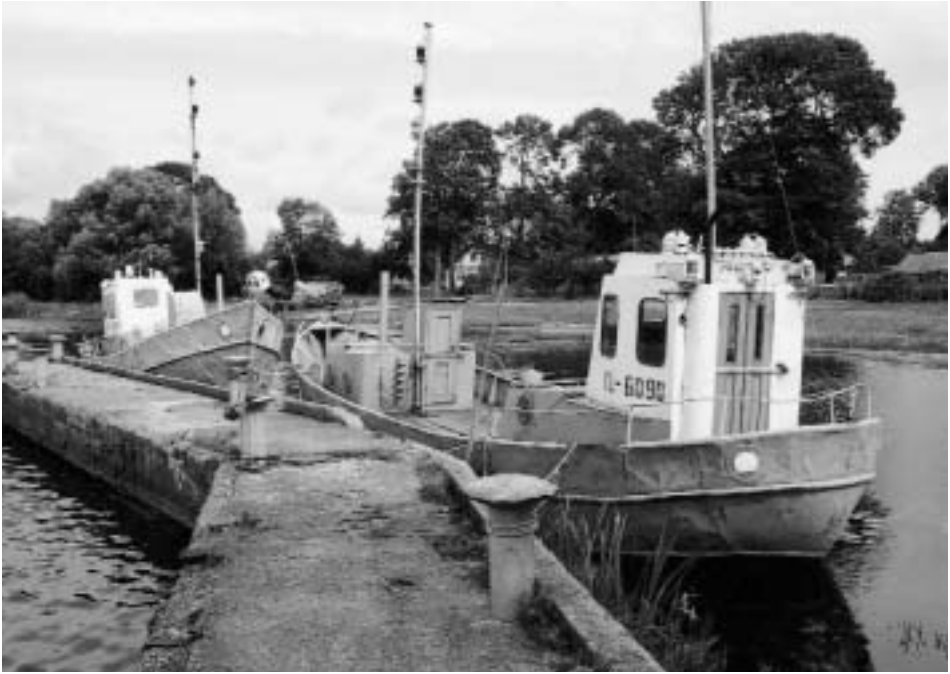
Abb. 12 Stählerne Haff-Kutter in Drevena.