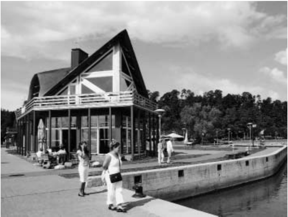
Abb. 16 Das neue Café des Jachtklubs in Juodkrante.