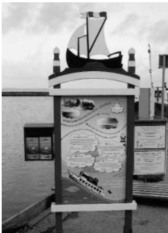
Abb. 19 Werbung für »Stundenfahrten auf dem Kurischen Haff« in Juodkrante.

begrüßt, die zur Ausübung von Tauchsport, Windsurfing und Brandungsangeln animieren sollten. Wenige Kilometer weiter kann man auf dem »International Flugplatz der Region« in Muße die Herkunftsschilder der geparkten Luxuskarossen studieren, und kurz dahinter wird man vom Pumpenrhythmus einer eben erschlossenen Ölbohrstelle empfangen. Notgedrungen enden diese »Ansätze« dann vor der russischen Grenze bei Nida – im losen Sand der majestätischen Dünenberge. Der vorläufige Höhepunkt der Urban-Entwicklung dürfte momentan in Preila liegen: das ehemals als ganz besonders idyllisch gerühmte Fischerdorf präsentiert sich derzeit als Großbaustelle für luxuriöse Villen und Ferienheime.