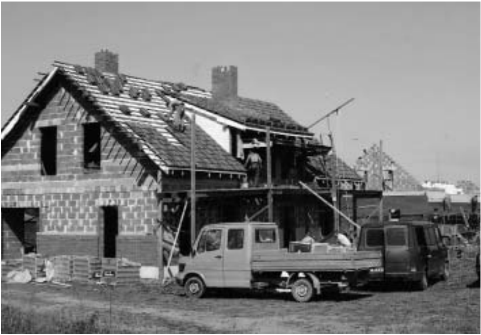
Abb. 17 Baustellen in Preila.

fischerei? In Juodkrante, Nida, Vente, Draverna und Rusne blieb von den dort stationiert gewesenen drei, vier Dutzend Kleinkuttern nur ein Restbestand von etwa zwölf Booten in Fahrt. Die anderen wurden verkauft, vergammeln im Schilf oder wurden zu Passagierfahrzeugen umgerüstet. Den noch standhaltenden Fischern genügt ein Kleinkutter pro Partie zum Setzen und Hieven der Reusen sowie der wenigen noch benutzten Stellnetze. Der eine oder andere Einzel-fischer hat sich für seinen offenen Handkahn einen gebrauchten Außenbordmotor angeschafft. In den meisten Fällen stammen solche »Neuerwerbungen« aus aufgelösten Armeebeständen.