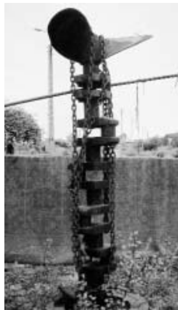
Links Abb. 6 An der Landspitze von Rewa steht ein geschmiedetes Kreuz als Wegemarke zur neu gebauten Seebrücke (2004). – Mitte Abb. 7 Von einem Fischer geschnitztes Kruzifix an der Hafeneinfahrt von Kuznica. – Rechts Abb. 8 Kurbelwelle und Schiffspropeller als »Hauszeichen« in Kuznica.