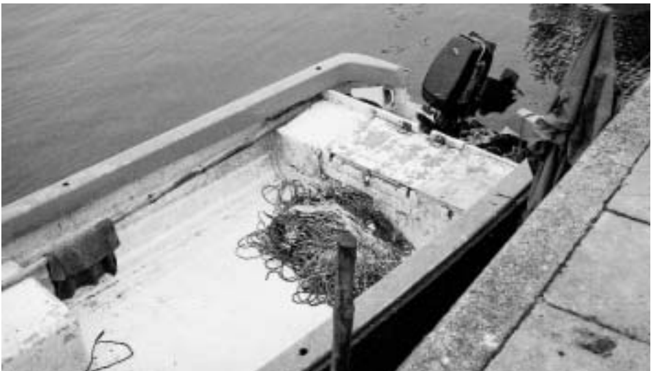
Abb. 4-5 Motorisierte Plastik-Fischerboote im Frischen Haff (Kały Rybacki).

wannen« in den Größen von 4 bis 10 m Länge, in vielen Fällen angetrieben von starken Außenbord-Heckmotoren japanischer Herkunft. Ein großer Teil dieser Boote wird seit 1996 in der neuen Werft von Kały Rybacki hergestellt. Die meisten stählernen Fischereifahrzeuge – geschweißt in der Werft von Ustka – bergen in ihren Ruderhäusern alles, was an Bordelektronik zeitgemäß ist, inklusive der neuesten GPS-Instrumente. Fast alle Fahrzeuge des Kleinbetriebes verfügen auch über die ungemein hilfreichen hydraulischen Netzholer mit Gummiwalzen; das Fanggeschirr besteht ausschließlich aus Kunstfaser.