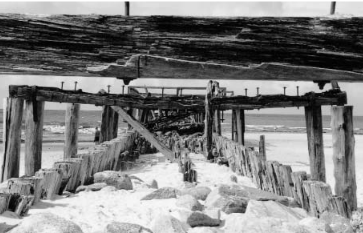
Abb. 10 Reste der Südmole des Hafens Šventoji.