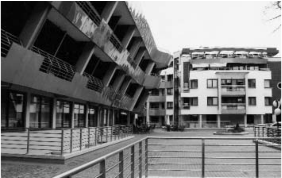
Abb. 9 Neues Kurhotel in Jastarnia.

Elektrizität und Trinkwasser gab. Lediglich in der Hafenstadt Memel/Klaipeda und in der Landkreisstadt Heydekrug/Šilutė kannte man solchen »Luxus«. Die Hauptverkehrsader des Gebietes war – neben der einen Eisenbahnlinie – der Schifffahrtsweg von Labiau bzw. von Tilsit nach Memel. Auf dieser durch Leuchtfeuer und Betonung gesicherten Route verkehrten fahrplanmäßig kleine Dampfer und seit den 1930er Jahren dann auch moderne »Salon«-Motorschiffe, während die Frachtguttransporte von den traditionell zweimastig getakelten »Reisekähnen« abgewickelt wurden, solange »offen Wasser« dies zuließ.