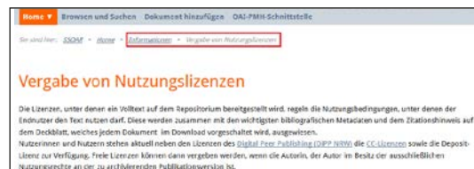
Infoseite SSOAR 29

Auf seinen Web-Seiten unter dem Menüpunkt »Informationen« bietet SSOAR wichtige Informationen zu Open Access, dem Grünen Weg und Zweitveröffentlichungsmöglichkeiten. Dazu gehört auch die »Vergabe von Nutzungslizenzen« (siehe die folgende Abbildung »Infoseite SSOAR«). Weitere wichtige Informationen zu Lizenzvergabe stehen zudem unter dem Menüpunkt »Veröffentlichen auf SSOAR« zur Verfügung.