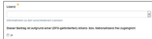
Lizenzangaben im Erschließungsprozess

Anschluss an die Auswahl der Lizenz kann markiert werden, ob der Beitrag im Rahmen der Open-Access-Klausel der Allianz- und Nationallizenzen zugänglich gemacht wurde.