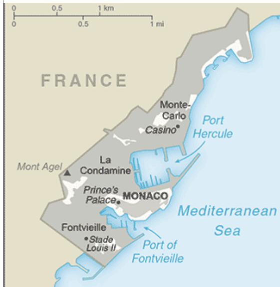
Abb. 2: Übersichtskarte von Monaco