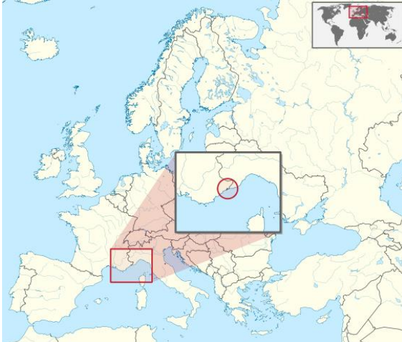
Abb. 1: Monaco zu Frankreich, Europa und der Welt

Monaco ist eine Nation an der Mittelmeerküste im Süden Europas. Es handelt sich offiziell und im Sinne der Drei-Elementen-Lehre 3 von Dr. Georg Jellinek um einen international anerkannten und souveränen Stadtstaat.