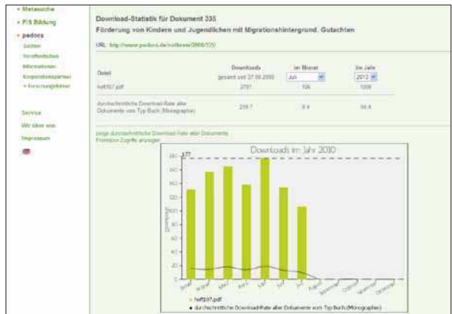
Statistikanzeige über Downloads eines Volltextes im Jahresverlauf und im Verhältnis zur durchschnittlichen Download-Häufigkeit desselben Dokumententyps

nisieren, pedocs wiederum gewinnt relevante Ressourcen zur freien Nutzung, die insbesondere auch für die historisch ausgerichtete Bildungsforschung von großem Interesse sind. Im Sinne der bibliothekarischen Versorgungsperspektive wird pedocs die Einbindung der Inhalte in den Bibliotheksverbund KOBV vornehmen und so die im Repositorium enthaltenen Titel im Kontext der überregionalen bibliothekarischen Such-Infrastruktur zur Verfügung stellen. Dieser Ansatz stößt auf ein dezidiertes Interesse der Wissenschaft, sodass pedocs anstrebt, dieses Modell der Innovationsförderung auszubauen.