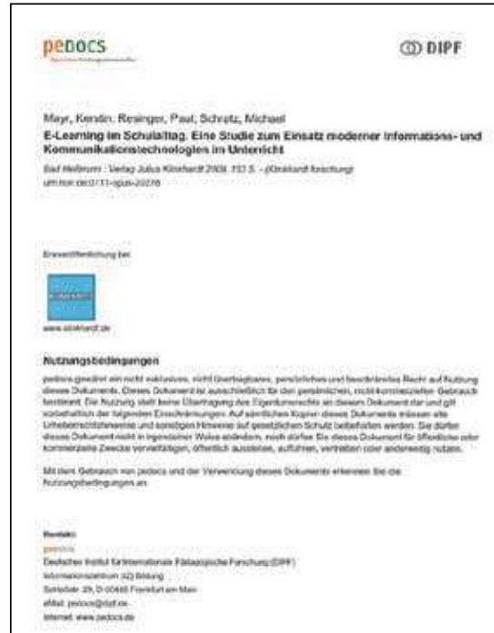
Abb. 1: pedocs Titelblatt

Monitoring: pedocs führt zur Beobachtung der Nutzungsentwicklung ein kontinuierliches Monitoring durch, welches detailliertes Sichten auf die Nutzung nach chronologischen Einheiten (Jahren, Monaten), Dokumentarten sowie thematischen Teilgebieten ermöglicht. In diesem Rahmen bedient