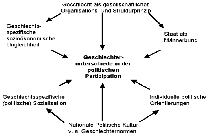
Abb. 1: Erklärungsansätze zu Geschlechterunterschieden in der politischen Partizipation