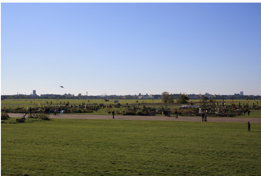
Abbildung 2

Der Blick von Nord-Osten auf den Gemeinschaftsgarten Allmende Kontor mit dem sich dahinter erstreckenden Tempelhofer Feld.