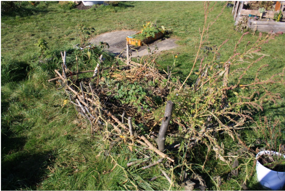
Abbildung 11

Auch dieses Beet weist eine andere Ästhetik auf als die Beete aus Spanplatten.