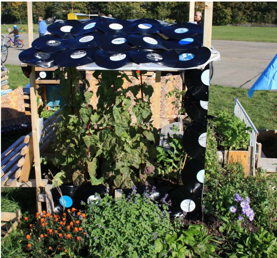
Abbildung 6

Ein Beet mit einem Dach aus Schallplatten.