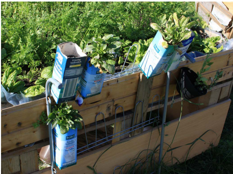
Abbildung 14

Ein weiteres Beispiel für upcycling . Gebrauchte Milchtüten werden als Blumentöpfe genutzt.