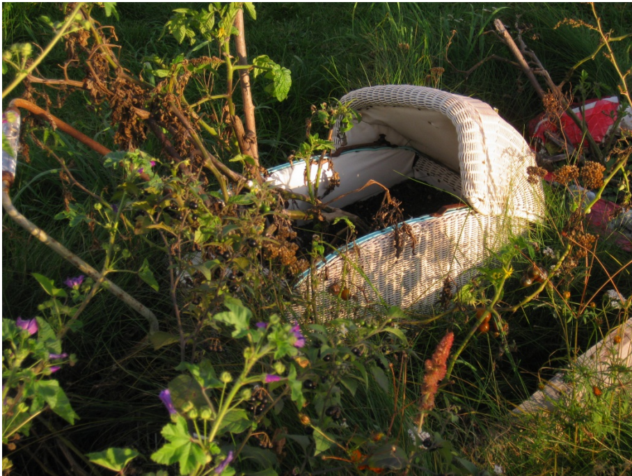
Abbildung 13

Upcycling mit einem alten Kinderpuppenwagen.