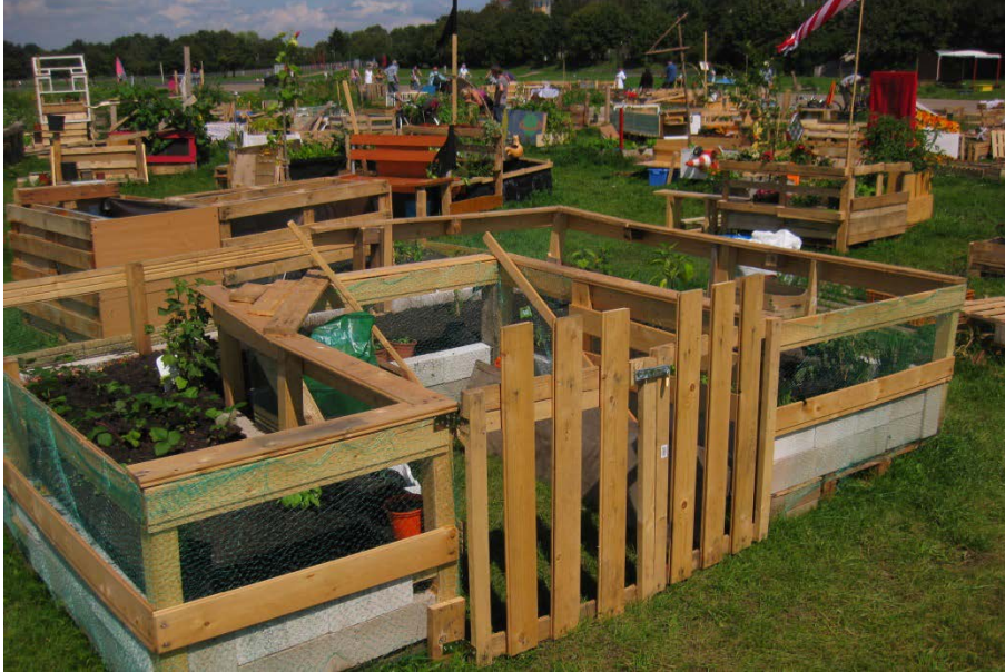
Abbildung 15

Dieses Beet stellt eine Ausnahme im Garten dar, da eine mit einem Schloss versehene Tür den Innenraum absperrt und den privaten Raum signalisiert. Die meisten anderen Beete haben keinerlei privaten Unterstellraum.