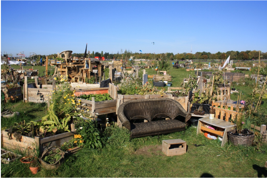
Abbildung 5

Ein Beet mit einem Dach aus Schallplatten.