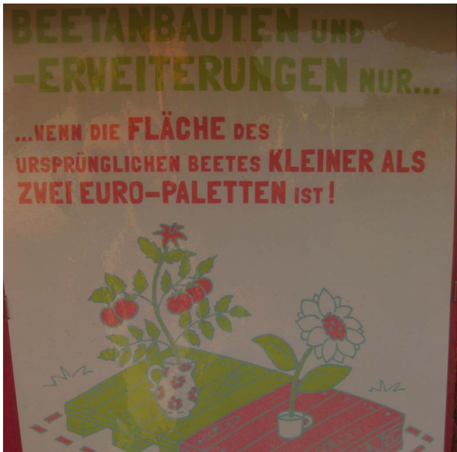
Abbildung 17

Ein Schild der Initiatoren, das Beeterweiterungen regeln soll.