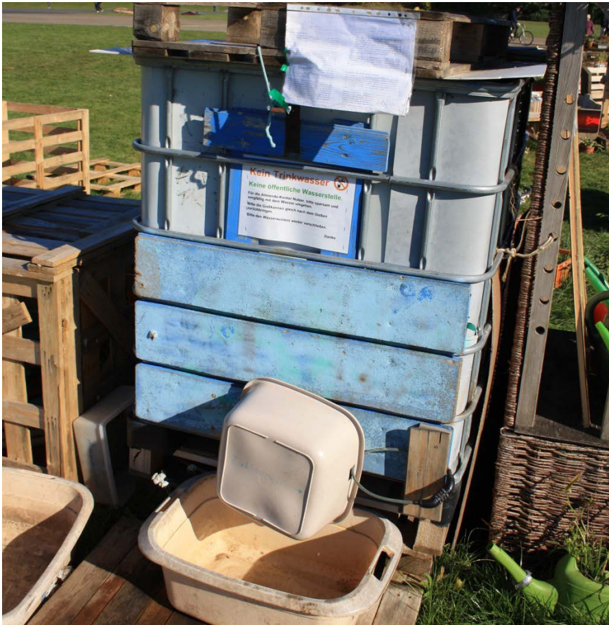
Abbildung 3

Der gemeinschaftlich genutzte Wassertank mit Schloss, dessen Geheimzahl alle Gärtner kennen.