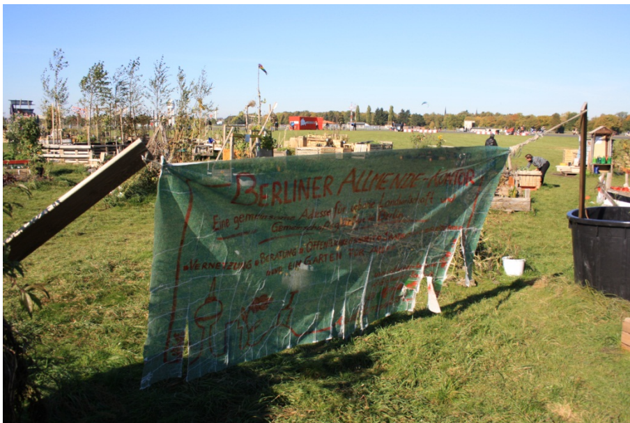
Abbildung 20

Ein Banner der Initiatoren mit dem Namen des Projekts.