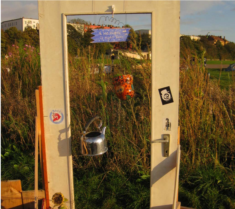
Abbildung 9

Eine auf der Straße gefundene Tür dient als gestalterisches Element. Auf dem Schild steht „Heaven is right here“.