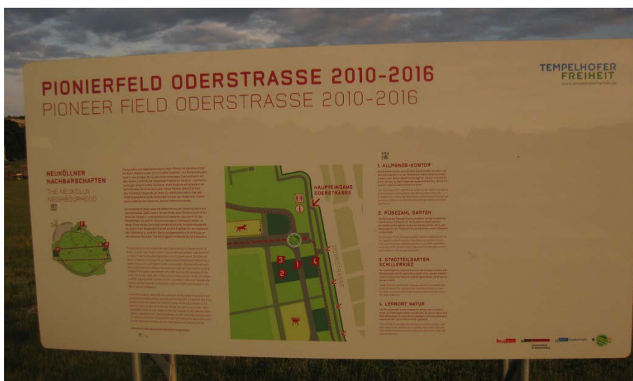
Abbildung 18

Ein von der Senatsverwaltung aufgestelltes Metallschild, das die vier Pionierprojekte an der Oderstraße vorstellt. Oben rechts ist das Logo der Tempelhofer Freiheit zu sehen.