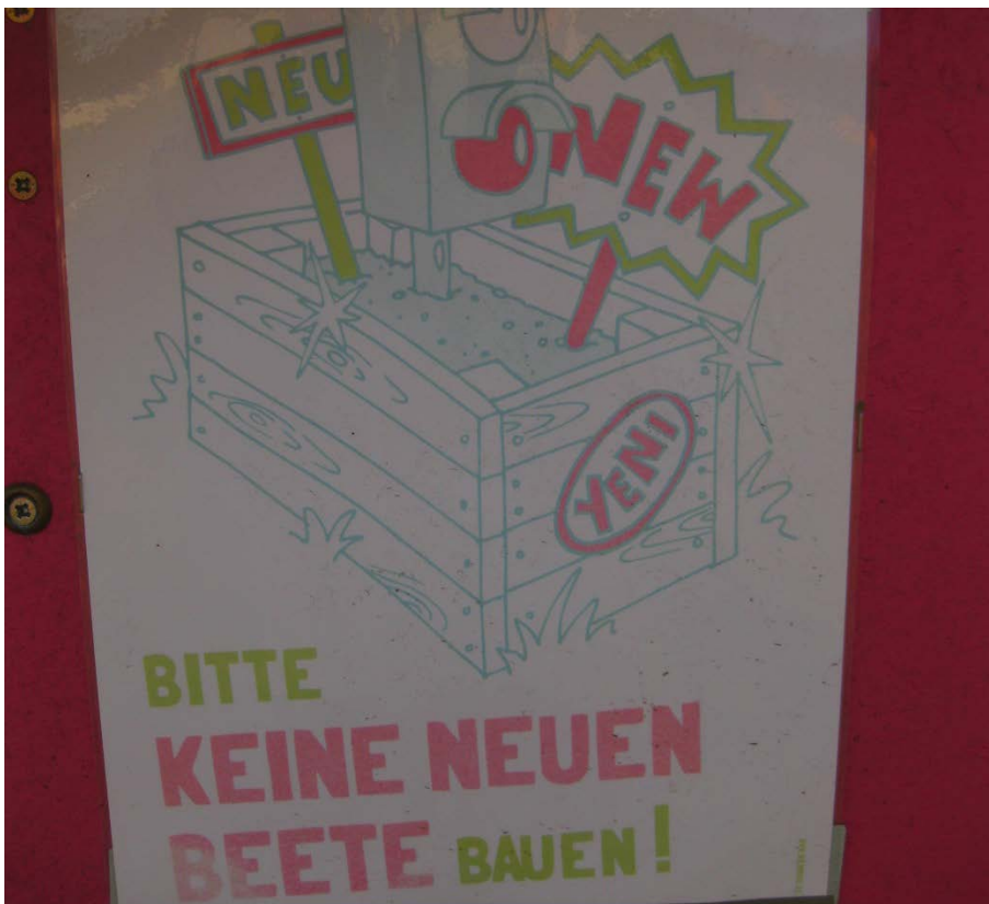
Abbildung 16

Ein Schild der Initiatoren, an einem zentralen Platz im Garten aufgehängt, das darauf hinweist: „Bitte keine neuen Beete bauen!“