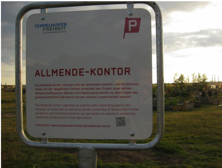
Abbildung 19

Das Schild, das direkt vor dem Allmende Kontor steht.