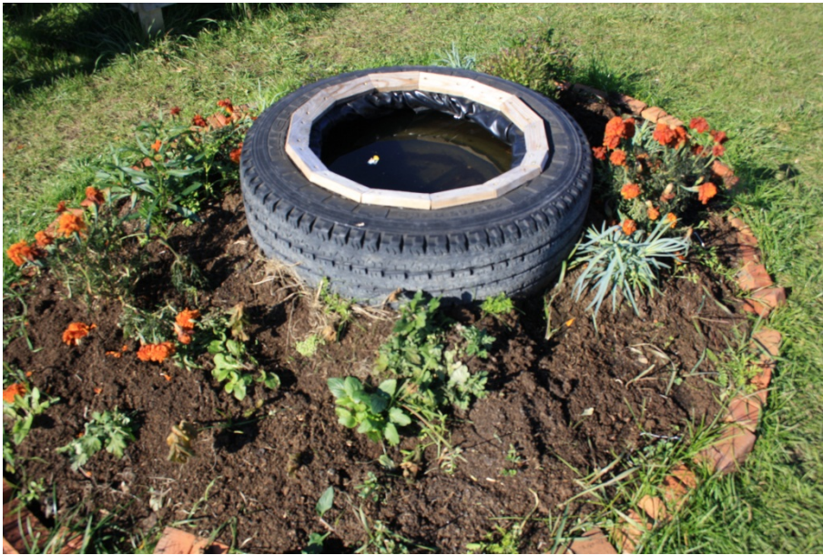
Abbildung 7 (eigenes Foto)

Ein alter Autoreifen, mit Folie ausgelegt, wird zum Fischteich umgenutzt.