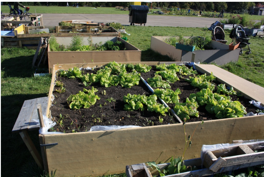
Abbildung 12

Eines der größeren Beete am Rand des Gartens. Es besteht aus Spanplatten und weist weniger gestalterische Besonderheiten auf. Die pragmatische Nutzung überwiegt.