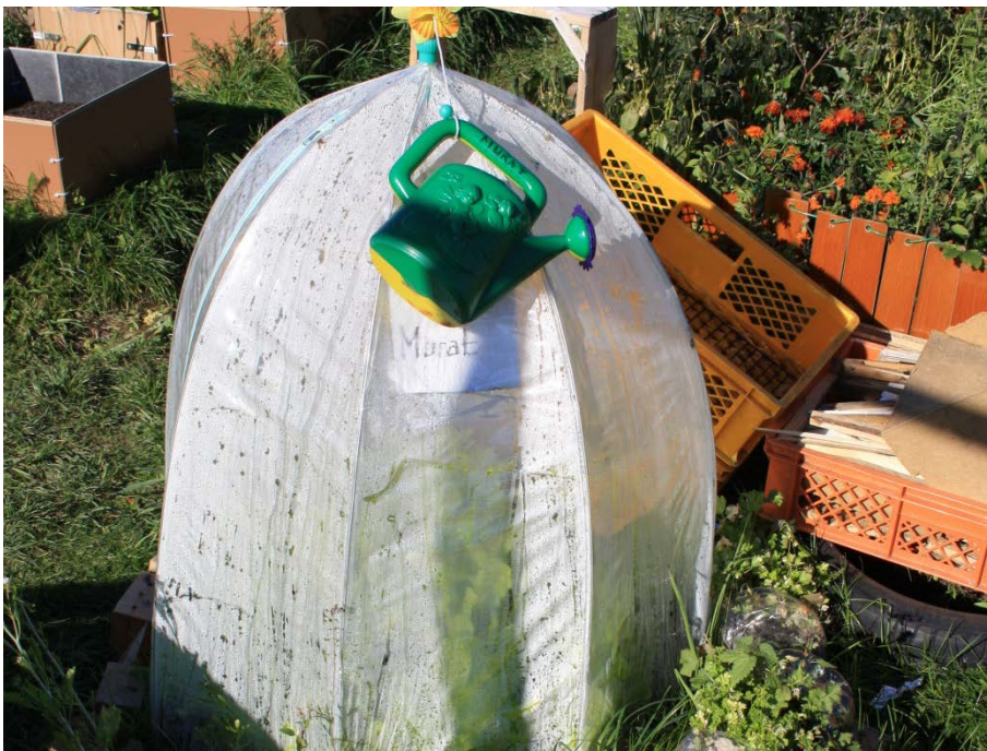
Abbildung 8

Ein Spielzeugzelt wird als Gewächshaus genutzt.