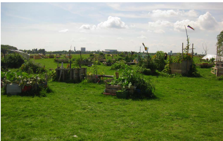
Abbildung 10

Die ersten Beete in der Mitte des Gartens sind klein und zumeist aus Naturholz gebaut.