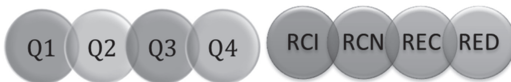
Figura 1 Escala de ocho pasos para calificar a las revistas mexicanas

Por otra parte, las revistas no indizadas por una de estas dos plataformas son clasificadas en cuatro grupos, con base en el puntaje obtenido en los criterios de evaluación del sistema CRMCYT, que califican los siguientes rubros: a) política y gestión editorial; b) calidad del contenido; c) nivel de citación; d) cumplimiento de frecuencia de publicación; d) accesibilidad 9 y, e) indexación internacional. Así, de acuerdo con el puntaje se ordenarán de mayor a menor y se conformarán otros cuatro estratos, a saber: competencia internacional, competencia nacional, en consolidación y en desarrollo (figura 1).