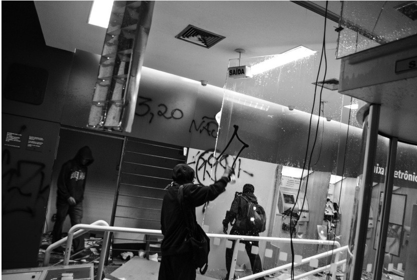
Abb. 7: Juni 2013 – Pixadores während einer Demonstration gegen die Erhöhung der Nahverkehrspreise

In diesem Zusammenhang entstand auch das „Pixo Manifesto Escrito“ („Pixo-geschriebenes Manifest“), ein Zeichen, das von verschiedenen Pixadores genutzt wird und ausdrücklich allen zur Nutzung offen steht, um explizit politische Aktionen durchzuführen. Dadurch werden diese Aktionen von der individuellen Identität der jeweiligen Pixadores losgelöst, was die Gefahr von politischer Verfolgung verringert, aber auch die allgemeine gesellschaftliche Relevanz der jeweils unterstützten Kämpfe unterstreicht. Pixador Brito erzählt: