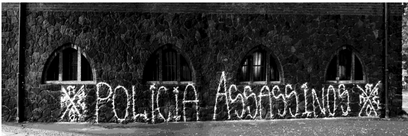
Abb. 9: „Policia Assassinos“ und das Zeichen „Pixo Manifesto Escrito“ auf der Außenwand des Märkischen Museum, gegenüber der brasilianischen Botschaft in Berlin

In den letzten Monaten wurden in verschiedenen europäischen Städten Wände in der Nähe brasilianischer Auslandsvertretungen mit dem Zeichen des „Pixo Manifesto Escrito“ und Forderungen nach einem Ende der Polizeigewalt in Brasilien beschrieben. In Amsterdam wurde am 31. Juli zum Jahrestag des Mordes an den beiden Pixadores das brasilianische Konsulat besprüht: „STOP POLICE VIOLENCE – R.I.P. Jets Ald & Anormal Nani 31/7/2014“ (Anonym 2015).