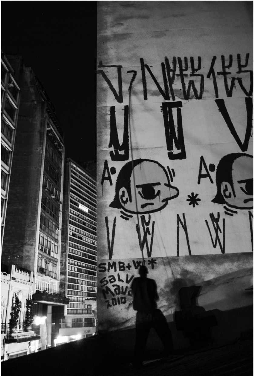
Abb. 4: Hoch oben ...