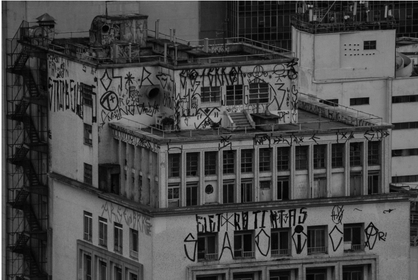
Abb. 1: Auf den Dächern São Paulos