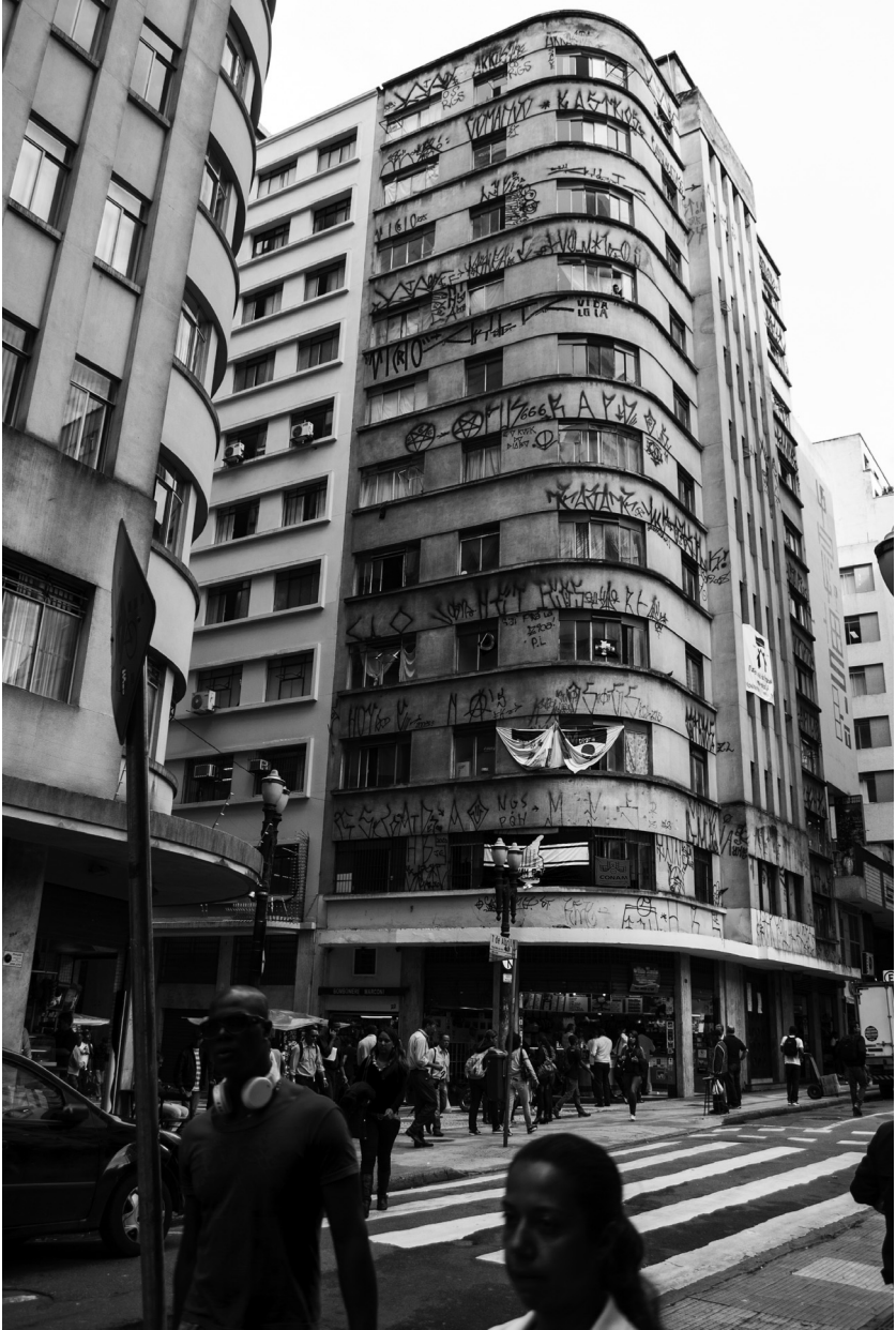
Abb. 3: Alltag im Zentrum São Paulos