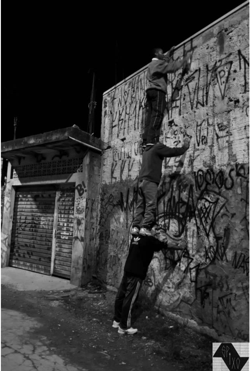
Abb. 6: „A escada humana“ – „die menschliche Leiter“