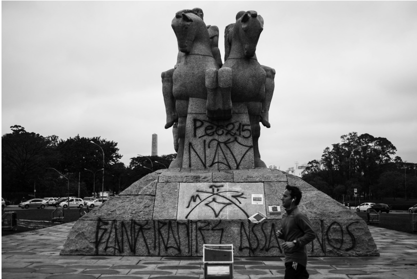
Abb. 8: „Bandeirantes Mörder“ – das Monumento às Bandeiras, im Zentrum das Zeichen „Pixo Manifesto Escrito“

dem Haupteingang des Ibirapuera-Parks, wohl einem der repräsentativsten Orte São Paulos, wurde im Oktober 2013 mit den Parolen „Nein zur Pec 215 [einer Gesetzesänderung die vorsah, die Rechte indigener Gruppen auf Land erheblich einzuschränken]“, „Bandeirantes Mörder“ und dem Zeichen des „Pixo Manifesto Escrito“ besprüht. Im Interview gibt einer der an der Aktion beteiligten Pixadores an: „All diese Monumente sind Symbole der Unterdrückung. [...] Wir wurden von einer westlichen Zivilisation zivilisiert, die hier ankam und unsere Kultur zerstörte.“ (Paiva 2013).