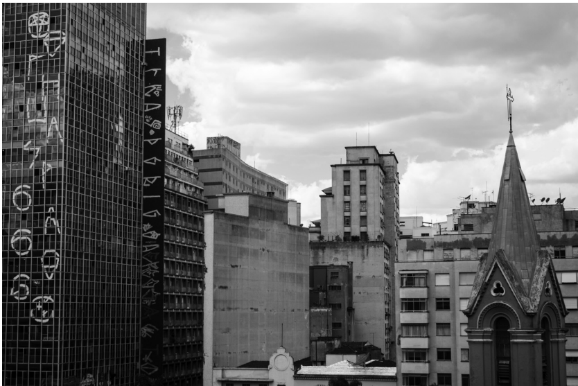
Abb. 2: Das Zentrum São Paulos: Apartmentblocks, Verwaltungsgebäude, Kolonialgeschichte und Pixação

Wir stützen unsere Argumentation auf Forschungen, die wir unabhängig voneinander aus den disziplinären Hintergründen der kritischen Kriminologie bzw. kritischen Stadtforschung seit 2013 in São Paulo durchführten: auf ethnographische Feldforschung mit Pixadores (2013 bis 2014), auf Interviews mit Vertreter_innen städtischer Institutionen (Februar bis März 2015) sowie auf Erfahrungen aus mit Jugendlichen in den Peripherien der Metropole durchgeführten Bemalungsprojekten.