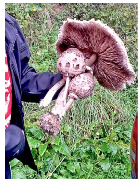
Abb. 2: Visuelles Datenmaterial

man zur Deutung des Bildsinnes alle vorherigen Elemente der Bildinterpretation aufeinander (Stufe III), so zeigt sich eine mit funktionaler Freizeitbekleidung bekleidete Person mittleren Alters, die einen (essbaren) Pilz für ein Foto präsentiert – zum einen, um den Forschenden einen Einblick in die Lebenswelt zu gewährleisten und zum anderen, um für sich ein Erinnerungsfoto zu generieren. Durch die Fokussierung auf den Pilz und das Weglassen des Sammelnden auf der Fotografie wird der Fokus eindeutig auf den abgebildeten Pilz gerichtet, wodurch ein gewisser Stolz über diesen Fund angezeigt wird. Die Szene scheint sich in einer Wald- und Wiesenlandschaft abzuspielen. Die Person ist mindestens von dem Fotografen begleitet, sodass ein Ausflug mit Freunden oder Familie denkbar wäre. Der dominant hervorstechende Pilz besteht aus drei Fruchtkörpern, einem bereits aufgefalteten Hut und zwei kleineren Exemplaren, die noch zusammengefaltet sind. Weiterhin zeigt das Foto einen aktiven Umgang mit sich selbst und seiner Umwelt von Seiten der dargestellten Person, da der Pilz zum einen aktiv präsentiert wird und diesem eine aktive Suche sowie ein gewisses Maß an Mobilität und Planung vorge-schaltet wurden. Der hier dargestellte Bildausschnitt (vgl. Abb. 2) und die gewählte Raumperspektive zeigen – so eine