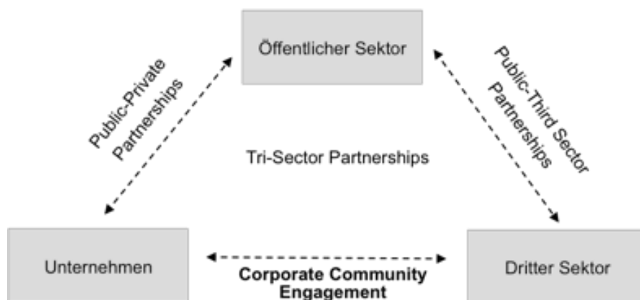
Abb. 1: Varianten intersektoraler Kooperationen in Anlehnung an (Maak & Ulrich 2007)

In Abhängigkeit der beteiligten Akteure gibt es verschiedene Varianten intersektoraler Kooperationen (siehe Abbildung 1). Es ist grundsätzlich nicht notwendig, dass Akteure aller drei Sektoren an einer Partnerschaft teilhaben. Zwei reichen aus, solange sie komplementäre Fähigkeiten für die Bearbeitung gesellschaftlicher Herausforderungen in die Partnerschaft einbringen (Maak & Ulrich 2007).