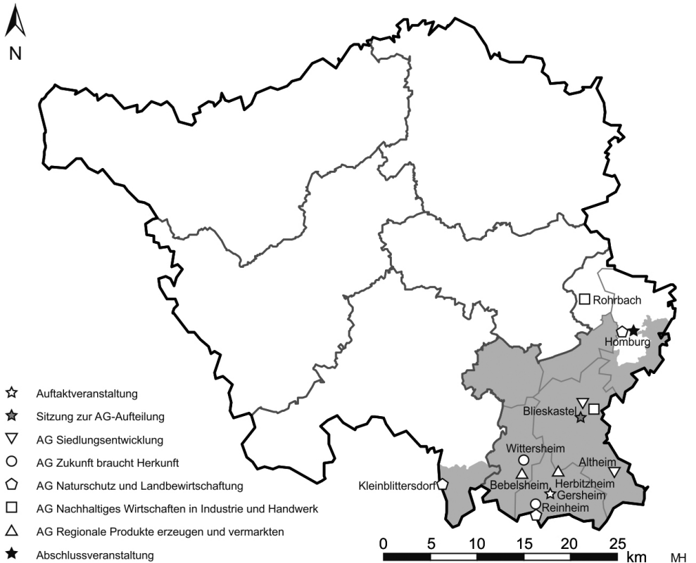
Abb. 1: Verteilung der Orte der AG-Sitzungen innerhalb der Biosphäre Bliesgau

Durch teilweise zeitliche Überschneidungen war es für interessierte Personen nicht immer möglich, an allen AGs teilzunehmen. Am 4. November 2014 wurden dann die Ergebnisse der Arbeitsgruppen vorgestellt. Außerdem gab es noch weitere Partizipationsmöglichkeiten über das Internet (Facebook), Briefe sowie als Stellungnahme bei der Auslage der Entwürfe. Die Stellungnahmen der Bürger konnten bis zum 31.12.2015 eingereicht werden, die Stellungnahmen von Behörden, Ämtern und Gemeinden bis zum 31.01.2016 (mündliche Aussage des Biosphärenzweckverbandes). Zwischen den Workshop-Sitzungen fanden stets Sitzungen der Steuerungsgruppe statt. Wie Abb. 1 zeigt, waren die Veranstaltungen nicht gleichmäßig über das Biosphärenreservat verteilt, was auch dem Vorhandensein oder Nicht-Vorhandensein entsprechender Örtlichkeiten geschuldet war, gleichzeitig aber auch einigen (potenziell) Interessierten die Teilnahme erschwerte.