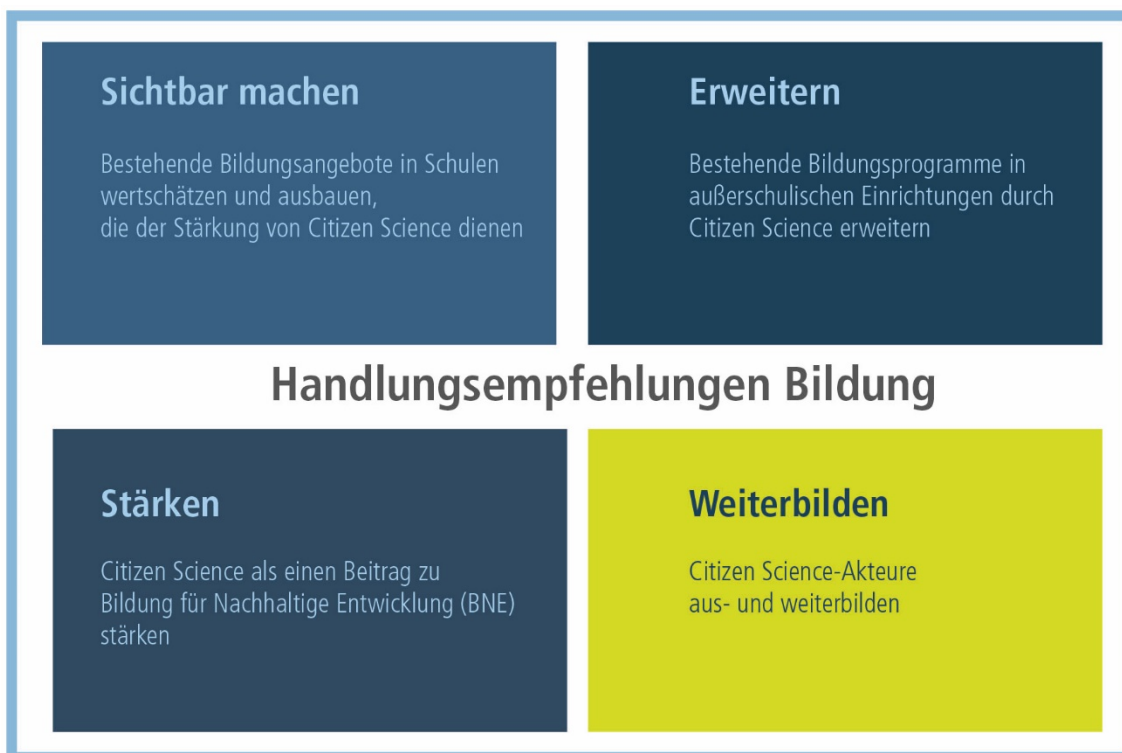
Abbildung 2 Zusammenfassung der Handlungsempfehlungen Bildung und Citizen Science.

Ziel ist es, Projekte und Aktivitäten zu fördern, die Bildungsarbeit an der Schnittstelle von Citizen Science und Umweltbildung, Bildung für Nachhaltige Entwicklung und Kommunikation verfolgen. Es sollen Aktivitäten sichtbar gemacht, erweitert, gestärkt und ausgebaut, werden, die relevant und notwendig für die praktische Umsetzung von Citizen Science und Bildung sind. Die Akteure sind aus- und weiterzubilden sowie Kriterien zur Sicherung von Standards in Citizen Science in der Bildung zu entwickeln, zu testen und anzuwenden (Abbildung 2).