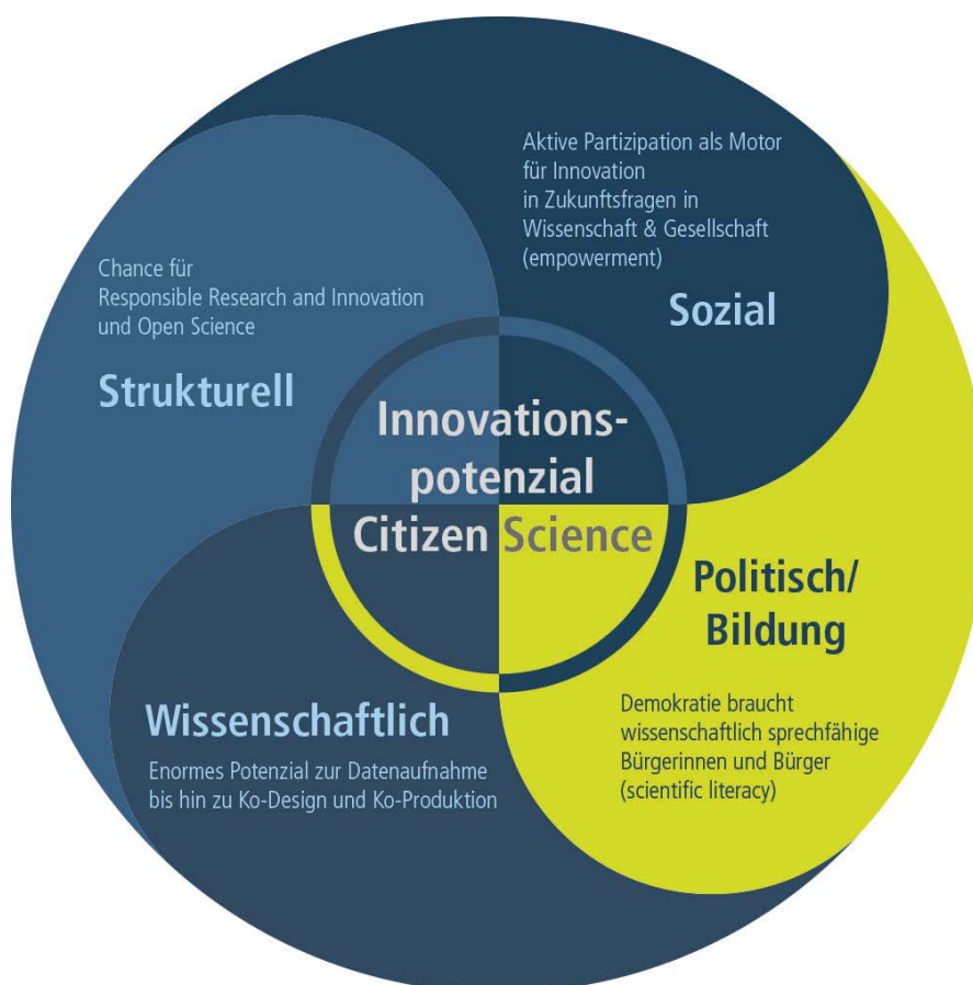
Abbildung 1 Innovationspotenziale von Citizen Science.

Citizen Science bedeutet Engagement von Bürgerinnen und Bürgern in der konkreten Bearbeitung wissenschaftlicher Themen. Diese sind vielfach von hoher gesellschaftlicher Relevanz. Als Form der aktiven Teilhabe der Öffentlichkeit bei Problemlösungsprozessen erlangt Citizen Science in Deutschland verstärkt sowohl wissenschaftliche, als auch gesellschaftliche und politische Bedeutung. Dies bietet Chancen, das strukturelle, soziale, wissenschaftliche und politische Innovationspotenzial von Citizen Science stärker in die Forschung zu integrieren (Abbildung 1).