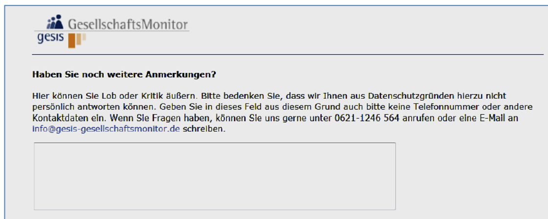
Abbildung 2: Kommentarfeld am Ende des Online-Fragebogens

So kann das vorliegende Kategorienschema in der jetzigen Form sowohl zur Codierung der offenen Angaben aus dem Online- und Offlinefragebogen eingesetzt werden, als auch zur Klassifizierung der beim Panelmanagement eingehenden Anfragen und Anmerkungen, die in das Panelprotokoll eingetragen sind.