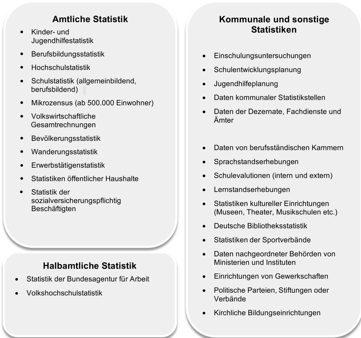
Tabelle 1: Übersicht über für ein kommunales Bildungsmonitoring nutzbare Datenquellen (nach Siepke 2015, eigene Ergänzungen)

regionaler Gliederung beziehen. Dabei kann auf schon vorhandene Statistiken zurückgegriffen werden oder es können Primärerhebungen zur Schließung von Datenlücken durchgeführt werden. Tabelle 1 zeigt einen Überblick über für ein kommunales Bildungsmonitoring relevante Datenquellen.