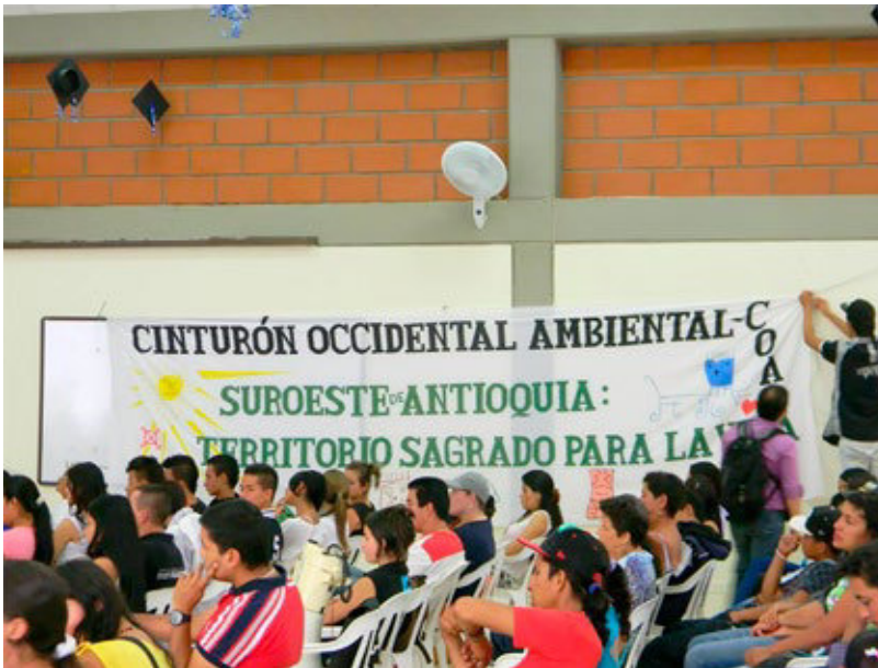
COA presente en el Cabildo Abierto en Ciudad Bolívar