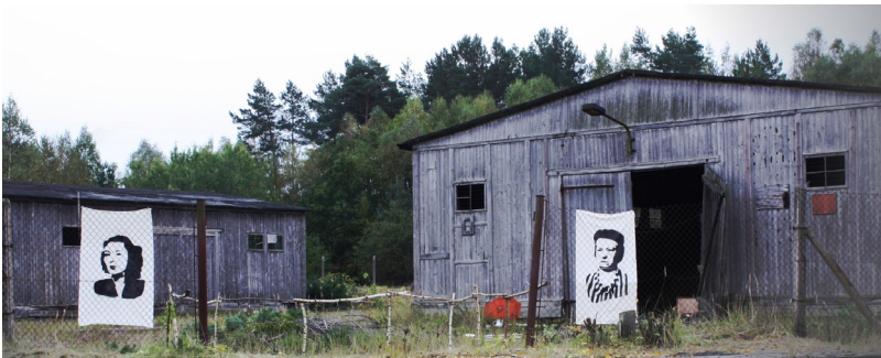
Ergebnisse des Streetart-Workshops, Beutebaracken in Ravensbrück im Oktober 2012

Archiv der Gedenkstätte und rekonstruierten drei Biografien, die zweier KZ-Insassinnen, darunter eine britisch-jüdische Spionin und eine Zeugin Jehovas, und einer Aufseherin. Die Konterfeis der drei Frauen setzten sie in Streetart-Technik mit dafür angefertigten Folien (Stencils) und Graffiti-Dosen auf Leinwände um. Die Leinwände brachten sie in einem visuellen Dreieck bei den Baracken an, die Häftlingsfrauen hinter dem Zaun, die Aufseherin davor, auf der anderen Seite, in der Freiheit. Damit Pasant_innen überhaupt zu den abgelegenen Baracken finden, bastelten die Jugendlichen im Stil der neuen ebenfalls jugendkulturellen Urban-Art-Technik ›Guerilla Knitting‹ mit Pappen und Wollfäden Hinweisschilder, auf denen »For Sale« oder »Pelz Outlet« zu lesen war. Damit spielten die Jugendlichen auf die oft rücksichtslosen und ausbeuterischen Produktionsbedingungen von Waren, die Begehrlichkeit nach Luxus und die weit verbreitete Fixiertheit auf Schnäppchenkäufe in der heutigen Zeit an und stellten auf eine makabre Weise eine direkte Assoziation zwischen der Gegenwart und der über alle Grenzen und Vorstellungskräfte gehenden Bereicherung der Nationalsozialist_innen in der Vergangenheit her.