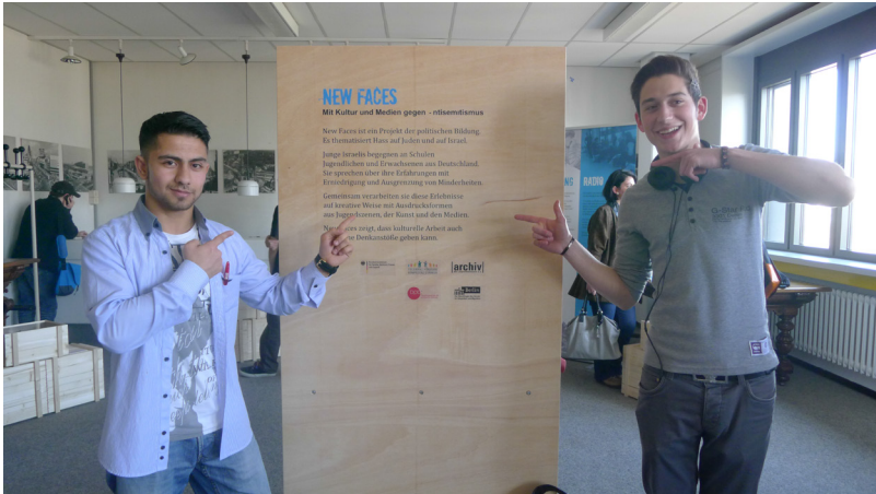
Ausstellungseröffnung New Faces , Februar 2012 in Berlin

falls im Rahmen unseres Projekts New Faces , eine Woche lang mit Brandenburger Jugendlichen aus den helfenden Verbänden – so dem Technischen Hilfswerk (THW) und der Freiwilligen Feuerwehr (FF) – in der Gedenkstätte Ravensbrück zwei Workshops realisiert.