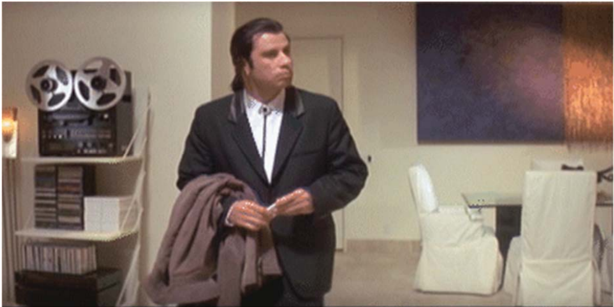
Abbildung 1: Das originale Confused Travolta Meme