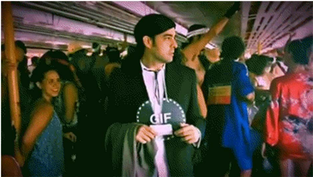
Abbildung 3: Das Confused Travolta Meme als remediatisierte Live-Performance