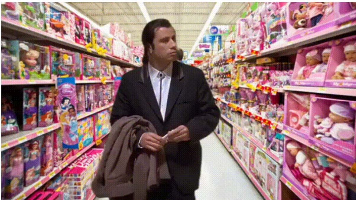
Abbildung 2: „MRW I ask my daughter what she wants for Christmas and she says, "A doll."“