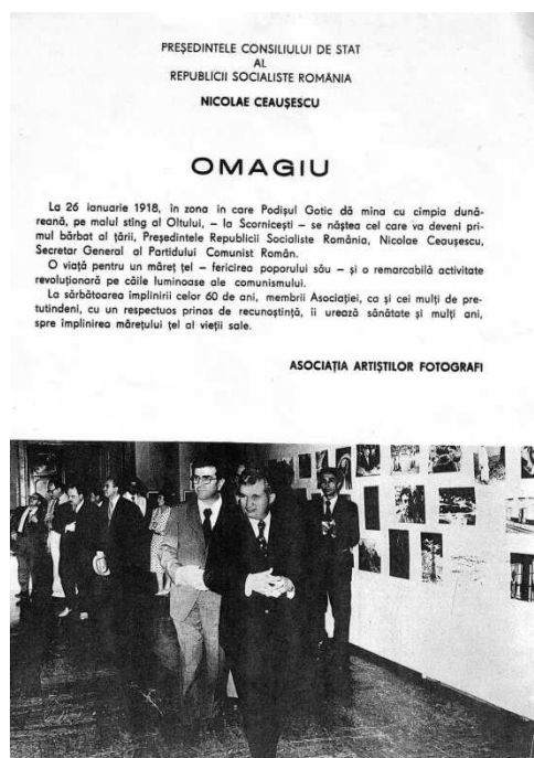
Figura 2. Omagiu .