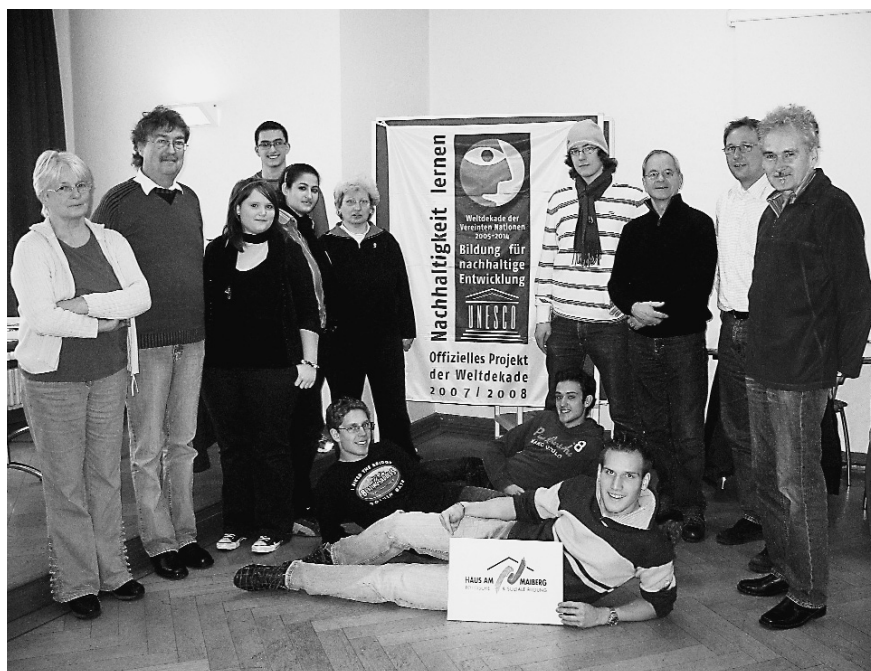
Umwelten – Klimawandel zwischen den Generationen

nehmenden als Gruppe kennengelernt und gefunden hatten, wurde in fünf Workshops – die nachmittags außerhalb der Schulzeit stattfanden – gemeinsam an verschiedenen Themen gearbeitet.