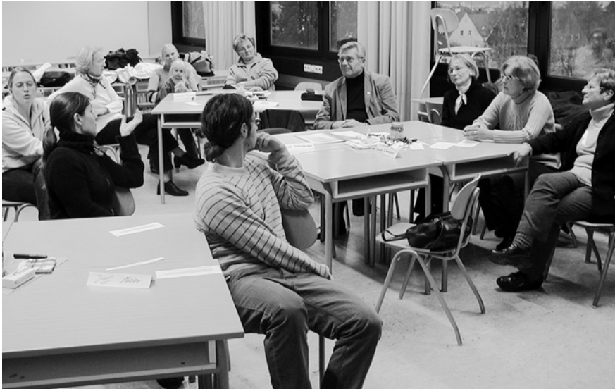
Intergenerationelles Lernen an der Hochschule

Der Erwachsenen- und Seniorenbildung wird aus Jugendperspektive oftmals empfohlen, in Bezug auf intergenerationelles Lernen die eigenen Räume und Lernorte zu verlassen und neue aufzusuchen, die von allen Generationen akzeptiert werden, weil nur dann offene und partizipative intergenerationelle Bildungsprozesse möglich wären. Der Standort und der Lernraum intergenerationeller Bildungsarbeit scheinen von daher von entscheidender Bedeutung zu sein. So ist es nicht verwunderlich, dass es für die sechs 57- bis 66-jährigen nicht studierenden Gäste im Seminar der Hochschule Regensburg gewisse Barrieren, Hemmschwellen und Bedenken gab, sich auf einen generationsübergreifenden Bildungsprozess mit wesentlich jüngeren Studierenden an einem für sie fernen und fremden Ort ein-