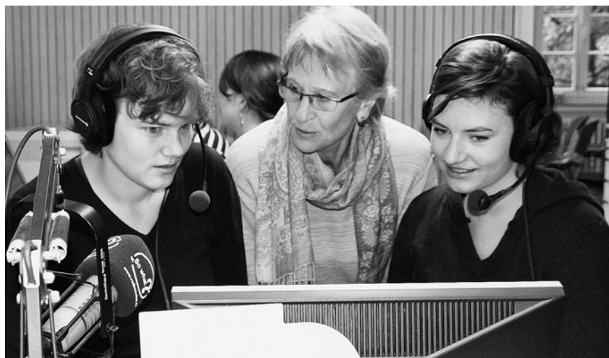
Gutes Klima in Bonn