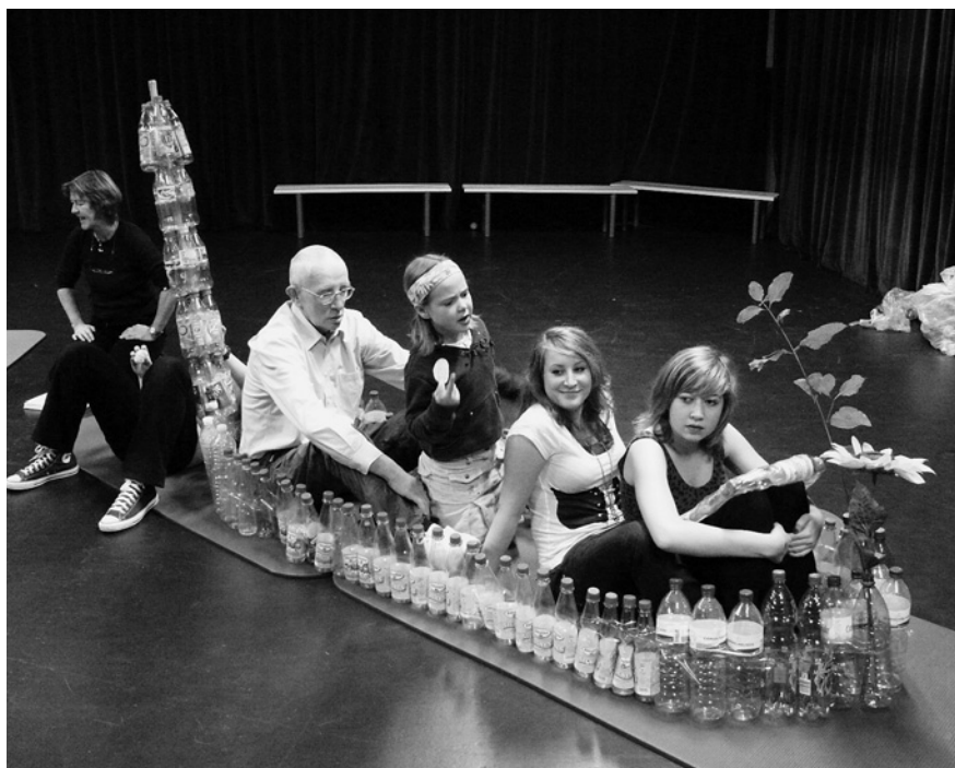
Nach uns die Sintflut

Das Theaterprojekt „Nach uns die Sintflut, oder was?“ verdeutlicht in eindrücklicher Weise, wie eng das Voneinander-, Miteinander- und Übereinander-Lernen in theaterpädagogischen und spielerischen Prozessen verbunden sein können. Bei der Entwicklung des Theaterstückes brachten die verschiedenen Altersgruppen ihre unterschiedlichen Lebensperspektiven und Erfahrungen in die Erarbeitung der Inszenierungen ein und es wurden Lösungsansätze für vermeintliche Generationenkonflikte mit kreativen Methoden und in spielerischer Form entwickelt. Im gemeinsamen Lernprozess lernten die Generationen nicht nur viel über das Leben und die Lebensgeschichten der anderen Generationen, sondern profitierten auch von den generationenspezifischen Wissensbeständen und Theatererfahrungen. Darüber hinaus erlebten die Teilnehmenden einen gemeinsamen Produktionsprozess, indem sie miteinander ein Theaterstück schrittweise entwickelten. Besonders bewährt haben sich beim gemeinsamen Lernen die Improvisations- und Gestaltungsaufgaben in einzelnen Gruppen, die Umsetzung von Text in Bewegung, der Einsatz von Musik und Dialogübungen. Die Teilnehmenden brachten immer wieder neues Material mit zu den Proben, z.B. Gedichte, Texte und Recher-