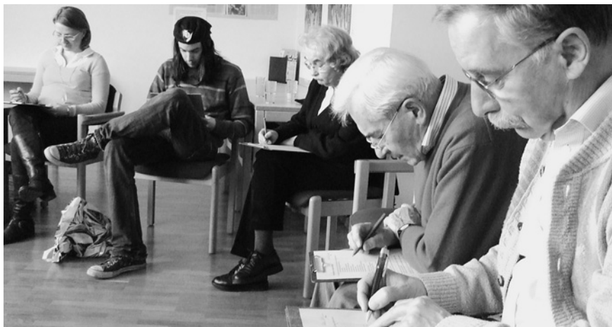
München alternativ erleben