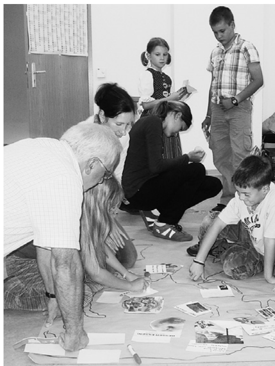
Energiedetektive von Wiesenbach

Energie, Ressourcengewinnung und Ressourcenverbrauch innerhalb der eigenen Gemeinde erfahrbar zu machen. Dabei sollte die unterschiedliche Erfahrung der Generationen im Umgang mit Ressourcen eine besondere Rolle spielen. Die etwa 40 Teilnehmenden erkundeten während der viertägigen Veranstaltung ihren Sozialraum. Sie besuchten das ortsansässige Wasserkraftwerk, eine Biogasanlage und spazierten durch ein Vogelschutzgebiet. Hier spielte der Kontakt zu den lokalen Gruppen und Experten eine besondere Rolle. Durch die Projektleitung wurden im Vorfeld viele Personen, wie zum Beispiel der Energiewirt, kontaktiert und in das