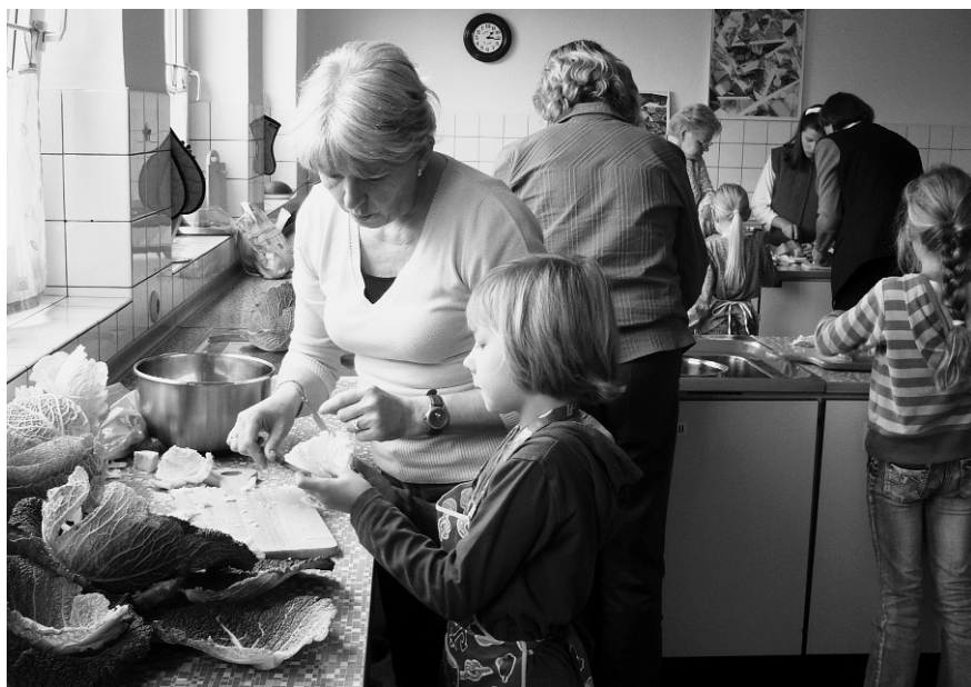
Großeltern und Enkelkinder lernen gemeinsam (Foto: Familienbildungsstätte Ahlen)

Ziel, gemeinsam regionale Gerichte zuzubereiten. In der einwöchigen pädagogisch begleiteten Veranstaltung setzten sich die verwandten Generationen gemeinsam mit regionalen und fair gehandelten Produkten auseinander, besuchten einen Biomarkt und bereiteten gemeinsam verschiedene Gerichte zu, die zusammen verzehrt wurden. Schon während der Durchführung verlangten die Teilnehmenden nach möglichen Nachfolgeterminen. Das Angebot traf in der Familienbildungsstätte auf eine große Nachfrage. Offensichtlich besteht ein Bedarf nach solchen auf Großeltern und Enkelkinder zugeschnittenen intergenerationalen Lernmöglichkeiten. Der Blick auf nachhaltige Essensproduktion war auch für viele teilnehmende Großmütter eine Bereicherung, die durch das Seminar auch etwas Neues lernten. Gerade die Tatsache, dass sie in diesem Seminar lernten und lehrten, wurde als sehr bereichernd erlebt.