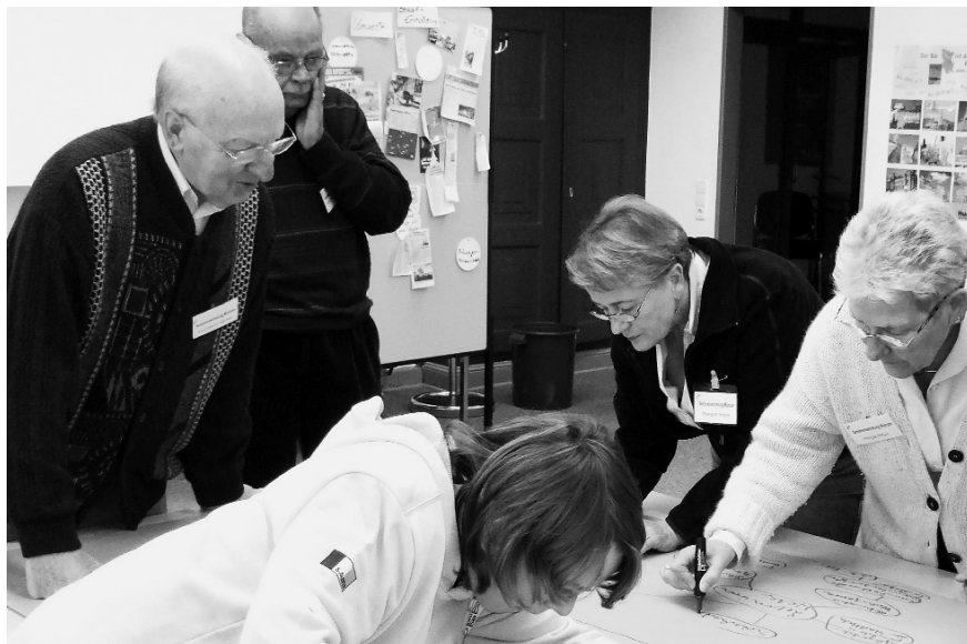
Für ein faires Münster

Eine gute Möglichkeit ist es auch, an bestehende altershomogene Gruppen anzuknüpfen, um diese zielgerichtet und pädagogisch begleitet zusammenzuführen.