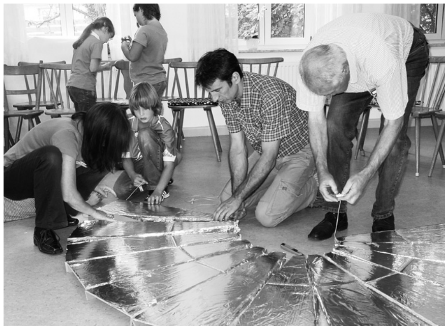
Intergenerationelle Energiedetektive

Das Projekt „Die Energiedetektive in Wiesenbach“ konnte die in unserem Modellvorhaben größte Altersspanne der Teilnehmenden zusammenführen: Der Jüngste war 4 und der Älteste 90 Jahre alt. Das durch einen katholischen Verband initiierte Vorhaben bestand aus einer viertägigen intergenerationellen Großveranstaltung,