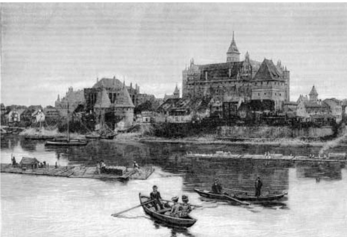
Abb. 5 Blick auf Marienburg aus Südwesten, im Vordergrund Kähne und Flöße. Anonymer Stich nach einem zeitgenössischen Foto aus »Die Gartenlaube«, 1899.

erwähnt, als der Orden an Piotr, Johann und ihre Erben eine Insel auf der Nessau (Nieszawa) übergab, sich aber das Recht vorbehielt, Bäume auf der Insel zu fällen und die Insel als Übernachtungsmöglichkeit für die Weichselschiffer zu nutzen. 141