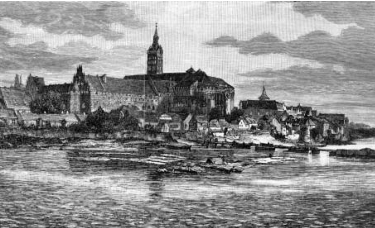
Abb. 4 Marienburg. Stich von Gustav Schönleber, spätes 19. Jahrhundert (?). (Archiv DSM)

Schiff befördern. Im Mai 1412 transportierten nicht weniger als 19 Knechte Eichenplanken per Schiff us der smergrube . 113