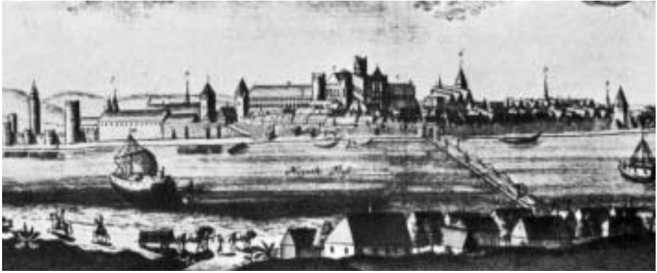
Abb. 3 Panorama von Schloss Marienburg. Kupferstich von Wolff aus Augsburg, 1709.

Nogat, d.h. ungefähr im Jahr 1340, entstand. 51 Er befand sich in der Nähe des Brückentores. In seiner Nähe muss es also den frühesten Deutschordenshafen gegeben haben. Nicht ohne Bedeutung ist der Umstand, dass die älteste Kapelle nach dem Schutzpatron der Seeleute, dem Heiligen Nikolaus, benannt wurde. Diese Tradition kennen wir auch aus anderen durch den Deutschen Orden gegründeten Städten, z.B. aus dem nahe gelegenen Elbing. Im Jahr 1378 wurde in Marienburg ein »neuer« Speicher errichtet, der auch als großer oder langer Speicher bezeichnet wurde und hinter der Laurentiuskirche am Ufer des Flusses Nogat gelegen war. 52 Schmid ist der Meinung, dass die beiden Speicher am Anfang parallel funktionierten. Wir wissen jedoch nicht wie lange. Man kann also schlussfolgern, dass es in der zweiten Hälfte des 14. Jahrhunderts am Schloss Marienburg zwei Häfen in der unmittelbaren Nähe der erwähnten Speicher gab.