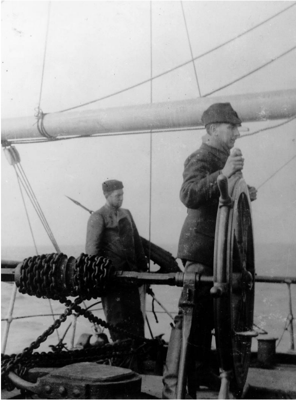
Abb. 1 Alfred Wegener am Ruder der DANMARK, 1908.