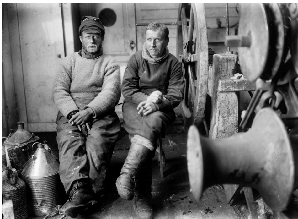
Abb. 3 Gustav Thostrup (links) und Alfred Wegener nach Beendigung der Schlittenreise, auf der sie 1907 knapp 81° N erreichten.

Es war auch durchaus im Sinne des eingeschlagenen Weges, dass Wegener sich 1906 um eine Teilnahme an der dänischen Ostgrönlandexpedition (1906-1908) unter Mylius Erichsen (1872-1907) bewarb. Er wurde eingestellt und vertrat das Fach Physik und speziell die Meteorologie, wobei er mit den oben angedeuteten Methoden die Vertikalschichtung der Atmosphäre registrierte. Diese Expedition, für die Wegener von der dänischen Krone hoch dekoriert wurde 26 , liefert den Schlüssel zum Verständnis für Wegeners weitere Entwicklung. Seine Messergebnisse nutzte er für eine Habilitationsschrift (Wegener 1909), deren Kern die Protokolle der 99 Drachen- und 26 Fesselballonaufstiege bilden (Wegener 1909, S. 23-49). Die Arbeit ist nicht zuletzt wissenschaftshistorisch interessant, weil sie viele Einzelheiten zu dem Leistungsumfang der Methoden und Informationen über die praktischen Probleme liefert.