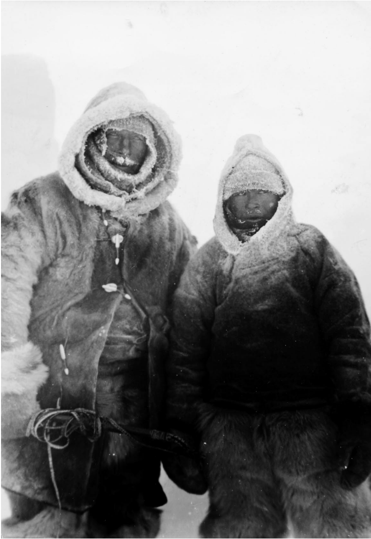
Abb. 9 Alfred Wegener und Rasmus Villumsen am 1. November 1930 vor der Abreise von der Station Eismitte zur 400 km entfernten Weststation, die sie nicht erreichten.

Aus wissenschaftstheoretischem Blickwinkel stellt Wegener einen Wissenschaftlertypus dar, der nicht häufig anzutreffen ist. Er ist ein komplementär Denkender, der zwanglos den deduktiven und den induktiven Wissenschaftsansatz miteinander verbinden kann. Wegener war als Wissenschaftler fruchtbar und originell, glaubte an einen wissenschaftlichen Fortschritt. Ohne das Detail zu scheuen, war er stets an der Synthese umfassender Probleme interessiert, aber – und das ist wichtig zu verstehen, um ihm gerecht zu werden – nicht nur im Sinne des darstellenden Wissenschaftlers, sondern selbst messend und probierend. Dabei zu sein und zu agieren, eigene Anschauungen zu gewinnen, das war ihm wichtig.