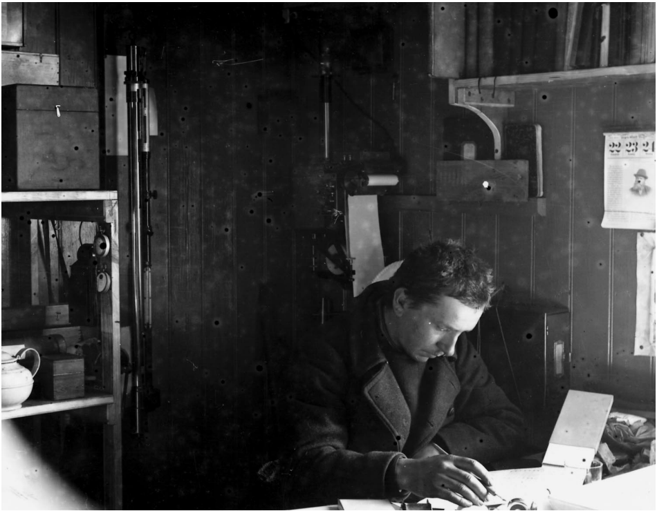
Abb. 4 Alfred Wegener in der Überwinterungshütte »Borg« am Rande des Inlandeises an der Ostküste Grönlands, 1912/13.

Eine großflächige Gleichförmigkeit des Meeresbodens war um 1912 durchaus noch eine gängige Vorstellung, aber schon mit dem Beginn der systematischen Lotungen, im Zusammenhang mit der Verlegung von Seekabeln ab Mitte des 19. Jahrhunderts, war man auf Besonderheiten gestoßen, die durch die zunehmenden marinen Forschungsaktivitäten gestützt wurden. Alexander Supan (1847-1920) hat auf verschiedenen Karten um die Jahrhundertwende die Atlantische Schwelle eingeführt (Supan 1899, Supan 1903). Auf der von Wegener zitierten Karte von Max Groll (Groll 1912) ist durch die Verwendung neuester Daten der Eindruck einer Schwelle zwar etwas verwischt 31 , aber doch eindeutig. Wegener hat dem Rechnung getragen. In Wegener 1912, S. 306 heißt es: ... Diese scheinen es auch nahezulegen, die mittelatlantische Bodenschwelle als diejenige Zone zu betrachten, in welcher bei der noch immer fortschreitenden Erweiterung des Atlantischen Ozeans der Boden desselben fortwährend aufreißt und frischem, relativ flüssigem und hoch temperiertem Sima aus der Tiefe Platz macht. Dieses ist schlicht die Beschreibung des Seafloor Spreading.