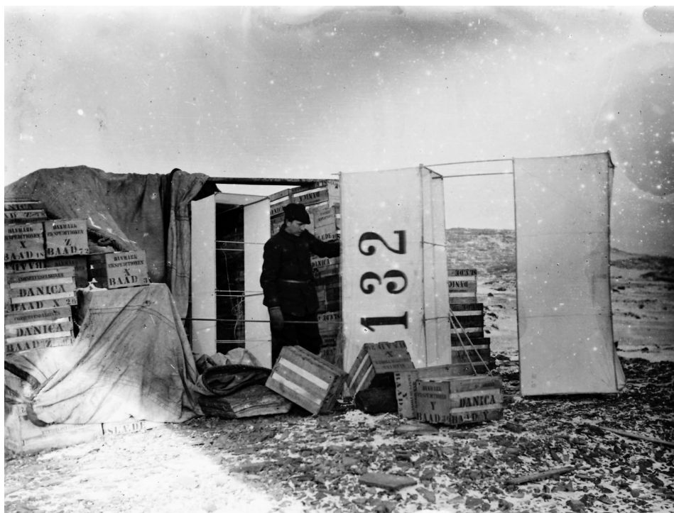
Abb. 2 Alfred Wegener beim Zusammenbau eines meteorologischen Drachens während der Danmark-Expedition 1906-1908.