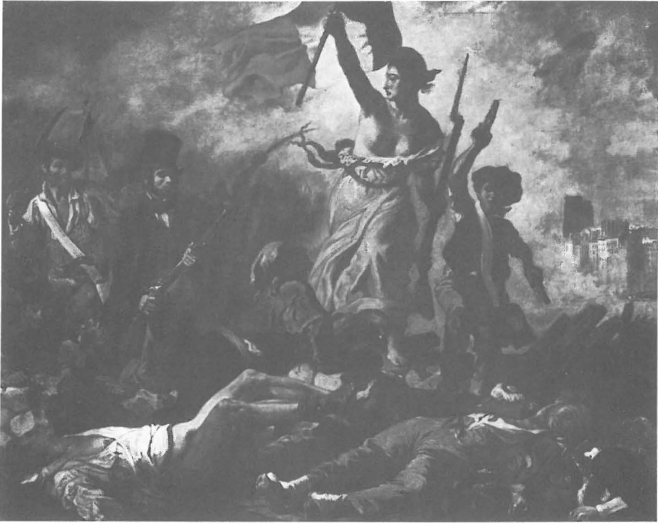
Abb. 5 Eugène Delacroix: »Die Freiheit führt das Volk«, 1830. (Louvre, Paris)