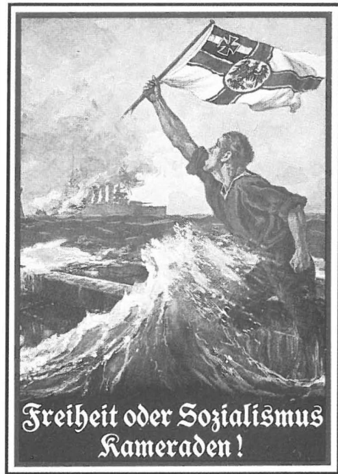
Abb. 4 Postkarte und Poster von Klaus Staeck, 1977

Allgemeinverbindlichkeit der Aussage verführte nicht nur den »Segler Gustaf« zur Annahme, das Geschehen hinge mit der Skagerrak-Schlacht zusammen, diese Meinung wird häufig vertreten. 18 Auch die unbewusste Vermischung mit bruchstückhafter Erinnerung hat Folgen bei der Interpretation. Wenn der »Segler Gustaf« z.B. schreibt, »... der Letzte ... (halte) ... die schwarzweißrote Kriegsflagge der Kaiserlichen Marine in der hoch erhobenen Seemannsfaust« 19 , dann zitiert er sinngemäß aus dem Flaggenlied, eine Beschreibung ist das nicht. Die Flagge, die tatsächlich auf dem Bild Bohrds dargestellt ist, die deutsche Kriegsflagge, trägt die Farben nur in der Gösch. Mit der Skagerrak-Schlacht wird »Der letzte Mann« dann noch in Zusammenhang gebracht durch einen anderen »letzten Mann«, nämlich den Oberheizer Zenne, der als einziger den Untergang der WIESBADEN überlebte. 20