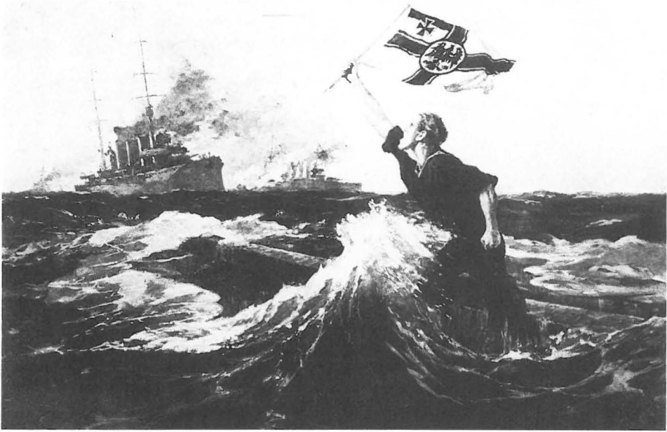
Abb. 3 Hans Bohrdt: »Der letzte Mann«. Vom Verlag O.G. Zahrfeld, Leipzig, vertriebene Reproduktion des Ölgemäldes

und Deutschland, die Aufforderung zur Übergabe energisch verweigernd, untergegangen sein. Nach dem soll ein Mann schwimmend auf den Kiel des gekenterten Schiffes dann die Flagge gezeigt haben, mit der er unterging (...). Nürnberg soll ebenfalls in dieser heroischen Weise untergegangen sein, wie von Leuten der Cornwall erzählt wurde, welcher Kreuzer am 21. d.M. kurze Zeit im Hafen lag.« 12