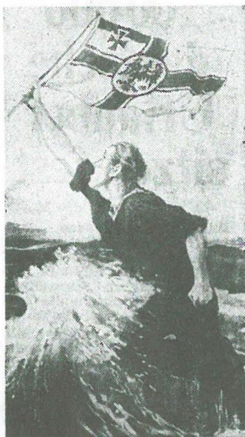
„Der letzte Mann“ nannte Hans Bohrdt sein 1916 entstandenes Bild von der Skagerrak-Schlacht