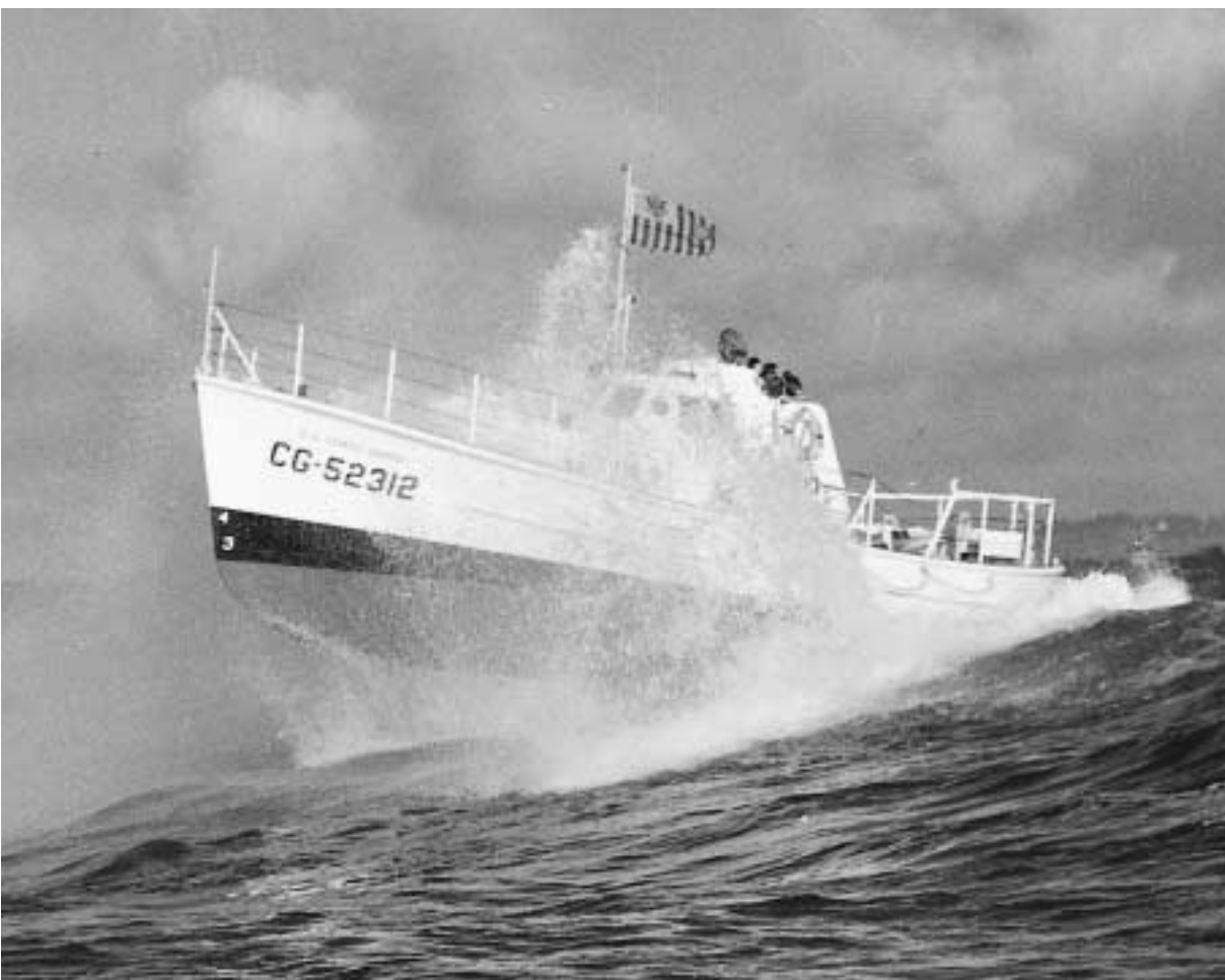
Abb. 10 Das 52-Fuß-Seenotrettungsboot VICTORY (CG-52312) der US Coast Guard in der schweren Brandung des Pazifik.

stenwache, die neben der Fischereikontrolle als Hauptaufgabe auch nebenbei für Seenotrettung zuständig ist. Es handelt sich also um eine der USCG nicht ganz unähnliche Organisation, auch wenn letztere ein noch wesentlich größeres Aufgabenspektrum abdeckt. In Großbritannien haben wir es dagegen bis heute mit einer scharfen Trennung zwischen dem »Law Enforcement« einerseits zu tun, das von der Royal Navy sowie in geringerem Maß vom Zoll und dem schottischen Fischereischutz durchgeführt wird, und der humanitären Seenotrettung andererseits, für die in erster Linie die legendäre RNLI steht.