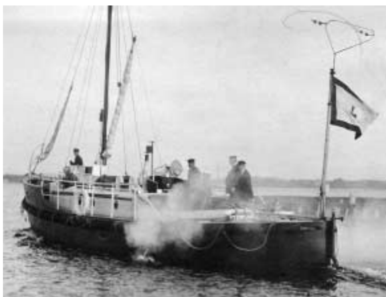
Abb. 4 Das 1926 in Dienst gestellte Motorrettungsboot HINDENBURG fand zwar 1928 auf der II. ILC in Paris Interesse bei den Delegierten der USCG, mußte aber 1932 wegen technischer Mängel außer Dienst gestellt werden.

Auf der folgenden Veranstaltung dieser Art im Juni 1928 in Paris saßen, neben den Delegierten anderer Nationen, auch Deutsche und Amerikaner gemeinsam am Konferenztisch, und es gab zwischen ihnen Berührungspunkte. So wurde ein Vorschlag der US-Seite (die USCG hatte sich mit vier Referaten die meiste Arbeit gemacht) zur Vereinheitlichung optischer Notsignale von der DGzRS unterstützt. Diese hatte ferner das zwei Jahre zuvor erbaute Rettungsboot mit Rohölmotor HINDENBURG nach Paris gebracht und stellte es den Teilnehmern in einem aus-