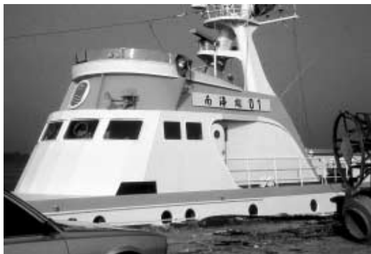
Abb. 13 Chinesische Schriftzeichen und statt des bisherigen Tatenkreuzes ein neues Wappen mit der Staatsflagge der VR China am Turmaufbau des ehemaligen Seenotkreuzers HERMANN RITTER der DGzRS, Ende 1988. Die Übersetzung des neuen Schiffsnamens lautet »Südsee-Kontrollschiff Nr. 01«.

gültig hinter sich gelassen hatte, zeigte sich für die DGzRS auch Ende 1988, als sie den 1977 erbauten 44-Meter-Seenotkreuzer HERMANN RITTER vorzeitig aus ihrer Flotte ausmusterte und für den Such- und Rettungsdienst im Südchinesischen Meer an die Volksrepublik verkaufte. 179