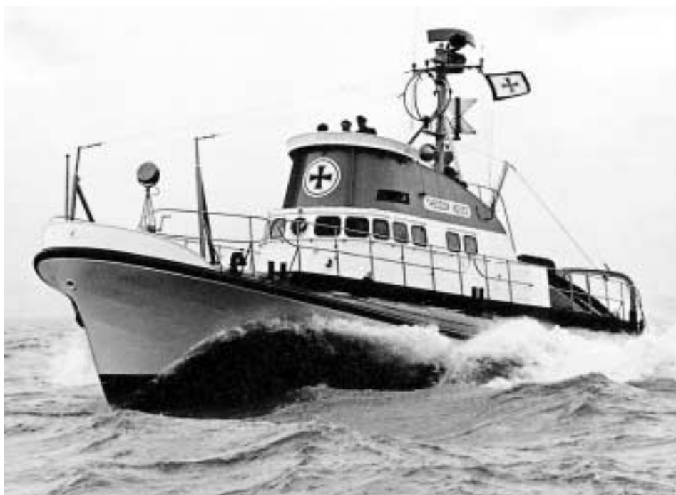
Abb. 5 Der 1957 in Dienst gestellte Seenotkreuzer THEODOR HEUSS war das erste ausgereifte Boot dieses Typs und stieß auch bei der USCG auf Interesse.

durch einen neuen Rettungsboottyp (47 Fuß bzw. 14,3 m) ersetzt, der in den 1990er Jahren entwickelt wurde und, nunmehr auf einer Werft in New Orleans serienmäßig gefertigt, der Flotte zuläuft und von Kanada in Lizenz für den Eigenbedarf nachgebaut wird. 65