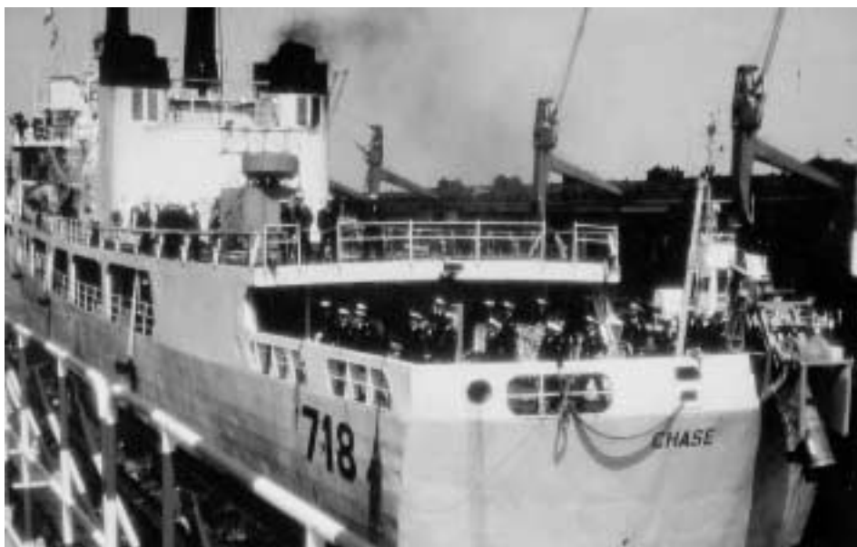
Abb. 12 Ankunft der beiden Küstenwachtschiffe USCGC CHASE (vorne) und USCGC GALLATIN (verdeckt) im bremischen Überseehafen am 23. Juni 1983.

bleiben. Die ursprünglich für die ILC vorgesehene Abordnung wollte sich jedenfalls ihre Reise nach Europa auch unter den veränderten Umständen nicht nehmen lassen und stellte ihren Reiseplan, der nunmehr unter dem Oberbegriff Inspection of Coast Guard Units 160 lief, geringfügig um. Drei Tage vor Beginn der ILC teilte Commander Powers mit, daß am Vormittag des 29. Juni Konteradmiral Hirshfield mit seiner Delegation in der Werderstraße erscheinen würde. Da Helms nicht verfügbar war, sollte sein Stellvertreter, der Bremer Reeder Werner Vinnen, sich um die amerikanische Besuchergruppe kümmern. 161 Dieser Besuch fand dann auch statt. 162