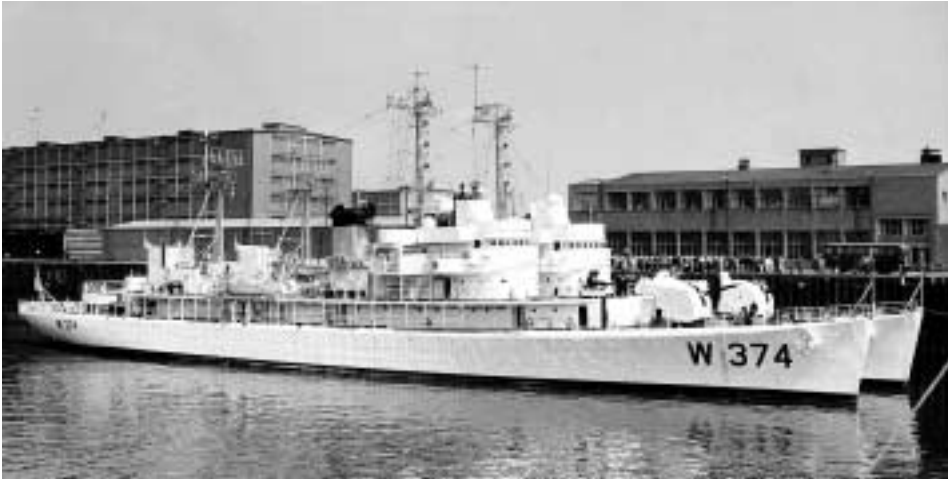
Abb. 11 Die beiden Küstenwachtschiffe USCGC ABSECON (außen liegend) und USCGC YAKUTAT (verdeckt) Ende Juni 1964 zu Besuch im Europahafen in Bremen.

In ihrem 1960 fertiggestellten Konferenzbericht zog die DGzRS Bilanz: In May 1958 invitations were sent out to 31 Life-Boat Societies in 27 countries. 17 countries with a total of 61 delegates representing 19 Life-Boat Societies, accepted and attended the VIII. International Life-Boat Conference. We deeply regretted that delegates were not present from Chile, China, Guatemala, India, Israel, Italy, Morocco, New Zealand, Uruguay and the U.S.A. In addition, the Eastern Zone of Germany did not send a delegate. 155