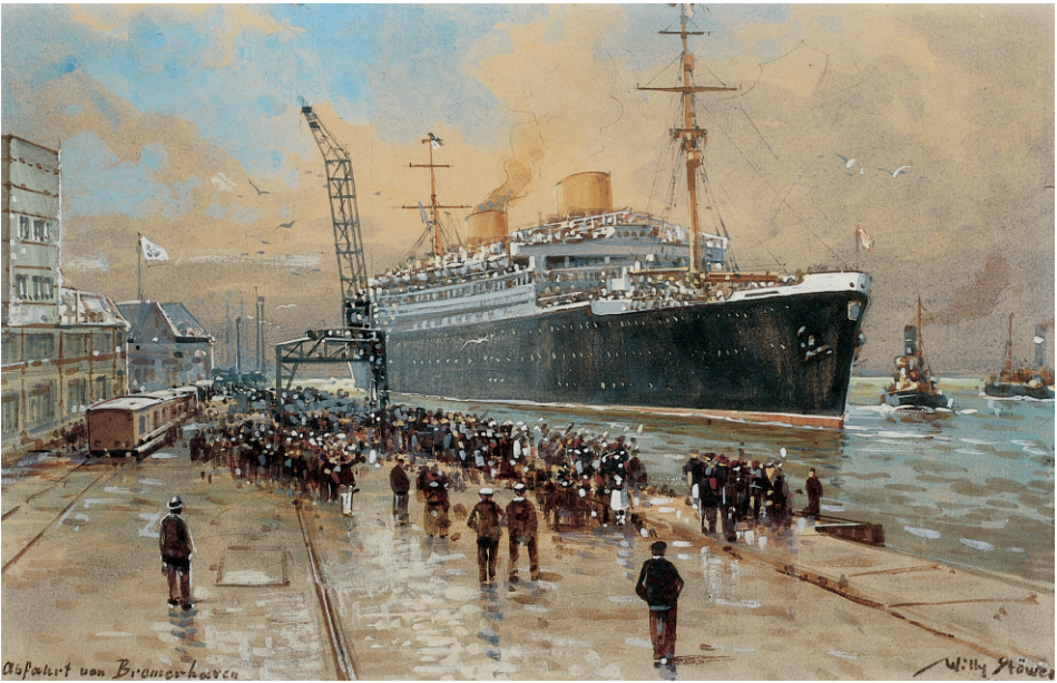
Abb. 5 Willy Stöwer (1864–1931): Abfahrt der BREMEN in Bremerhaven. Tempera, 17 x 26,5 cm, ca. 1930. (DSM, Inv.-Nr. I / 8807 B / 99)