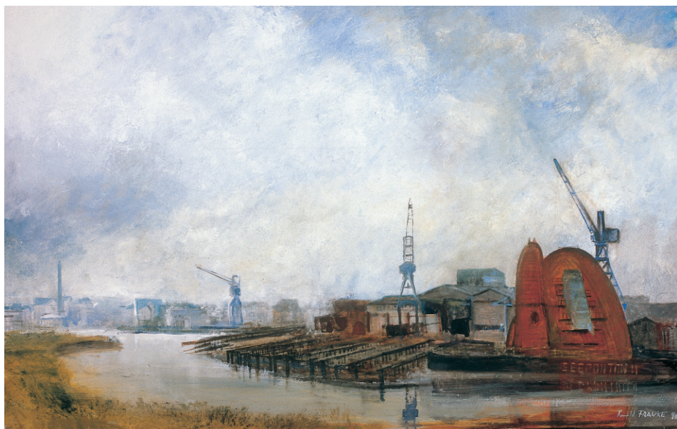
Abb. 7 Ronald Franke (Jg. 1960): Geeste Metallbau in Bremerhaven. Öl auf Leinwand, 142 x 212 cm, 1990. (DSM, Inv.-Nr. I / 6764 / 94)