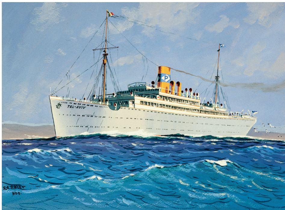
Abb. 4 Eduard Edler: Dampfer TEL AVIV (ex POLYNESIA der Hapag) des jüdischen Reeders Arnold Bernstein. Tempera, 49 x 65 cm, um 1937. (DSM, Inv.-Nr. I / 5427 / 91)