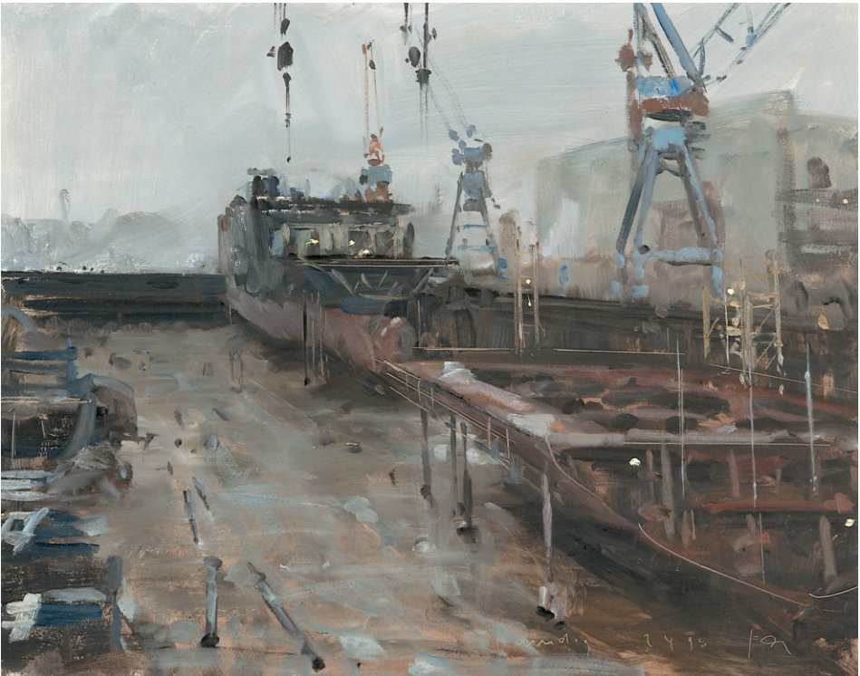
Abb. 6 Friedel Anderson (Jg. 1954): Sektionsbauweise bei HDW in Kiel. Öl auf Hartfaser, 39,5 x 50 cm, 1998. (DSM, Inv.-Nr. I / 9192 / 00)