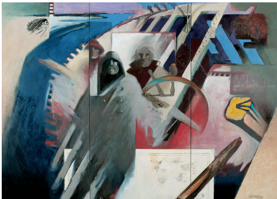
Abb. 8 Uwe Müller-Fabian (Jg. 1947): »Der unvergänglichen See, den Schiffen, die nicht mehr sind, und den Männern, deren Tage nicht wiederkehren« (Joseph Conrad). Öl auf Leinwand, 204 x 286 cm, 1989. (DSM, Inv.-Nr. I / 6443 / 93)