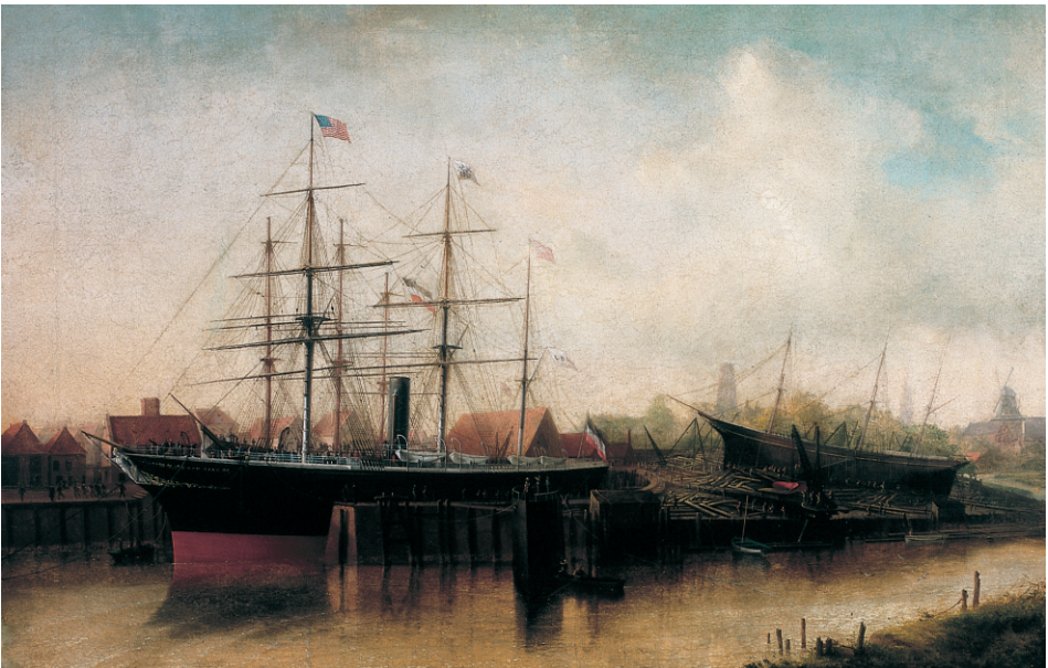
Abb. 2 Carl Justus Harmen Fedeler (1799–1858): Ulrichs Werft in Bremerhaven. Öl auf Leinwand, 77 x 115 cm, um 1868. (DSM, Inv.-Nr. I / 3724 / 92)