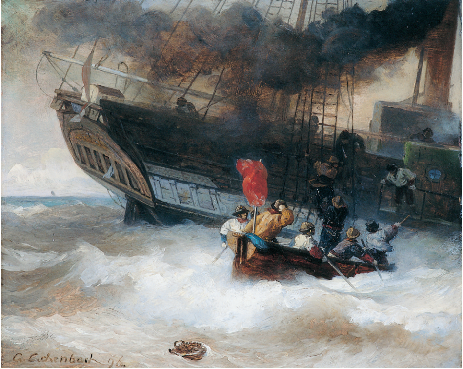
Abb. 1 Andreas Achenbach (1815–1910): Dampfschiff mit Lotsenboot auf bewegter See. Öl auf Holz, 37 x 46 cm, [18]96. (DSM, Inv.-Nr. I / 9616 / 02)