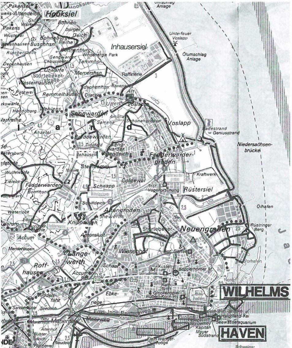
Abb. 1 Moderne Landkarte des zur ehemaligen Grafschaft Kniphausen gehörenden Westufers der äußeren Jade im Maßstab 1 : 100 000. Soweit die in vorliegendem Beitrag genannten Plätze verzeichnet sind, wurden sie weiß hervorgehoben. Wilhelmshaven als Stadt entstand erst nach den hier geschilderten Begebenheiten (1854 erster Oldenburger Landverkauf an Preußen zur Errichtung eines Nordsee-Kriegshafens).

dort nicht, sondern ist schon lange im ostfriesischen Schloß Lütetsburg ansässig, hat aber im 19. Jahrhundert den Familien-Stammsitz – baulich erhalten blieb nur ein Marstall – zurückerwerben können, im 20. Jahrhundert indes wieder veräußert. Die »Herrlichkeit« selbst war 1623 an Oldenburg und (nach einer ebenso bekannten wie pikanten Affaire um die dortige gräfliche Favoritin Elisabeth von Ungnad) als gräflich Aldenburgischer Fidei-