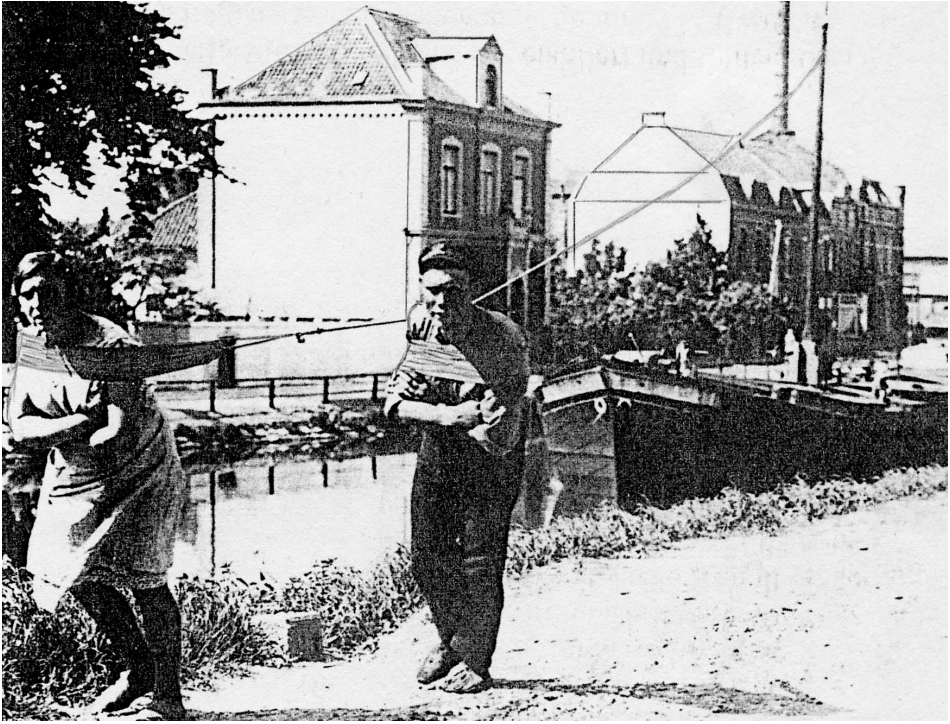
Abb. 3 Nicht näher bestimmtes Foto: Wahrscheinlich privat-familiäres Treideln eines großen Lastkahns durch Frau und Mann auf einem niederländischen Kanal noch um 1930. Nach Nederlands Scheepvaartmuseum Amsterdam: »Scheepvaartgeschiedenis«, Ausstellungskatalog, Amsterdam 1979, 18. 12 (l.u.); Foto-Archief Spaarnestad.

Wiedergabe in hiesiger Abb. 3 geht es indes nicht mehr um einen behördlich bestellten Scheepsjager, sondern eher um ein rein privatwirtschaftlich-familiär tätiges Treidelschifferpaar, das sich zu Fuß ebenso redlich wie gleichberechtigt über Gebühr abmüht – im Mitteleuropa des 20. Jahrhunderts, wohlgemerkt.