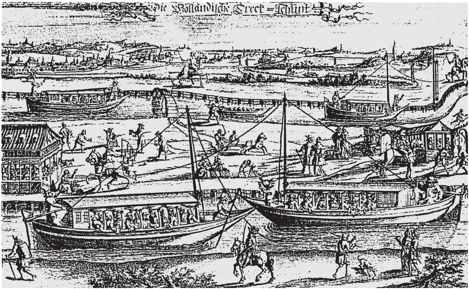
Abb. 1 Anonyme Radierung (?): Niederländische »Trekvaart« im 17. Jahrhundert, auch (oben rechts) unter Nutzung von Rollpfählen. Nach E. W. Happel: »Gröste Denkwürdigkeiten ... oder ... Relationes curiosae ...«, Teil 3, Hamburg 1687.

nur der Vermutung van Holks. Daß dort, wo die römzeitlichen Mündungsarme von Rhein, Maas und Schelde flußaufwärts schmaler wurden, auf Treideln gegen den Strom nicht verzichtet werden konnte, liegt ohnehin auf der Hand. Überdies war das Heck des »Römerschiffes« flußabwärts gerichtet, als das Fahrzeug wrack und wohl in Eile verlassen wurde.