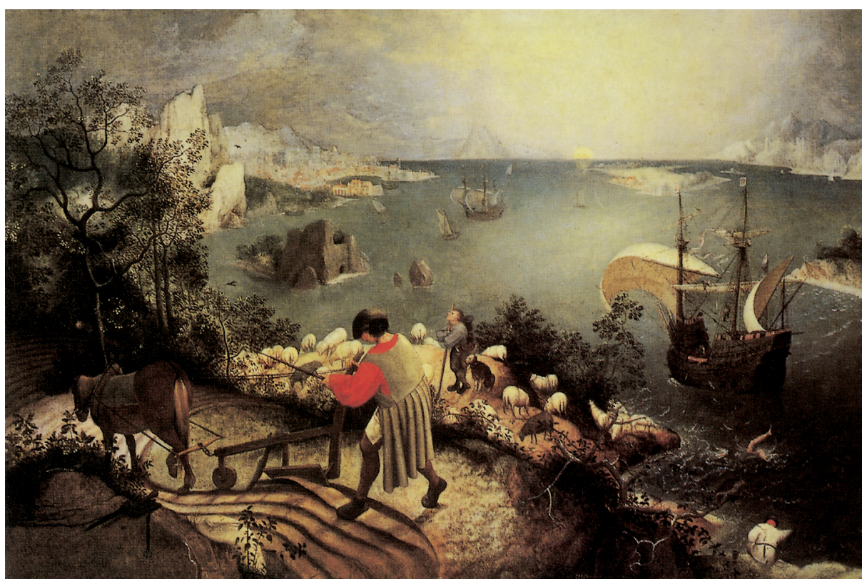
Abb. 2 Pieter Bruegel d.Ä.: Landschaft mit Sturz des Icarus (um 1558). Aus: R.-M. und R. Hagen: Bruegel. Sämtliche Gemälde. Köln (u.a.) 1999, S. 61. (Original in den Musées royaux des Beaux-Arts de Belgique, Brüssel)

bende Seeschlacht abgibt und das einen guten Eindruck davon vermittelt, wie sehr die Häfen jener Zeit zugleich immer auch imposante Befestigungsanlagen darstellten. 9 Auch sonst hat Bruegel zur Bereicherung seiner Bildkomposition hin und wieder das Hafenmotiv aufgegriffen – so etwa in dem bereits angesprochenen »Sturz des Icarus«, wo auf dem linken Bildhintergrund ein durch eine weit vorragende Landzunge bestens geschützter Hafen zu erkennen ist, oder in dem Gemälde »Landschaft mit Segelbooten und einer brennenden Stadt« (um 1552/53). 10 Besonders eindrucksvoll ist ihm dies in seinem bekannten Gemälde »Der Turmbau zu Babel« gelungen, das – ein grosses Stück, ... voll mit schönen Einzelheiten , wie schon Bruegels erster Biograph Carel van Mander 1604 zu Recht anmerkte 11 – einen großartig in Szene gesetzten Hafenprospekt enthält, worauf die kunsthistorische Forschung zu Recht immer wieder hingewiesen hat. 12 Was dem Hafenprospekt auf dem »Turmbau zu Babel« darüberhinaus einen besonderen Reiz verleiht, bisher offensichtlich jedoch weitgehend unbeachtet blieb, ist der Umstand, daß hier zwei unterschiedliche Stufen der Hafenentwicklung nebeneinander zur Darstellung gelangten und so den unmittelbaren Vergleich geradezu herausfordern.