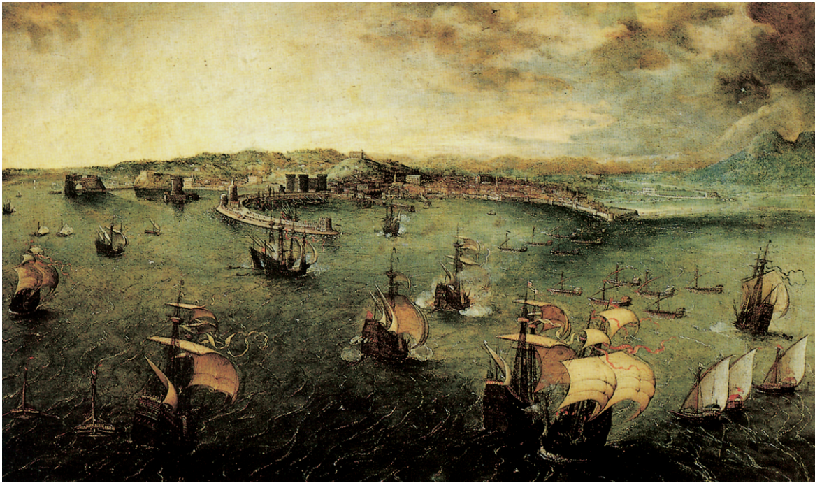
Abb. 3 Pieter Bruegel d.Ä.: Blick auf Neapel (um 1558). (Original in der Doria Pamphili Galerie, Rom)