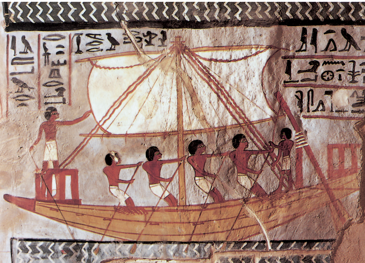
Abb. 7 Nilschiff auf der Freske aus dem Sennefer-Grab im Tal der Könige (bei Luxor, 14. Jahrhundert v. Chr.). Aus: B. Crochet: Geschichte der Seefahrt. Bielefeld 1995, S. 7. (Original Slg. G. Dagli Orti)