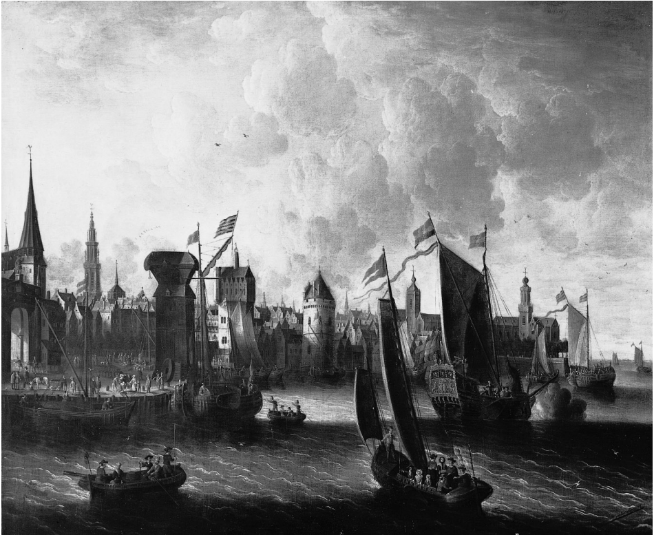
Abb. 6 Pieter van deVelde: Hafen von Antwerpen (datiert 1723). Aus: DSA 18, 1995, S. 193. (Original Fred Teltscher Ltd., London (?))

Schleibucht; die dort ausgegrabenen hölzernen Landebrücken wurden dendrochronologisch in das Jahr 936 datiert. 40 Trotz der entwicklungstypischen zeitlichen Abfolge, derzufolge die Schiffsländen stets am Beginn der Hafenentwicklung stehen, um dann seit der Jahrhundertwende allmählich durch kaiartige Hafenanlagen ersetzt zu werden, ist Bruegels Hafenprospekt, auf dem die beiden Hafenformen gleichzeitig nebeneinander existieren, nicht von vornherein als unhistorisch anzusprechen. Die Landetechnik des Auflaufens auf dem flachen Ufer war nämlich insbesondere bei landwirtschaftlich geprägten Verkehrssiedlungen am Wasser mit ihrer wenig entwicklungsfähigen Kleinschiffahrt noch lange Zeit, zum Teil bis ins 19. Jahrhundert, in Gebrauch. 41