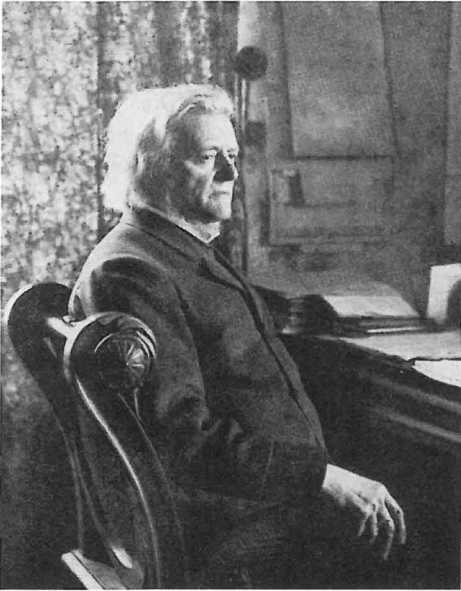
Georg von Neumayer (1826–1909), von der bayerischen Krone 1900 geadelt. Seit 1875 Leiter der Deutschen Seewarte und unermüdlicher Verfechter einer koordinierten Erforschung der Antarktis.

miteinbeziehen. Zuletzt waren es zwei Expeditionen, die in die Südhemisphäre vorstießen, nämlich eine französische in die Orange-Bai auf Feuerland und eine deutsche auf die Insel Südgeorgien. 4 Buys-Ballot, Direktor des »Koninglijk Nederlandsch Meteorologisch Instituut« in Utrecht, bekannt durch sein »Barisches Windgesetz«, arbeitete mit Neumayer schon seit Anfang der 1870er Jahre in der Küstenmeteorologie und in der Meteorologie des Atlantik eng zusammen. 5 Neumayers Brief (Entwurf) lautet 6 :