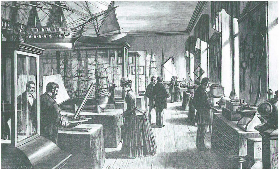
Die neu erbaute und 1881 fertiggestellte Deutsche Seewarte auf den Elbhöhen (Stintfang); sie war ein Wahrzeichen Hamburgs. 1945 wurde sie durch Fliegerbomben zerstört.

Initiatoren dieses Unternehmens waren der österreichisch-ungarische Linienschiffleutnant Carl Weyprecht (1838–1881) und Georg Neumayer, damals Direktor der Seewarte in Hamburg. 2 Die Pläne für das Polarjahr hatten im Oktober 1879 die Vertreter von acht Nationen im alten Hamburger Seemannshaus unter Vorsitz Neumayers entworfen. 3 Wie ein Kranz legten sich die Beobachtungsstationen der teilnehmenden Länder um den Nordpol. Neumayer wollte sich damit nicht zufrieden geben und auch subantarktische Gebiete