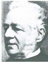
Christoph Hendrik Diederik Buys-Ballot (1817–1890), Gründer des Meteorologischen Instituts in Utrecht. Er lieferte 1856 wichtige Arbeiten zum Barischen Windgesetz und arbeitete schon früh mit Georg Neumayer und der Deutschen Seewarte eng zusammen.

Die Hoffmeyerschen Nordatlantik-Karten sind nicht zu verwechseln mit den von W. Köppen (Meteorologe der Deutschen Seewarte) seit dem 1. Januar 1876 herausgegebenen aktuellen täglichen Wetterkarten und Wetterberichten. Das Studium der Nordatlantik-Karten zeigte insbesondere die Zugstraßen der wetterbestimmenden Tiefdruckgebiete. 9