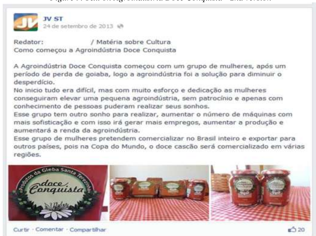
Figura 9. Texto sobre Agroindústria Doce Conquista – 2ª versão Figure 9. Text on Agroindústria Doce Conquista - 2nd version

A novidade não se voltou para o fazer em si, moldado pela lógica do grafocentrismo, mas para o destino do produto final. Ao ser postado em rede social, não é apenas algo para ser lido e avaliado pelo professor, mas, além disso, para ser lido e apreciado por uma comunidade.