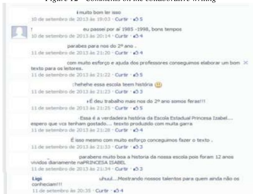
Figure 12 - Comments on the collaborative writing

Alguns comentários feitos a partir da postagem sobre a escola também certificam esse caráter familiar, que passa pela relação entre os alunos atuais e outros alunos mais antigos e a escola: muito bom ler isso; parabéns muito boa a história da nossa escola pois foram 12 anos vividos diariamente na Princesa Isabel.