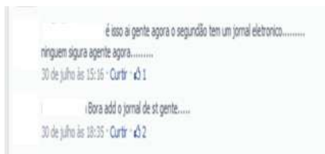
Figure 6. Comments on the presentation of Luciana