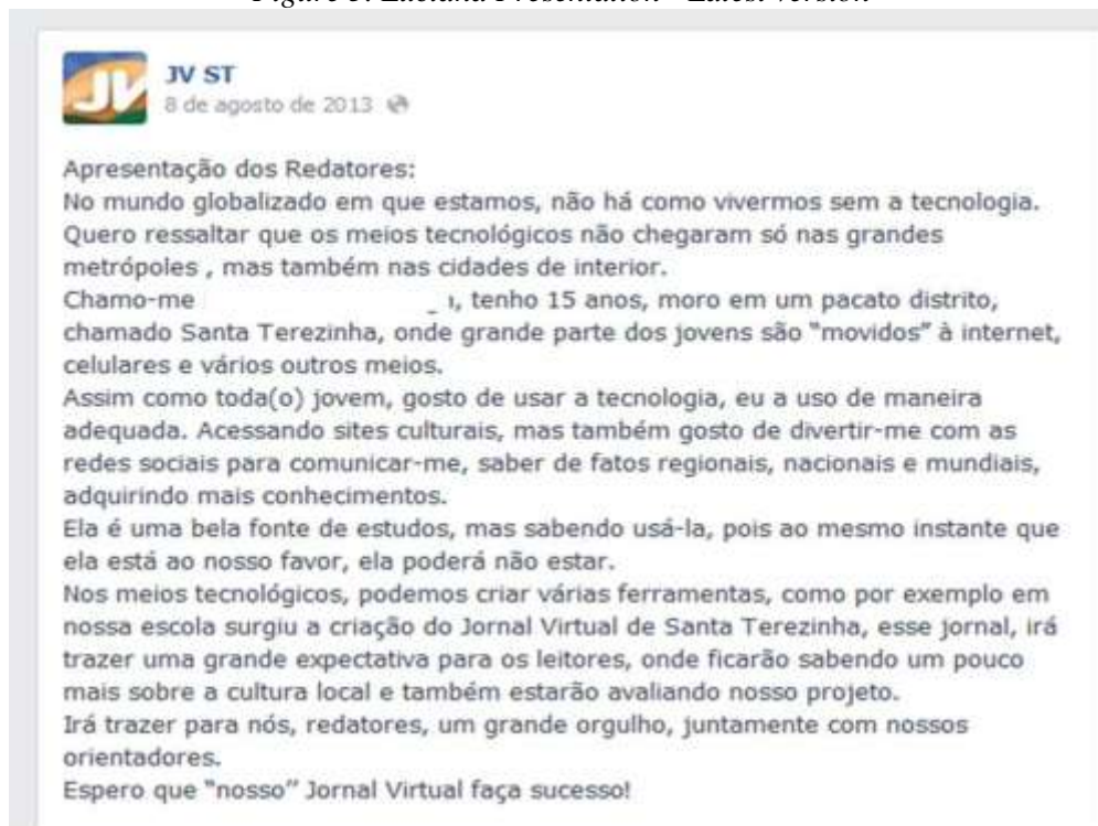
Figure 5. Luciana Presentation - Latest version

Interessante foi perceber a forma distinta de escrita dos próprios alunos neste suporte virtual, pois ao mesmo tempo em que procuravam manter a língua padrão nas matérias utilizavam-se de coloquialismos e do “internetês” nos comentários publicados, como vimos na apresentação pessoal do Altamiro e de Luciana.