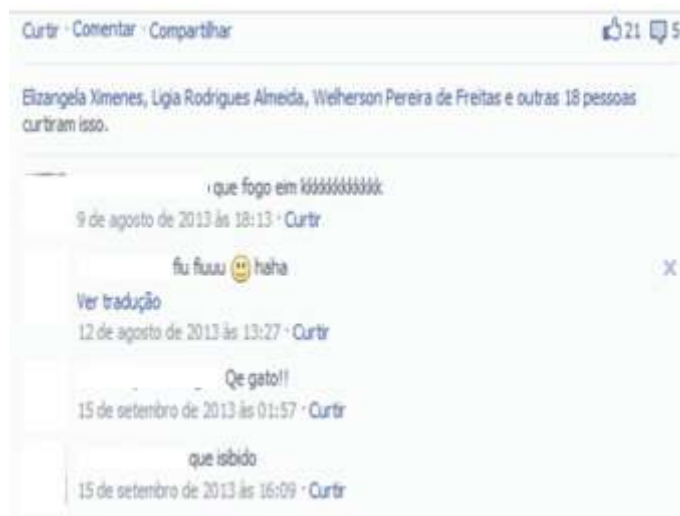
Figure 3. Comments from the presentation Altamiro

O Altamiro da descrição é centrado nos estudos e também muito extrovertido com os colegas; a imagem (que optamos por não colocar aqui), que mostra o rapaz em uma cachoeira, em pose, sentado em uma pedra, revela características não verbalizadas na escrita: alguém que gosta muito na natureza, esportista, pelo aspecto físico, charmoso. Ou seja, a foto revela características não verbalizadas na escrita.