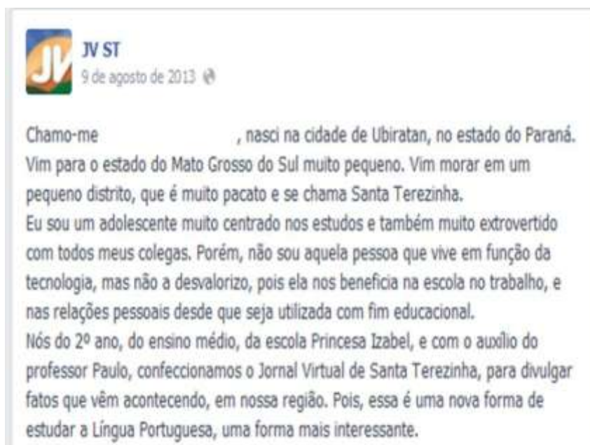
Figura 2. Apresentação de Altamiro - 2ª versão Figure 2. Representation of Altamiro - 2nd version

Somente na etapa seguinte, e sob o aval do professor, é que digitam os textos no computador e, na sequência, inserem fotos pessoais. Postados os textos, inicia-se o diálogo na plataforma: