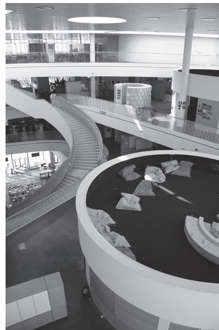
Abb. 2: Orestad College, Kopenhagen