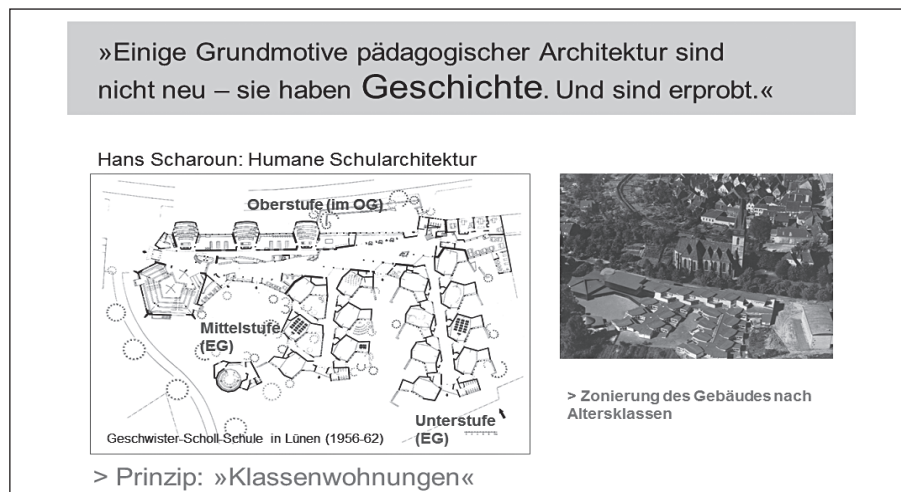
Abbildung 3: Organisation des Grundrisses der Geschwister-Scholl-Schule, Lünen

Zeichnung: RE.FLEX architects_urbanists; Grundriss und Foto: Akademie der Künste, Berlin, © VG Bild-Kunst, Bonn 2012