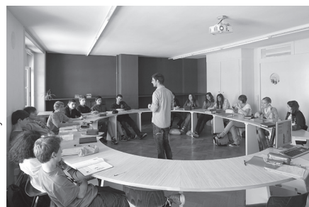
Abbildung 4a: Haus des Lernens »Instruktion«

Gute Hinweise darauf, wie bestehende Architektur in zeitgemäße Lernumge-