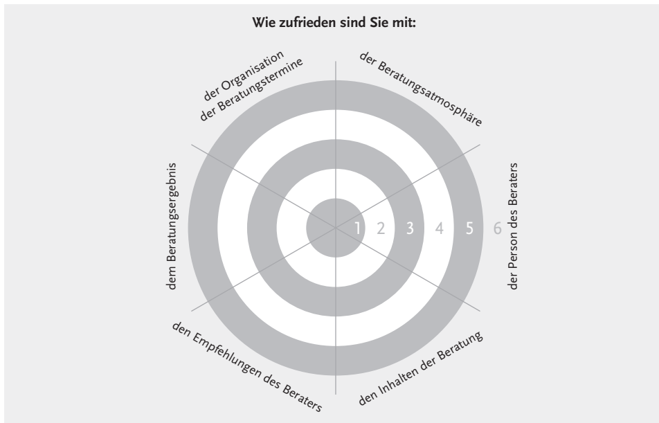
Abb. 2: Auszug aus dem Feedbackbogen, zur Bewertung unmittelbar nach dem Beratungsprozess