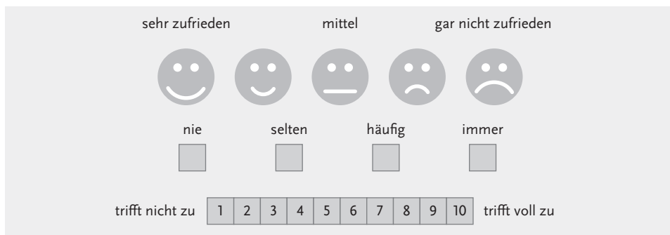
Abb. 1: Fiktive Beispiele für Bewertungsskalen

Wie die oben genannten Zitate verdeutlichen, handelt es sich bei Beobachtungen um subjektive Einschätzungen bzw. Interpretationen der Beratenden. Zufriedenheitsabfragen können aber auch, als Befragung durchgeführt, die subjektive Meinung der Ratsuchenden erfassen. Diese können mündlich (z. B. direkte Nachfrage im Anschluss an die Beratung, telefonische Befragung) oder schriftlich (z. B. Feedback-/Beschwerdekasten, Postkartenaktion, Onlineumfrage) erfolgen. Die Befragung kann sich zudem – je nach gewählter Methode – im Grad ihrer Systematisierung und Aussagekraft stark unterscheiden. Sie erfolgt beispielsweise qualitativ in Form von eher losem Feedback (z. B.: „Wie hat Ihnen die Beratung gefallen?“) oder quantitativ mithilfe von Ratingskalen (siehe Abbildung 1).