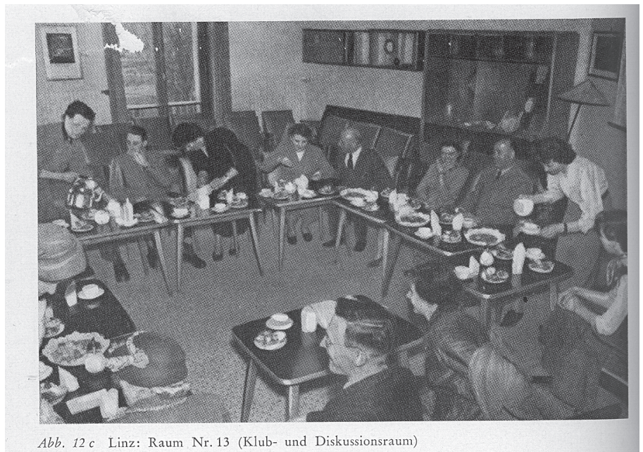
Abb. 12 c Linz: Raum Nr. 13 (Klub- und Diskussionsraum)

Im Gutachten des Deutschen Ausschusses für das Erziehungs- und Bildungswesen lässt sich nachlesen, dass auch Fragen der Ästhetik bzw. des Stils eine wichtige Rolle spielen: »Die Volkshochschule als Stätte gemeinsamer Bildung muss in ihrer Arbeit, in ihrer Wirkung und in ihrem Auftreten gegen-