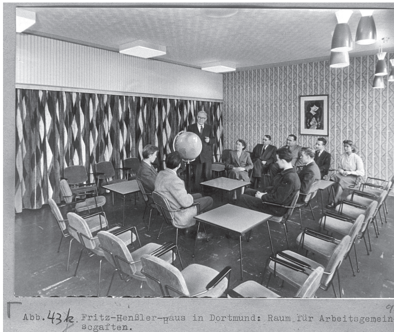
Abb. 43 k. Fritz-Henßler-Haus in Dortmund: Raum für Arbeitsgemeinschaften.

er der Erste war, der eine systematisierende Bestandsaufnahme der Haus- und Innenarchitektur von Erwachsenenbildungseinrichtungen vorgenommen hat. Dies bewerkstelligte er beschreibend und durch einen Fotokatalog. Fotografisch dokumentiert wurden 90