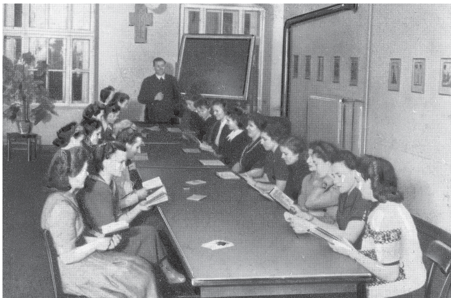
Katholische Landvolkhochschule Hardeshausen – Lehr- und Diskussionsraum, um 1959

Improvisation und eines Themen- und Perspektivenspektrums, die vermittelt werden sollten. Diese Schnappschüsse transportieren meiner Auffassung nach die Sichtweise des Erwachsenenpädagogen auf die Innenarchitektur und das Mobiliar. Sie stellen die Frage danach, was Architektur leisten kann und muss, um gelingende Lehr-/Lernprozesse in Gang zu setzen.