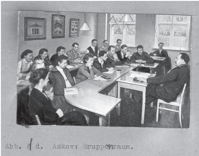
Heimvolkshochschule Askov, Dänemark – Gruppenraum, um 1959