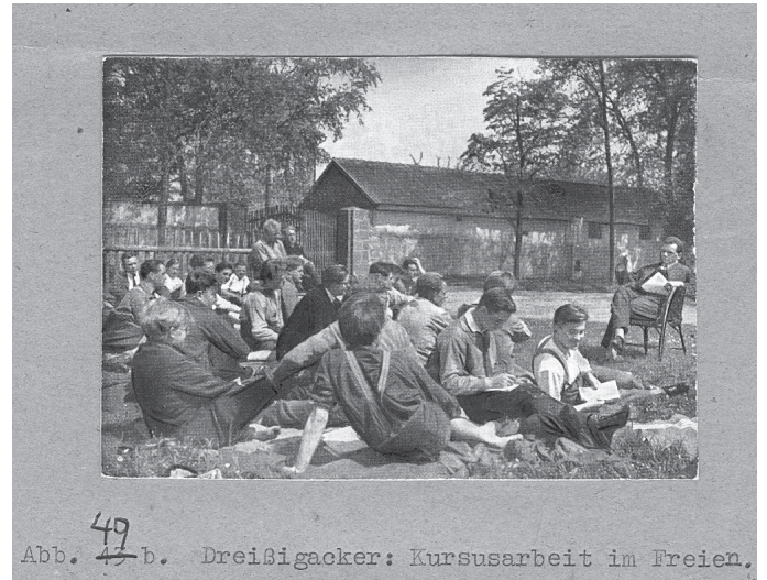
Heimvolkshochschule Dreißigacker – Kurs im Freien, um 1930