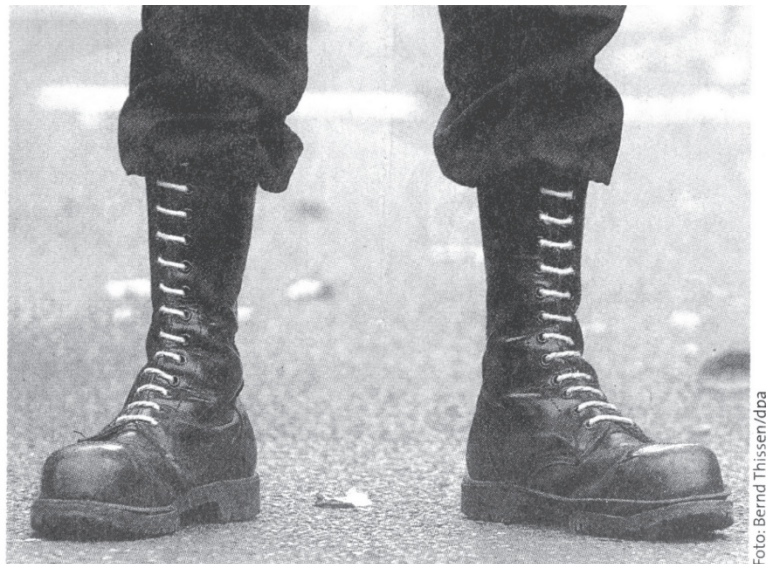
SPRINGERSTIEFEL , in Ostdeutschland ganz normale Schuhe

Antje Schlottmann: Ich kann da direkt anknüpfen, sogar thematisch und ich könnte dazu sogar schon mal mein Bild gebrauchen.