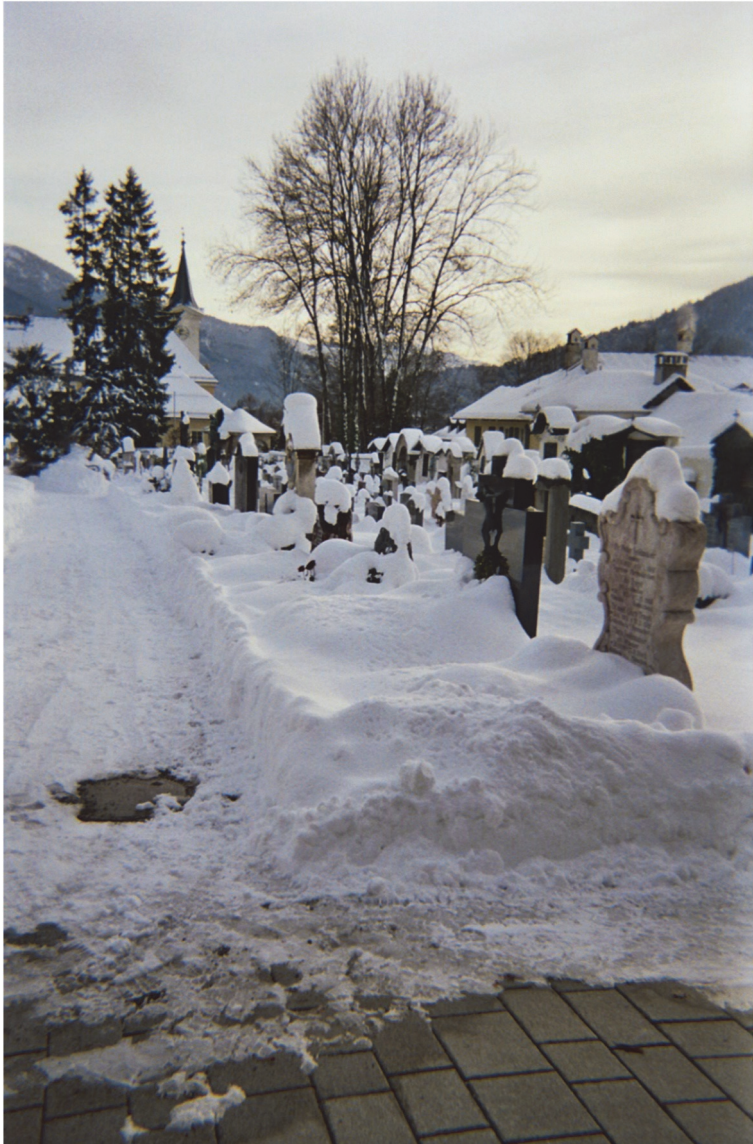
Abbildung 9: Bildmaterial zum SynPodium, P. Dirksmeier

Nämlich mit dem Wahrheitsanspruch, den der Proband/ die Probandin damit verfolgen und wie weit sie eigentlich gehen in dem, was sie zeigen, mir als Forscher. Wie gehe ich damit um? Was Sie hier sehen, ist ein Bild, das ich im Laufe meiner Arbeiten bekommen habe, auf dem das Grab der Frau dieses Probanden abgebildet ist. Die Aufgabe war, fotografieren Sie für mich etwas, was Identität für sie bedeutet, und er hat einen Ort fotografiert, der ganz privat ist. Die Frau ist tragi-scherweise sehr früh verstorben, was für ihn natürlich eine große Bedeutung hat, und er hat, ausgehend von diesem Bild, intime Details erzählt. Für ihn war es Wahrheit. Für ihn war es offensichtlich auch okay es mir zu sagen. Er war hochintelligent. Er war alles andere als bildungsfern. Er wusste genau was er macht. Er hat selber auch geschrieben, dementspre-