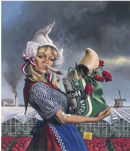
Abbildung 3: prominente Repräsentation (©)

Jetzt kommen meine Bilder. Um einen minikleinen Eindruck zu vermitteln, worum es bei diesen Rezeptionsstudien ging. Das eine ist das Ausstellungsplakat, das andere eine sehr prominente Repräsentation, etwa als Spiegel-Titelbild (siehe Abbildung 2 & Abbildung 3), und die unteren drei beziehen sich auf einen – in meinem Falle – Glücksfall. Ich habe diese empirische Forschung durchgeführt zwischen 2000 und 2003. Ich hatte jetzt das Glück, dass im Jahr 2000 die Fußball-EM in den Niederlanden und Belgien stattfand. Ich war also vor Ort,