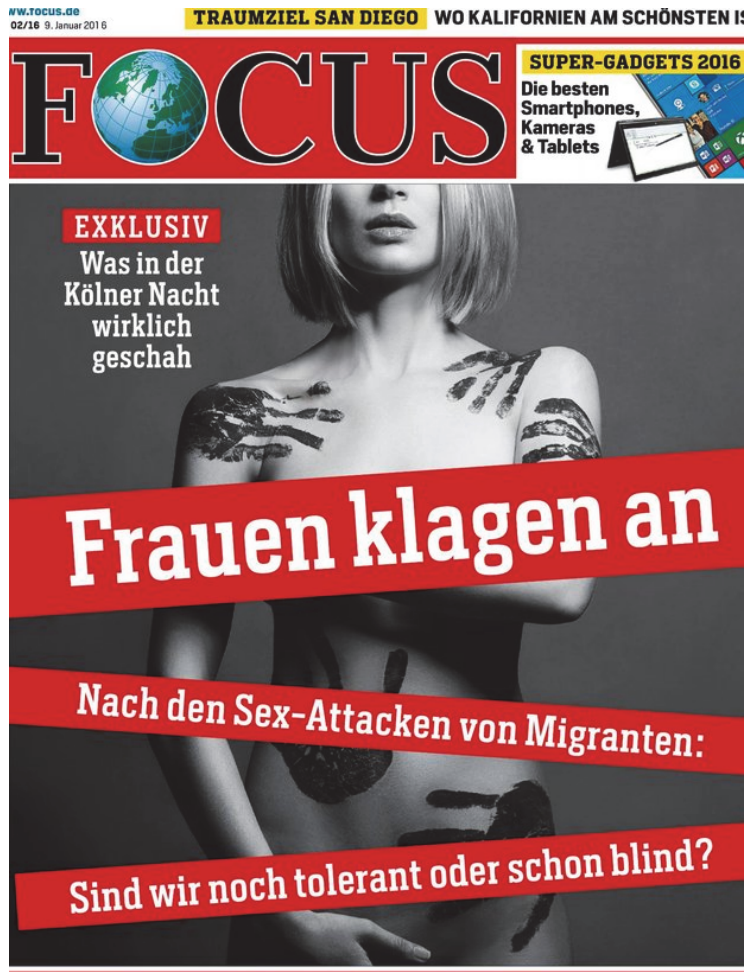
Abbildung 7: Bildmaterial zum SynPodium, J. Wintzer

Ich kann dem nicht ganz zustimmen. Bilder können auch ohne Text funktionieren. Das ist mein Bild und ich würde behaupten, dass das Bild seit zwei Monaten und sagen wir bis in sechs Monaten auch ohne Text verständlich ist. Denn der hegemoniale Diskurs ist darauf eingestimmt. Dieses Bild ist verständlich wie Bilder von Hochhäusern nach dem 11. September 2001. Sie lenken die Interpretation des Bildes auch ohne Text in eine bestimmte Richtung. Aber die funktioniert nur innerhalb eines bestimmten raumzeitlichen Kontextes. Text und Bild sind eine sehr wichtige Kombination, aber das Beispiel zeigt wie Bilder im Kontext eines hegemonialen Diskurses auch ohne Text verständlich sind.