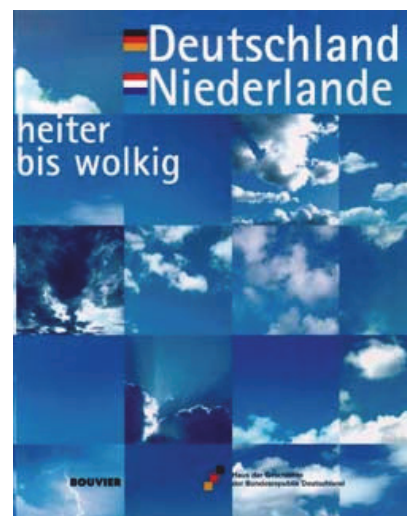
Abbildung 2: Ausstellungsplakat „Deutschland – Niederlande. Heiter bis wolkig“.

Das zweite Beispiel bezieht sich auf zwei große Ausstellungen, die damals liefen in Amsterdam und in Bonn zu den deutsch-niederländischen Beziehungen, die hießen „Deutschland – Niederlande. Heiter bis wolkig“. Und auch da hatte mich natürlich weniger zu interessieren, was jetzt da eigentlich in diesen Ausstellungen gezeigt wird, als das, was die Leute, die da in diese Ausstellungen hineingegangen waren, damit machen. Also wieder die Rezeption. Und dementsprechend war der Fokus meiner Analyse die Besucherbücher beider Ausstellungen. Die liefen beide jeweils sehr lange, also einmal sechs und einmal neun Monate, und es gab wirklich tausende und abertausende Einträge in diesen Besucherbüchern. Sprich, ich habe versucht, das denkende Subjekt, soweit es irgendwie geht, raus zunehmen und komme dann natürlich zu einem Ergebnis, aber ob das ein super Ergebnis ist – keine Ahnung.