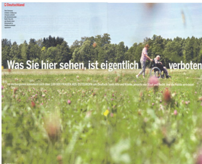
Abbildung 5: Was Sie hier sehen, ist eigentlich verboten

Es ist also eher was Negatives. Und in den Pflegefamilien in Deutschland wurde das sehr oft auch positiv konnotiert, dass die Frau schon fünfunddreißig ist, weil sie so viel Lebenserfahrung hat. Das meine ich damit. Und es ging mir hier auf die Wechselwirkung dieser Sozialkategorien in einer einzelnen Person und wie die sich beim Grenzübertritt verändert.