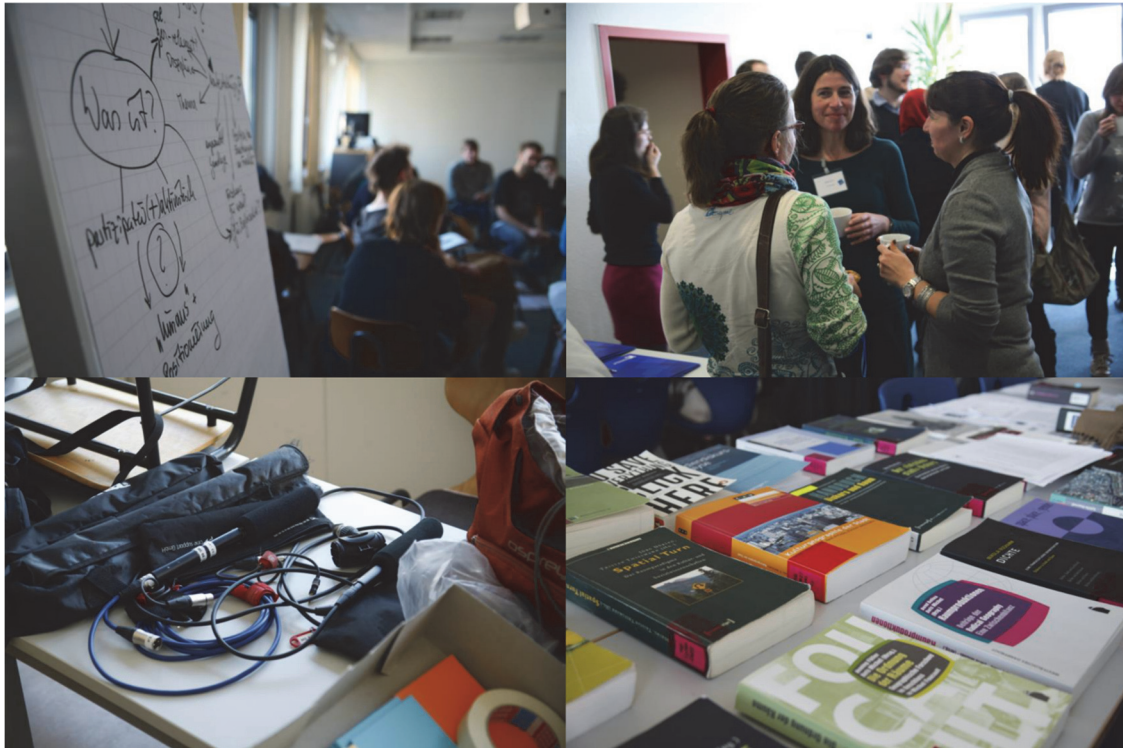
Foto 1: Die Vernetzung der angereisten Wissenschaftler_innen und das Ausprobieren neuer raumbezogener Forschungsmethoden stand im Vordergrund der zweitägigen Veranstaltung

Den Alltag der raumbezogenen Forschung zum Gegenstand der Diskussion zu machen ist das Ziel der neuen Veranstaltungsreihe IfL Forschungswerkstatt am Leibniz-Institut für Länderkunde. Die zweitägige Auftaktveranstaltung im Februar 2015 bot die Möglichkeit, ausgehend von der methodologischen Grundlagenforschung und der Reflektion der eigenen Forschungspraxis aktuelle Problematiken von Forschungszugängen zu diskutieren sowie neue Methoden der raumbezogenen Forschung direkt „im Feld“ auszuprobieren. Die IfL Forschungswerkstatt ist ein Vernetzungsangebot an die deutschsprachige raumwissenschaftliche Community, um sich über Forschungszugänge, methodische Probleme und neue Ansätze auszutauschen.