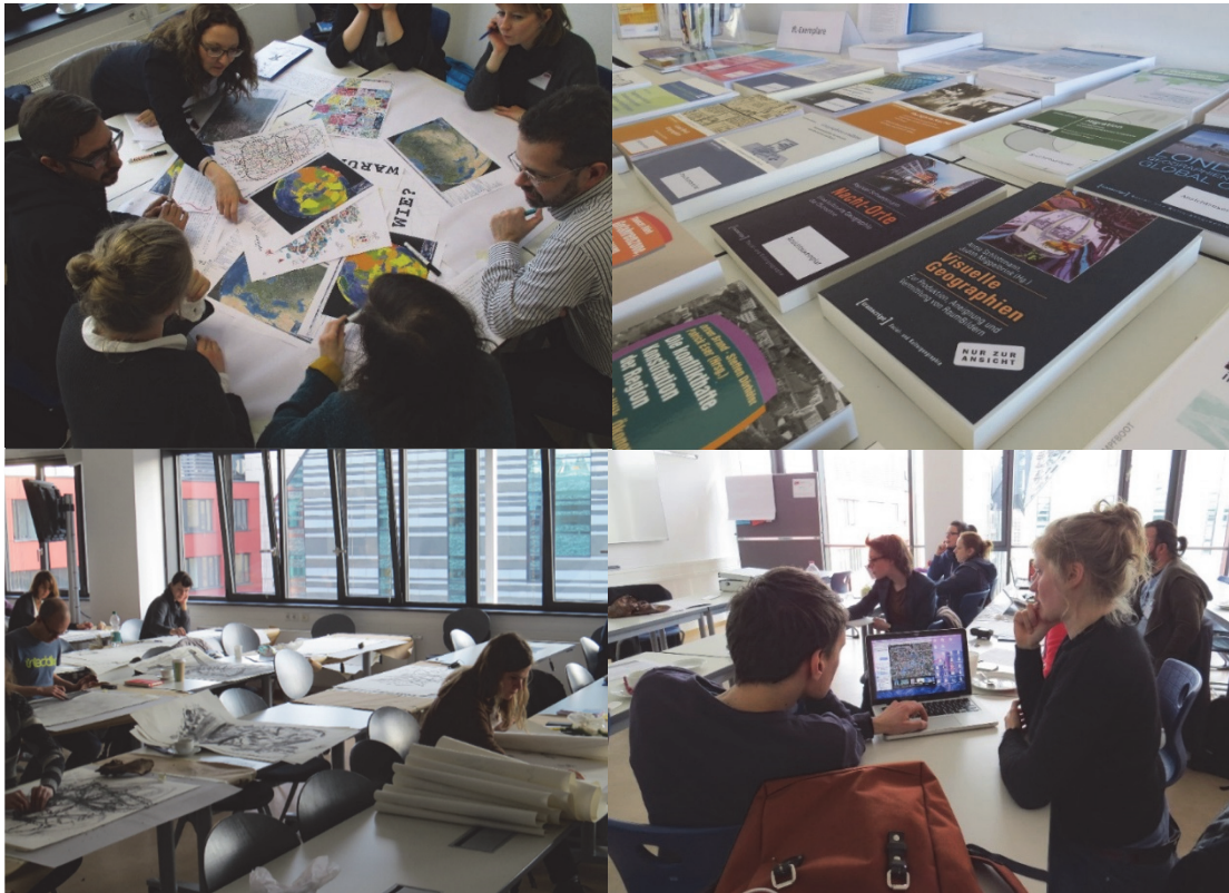
Foto 112: Bereits zum zweiten Mal brachte die IfL Forschungswerkstatt Wissenschaftler_innen aus dem gesamten deutschsprachigen Raum für einen intensiven und interaktiven fachlichen Austausch zusammen.

Visualisierungen sind im forschungspraktischen Alltag fast allgegenwärtig und oftmals mit Raumbezügen verknüpft. In den raumbezogenen Wissenschaften werden beispielsweise seit jeher Visualisierungen wie Karten, Fotos und Schaubilder eingesetzt, um Wissen zu vermitteln. Über die Implikationen und Potenziale visuellen Forschens im Verhältnis zum Raum besteht jedoch weiterhin großer Diskussionsbedarf. Die zweitägige IfL Forschungswerkstatt #2 thematisierte deshalb ausgiebig und aus kritischer Perspektive verschiedene Aspekte von Visualität in der raumbezogenen Forschungspraxis und mehrere Methoden dieses Forschungsfeldes. Im Vordergrund standen theoriegeleitete Inputs (im SynPodium ), Aspekte der informellen Vernetzung und des gleichberechtigten Austausches zwischen den Teilnehmenden (in den Diskussionsforen) sowie das Ausprobieren der visuellen Methoden (in den ExperiSpaces ). Rund einhundert Wissenschaftler_innen aus dem deutschsprachigen Raum nahmen an der Veranstaltung des Leibniz-Instituts für Länderkunde teil. Viele von ihnen brachten ihr Wissen ein und gestalteten die Angebote aktiv mit.