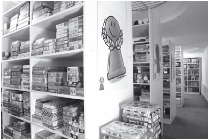
Im Fundus des Spiele-Archivs werden auf einer Fläche von etwa 800 qm über 30.000 Spiele dokumentiert.

Mit dem gleichen interdisziplinären Ansatz entstand 1995 an der Universität Leiden eine internationale Arbeitsgruppe für »Board Games Studies«. Historiker und Archäologen, Ethnologen und Anthropologen, Mathematiker, Ökonomen und Vertreter unterschiedlicher geisteswissenschaftlicher Disziplinen treffen sich alljährlich in einem anderen