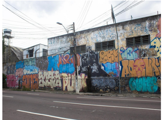
Figura 12: Sopa de Letras. Sem título. 2017. Fotografia digital.