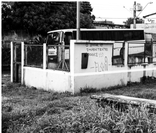
Figura 7: Pixação. Fonte: MORAES, J. Sem título. 2016. Fotografia digital.