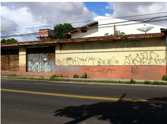
Figura 11: Muro com pixações. Sem título. 2017. Fotografia digital.