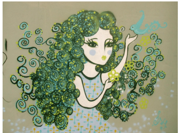
Figura 13: Personagem.