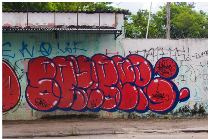
Figura 9: Graffiti no estilo bubblestyle . Sem título. 2016. Fotografia digital.