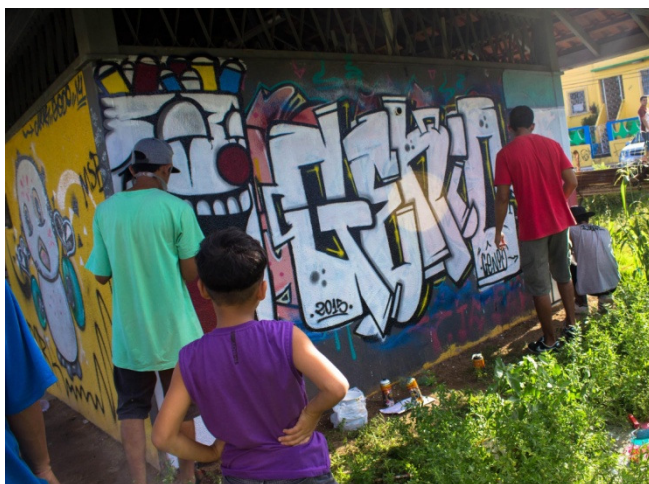
Figura 1: Graffiti desenvolvido no evento Roda de Rima. Sem título. 2015. Fotografia digital