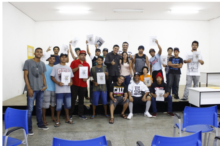
Figura 5: Turma do projeto Casa Cultural. Sem título. 2016. Fotografia digital.