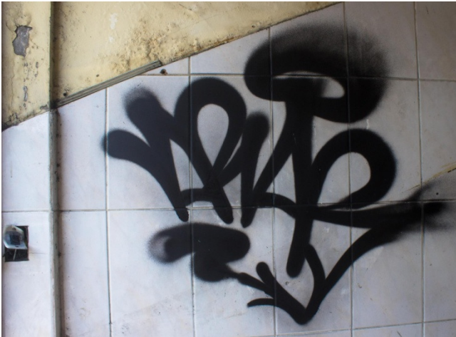
Figura 10: Exemplo de Tag . Fonte: Arquivo pessoal. Sem título. 2017. Fotografia digital.