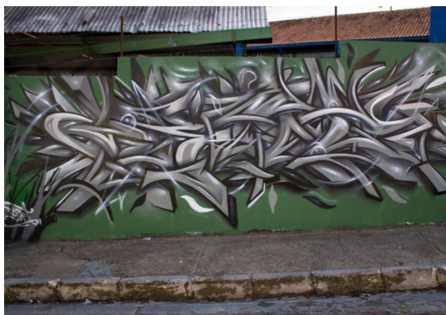
Figura 8: Graffiti no estilo wildstyle . Sem título. 2016. Fotografia digital.