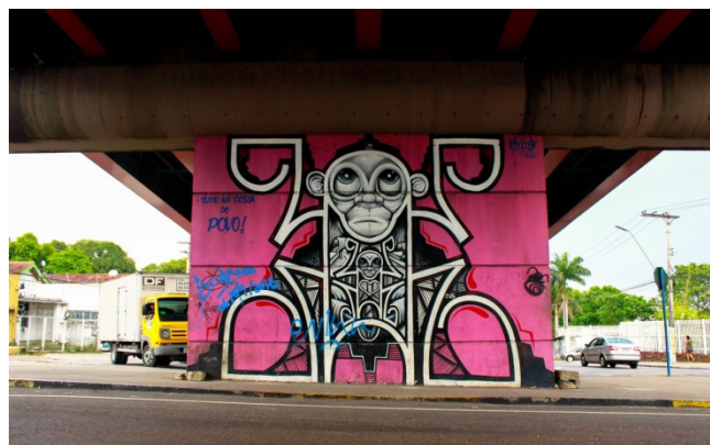
Figura 6: Graffiti no viaduto. Sem título. 2016. Fotografia digital.