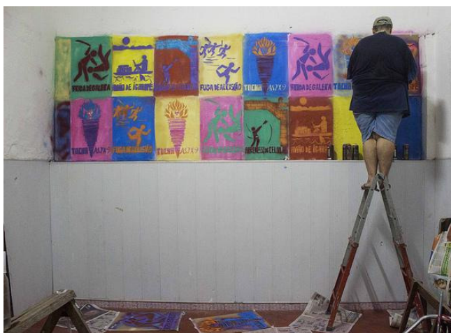
Figura 4: Compacto.Arte do Coletivo Difusão. Sem título. 2016. Fotografia digital.