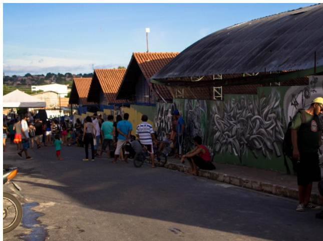
Figura 3: Evento Black&White. Sem título. 2016. Fotografia digital.