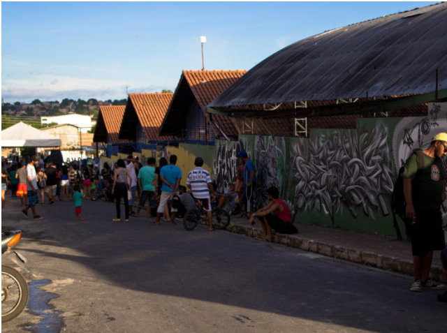
Figura 3: Evento Black&White. Sem título. 2016. Fotografia digital.