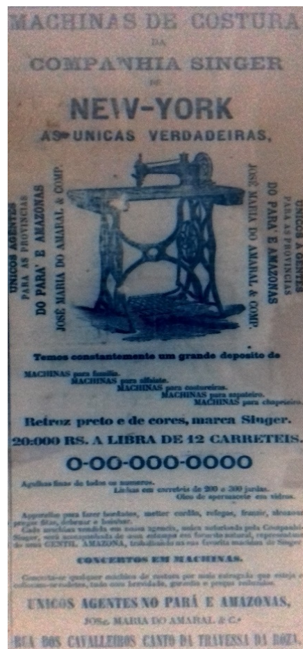
Imagem 7 – A Província do Pará, 9 jan. 1877, n. 232, p. 3.