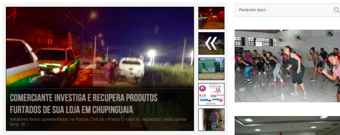
Figura 3 – Página principal do jornal Folha de Vilhena.