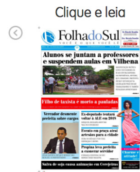
Edição nº 1153 de 18 a 24 de março de 2017

As matérias possuem autoria creditada ao fim do texto, com a data na parte superior à esquerda e com as informações precisas do dia e horário em que foram publicadas no site. O jornal não possui indicação do trajeto de como o leitor chegou naquela informação, apenas uma classificação simples da categoria onde se encontra a informação, não sendo possível acompanhar o conteúdo de forma sequencial. Não há também um mapa de navegação para facilitar a trajetória. Ao final das matérias,