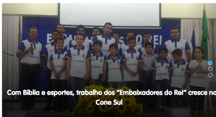
Figura 2 – Página principal do jornal Folha do Sul.