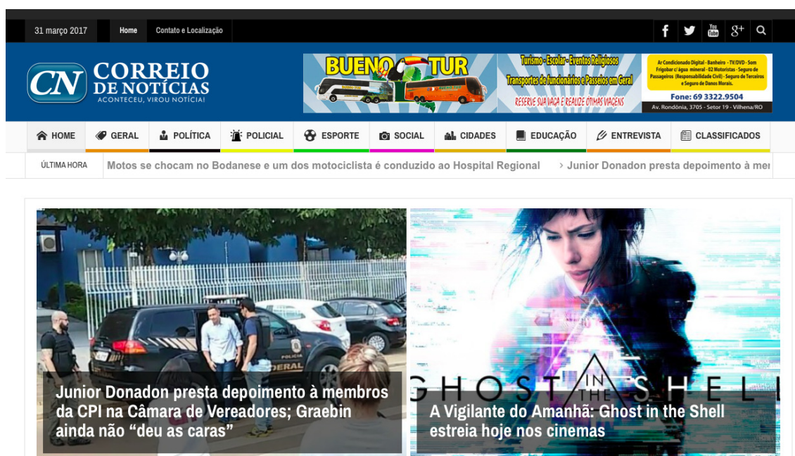
Figura 4 – Página principal do jornal Correio de Notícias.

médias e quatro com fotos pequenas. Na terceira coluna, ao lado de geral, são disponibilizadas as Últimas – com as quatro matérias mais recentes –, depois a Mais Popular – um mosaico com várias publicações – e por última quatro matérias sem imagem da Educação.