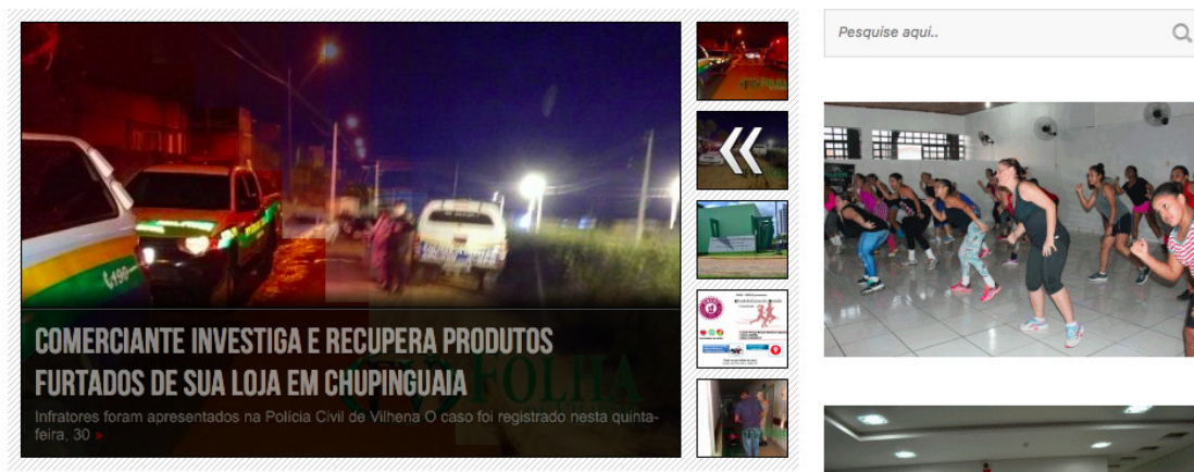
Figura 3 – Página principal do jornal Folha de Vilhena.