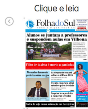
Edição nº 1153 de 18 a 24 de março de 2017

As matérias possuem autoria creditada ao fim do texto, com a data na parte superior à esquerda e com as informações precisas do dia e horário em que foram publicadas no site. O jornal não possui indicação do trajeto de como o leitor chegou naquela informação, apenas uma classificação simples da categoria onde se encontra a informação, não sendo possível acompanhar o conteúdo de forma sequencial. Não há também um mapa de navegação para facilitar a trajetória. Ao final das matérias,