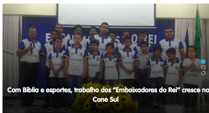
Figura 2 – Página principal do jornal Folha do Sul.